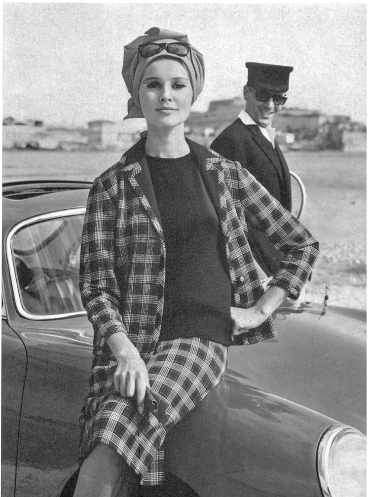
Dreiteiliges Ensemble mit Jupe und Jacke aus reinwollenem Wevenit-Trikot

Zur Fabrikation werden keine Mischfasern verarbeitet, sondern ausschliesslich australische Merinowolle für den grössten Teil der Produktion, sowie Fil d'Ecosse und ein gewisses Quantum Shetland und Mohair. Die Artikel sind nicht stückgefärbt, sondern sie sind alle aus garn- oder sogar fasergefärbter Wolle oder Baumwolle gearbeitet. Die meisten Modelle sind dekatiiert; sie gehen daher nicht ein, und alle Strickwaren aus Tierfasern sind durch die « Mitin »-Behandlung vor den Motten geschützt.