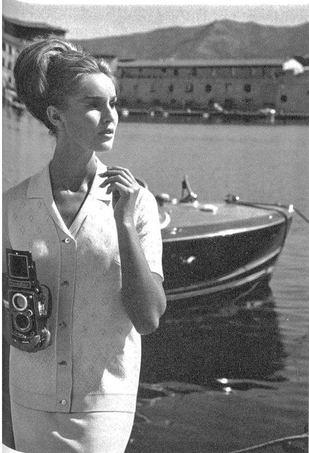
Hübsches Deux-Pièces in Phantasie-Trikot aus mercerisierter Baumwolle