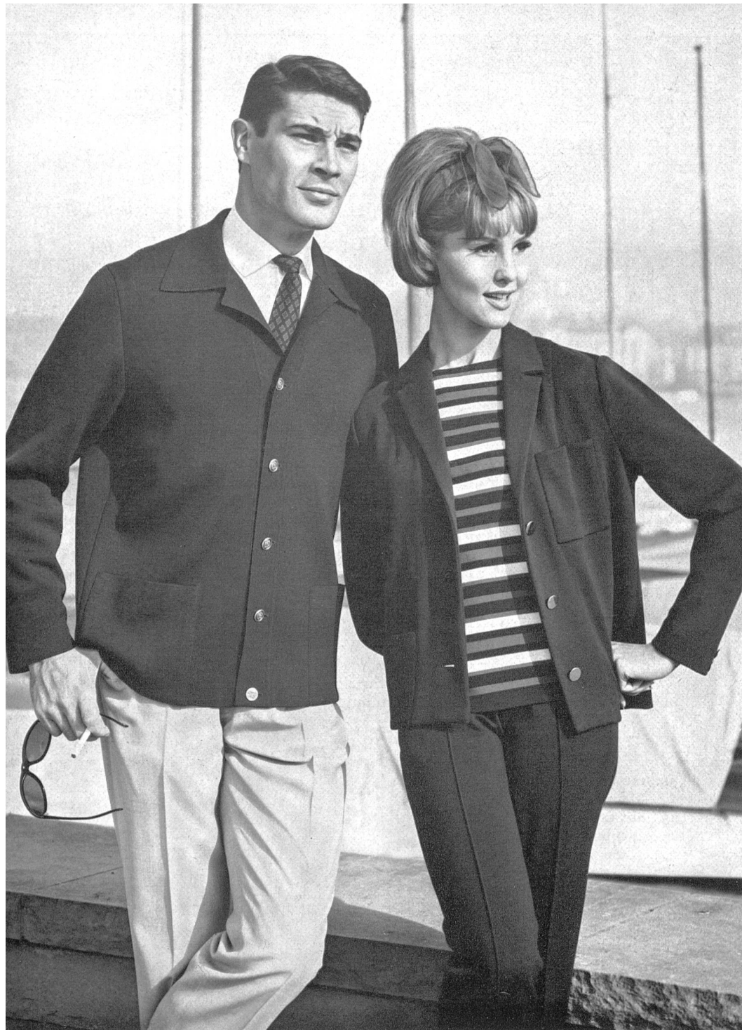
Eleganter reinwollener Herren-Blazer. Rassisches reinwollenes Trikot-Ensemble: Blazer, quer-gestreifter Phantasiepullover und Hose

Die Herstellung von Qualitätsstrickwaren stellt auch noch andere Ansprüche: das Walken, das den gestrickten Modellen vermehrte Weichheit im Toucher gibt, aber auch und vor allem die Verwendung von zweckentsprechenden Strickmaschinen.