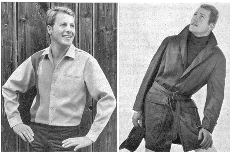
Zwei McGregor-Modelle der Aktiengesellschaft Fehlmann Söhne

«Aus dieser Überlegung heraus sehen wir unser Ziel darin, mit Hilfe einer starken, gesunden Unternehmung