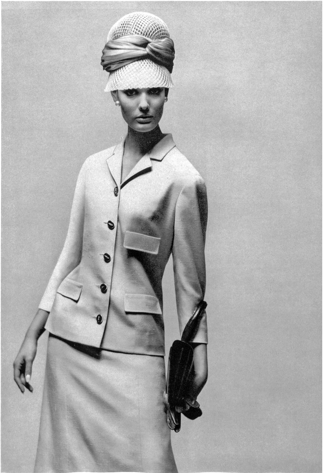
HERMES Pure soie « Sandra » de Robt. Schwarzenbach & Co., Thalwil