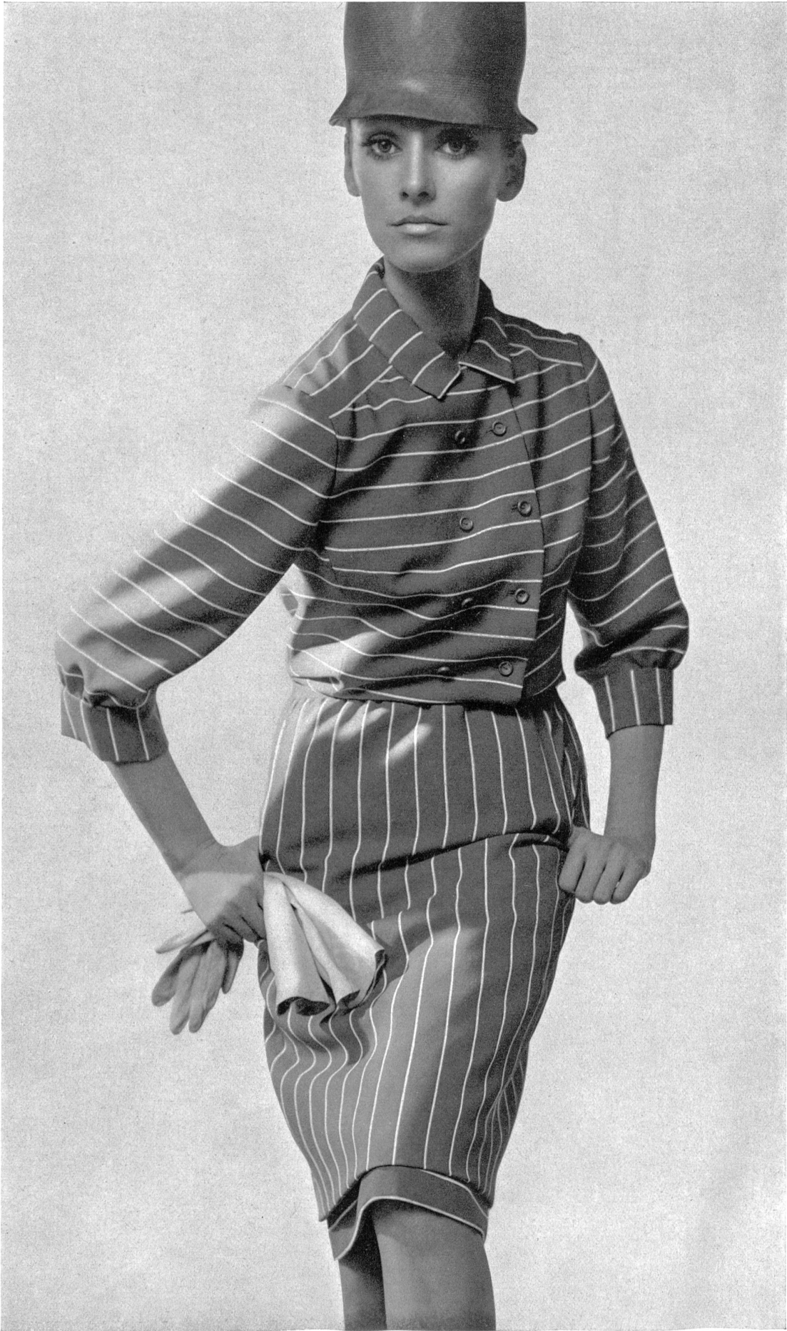
JACQUES HEIM Crêpe « Charleston » imprimé de L. Abraham & Cie, Soieries S. A., Zurich