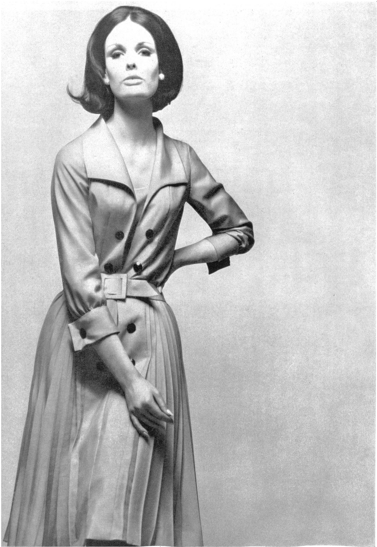
MAGGY ROUFF Pure soie « Tussahline » de Robt. Schwarzenbach & Co., Thalwil