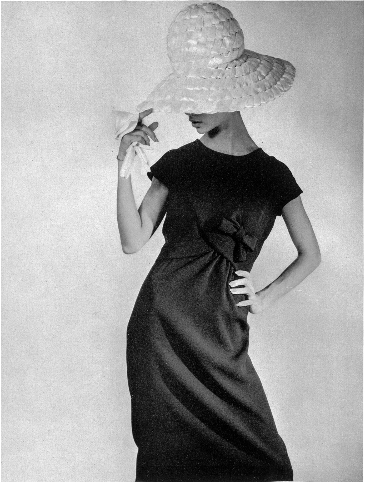
FERRERAS Crêpe « Sambora » de la S. A. Stünzi Fils, Horgen