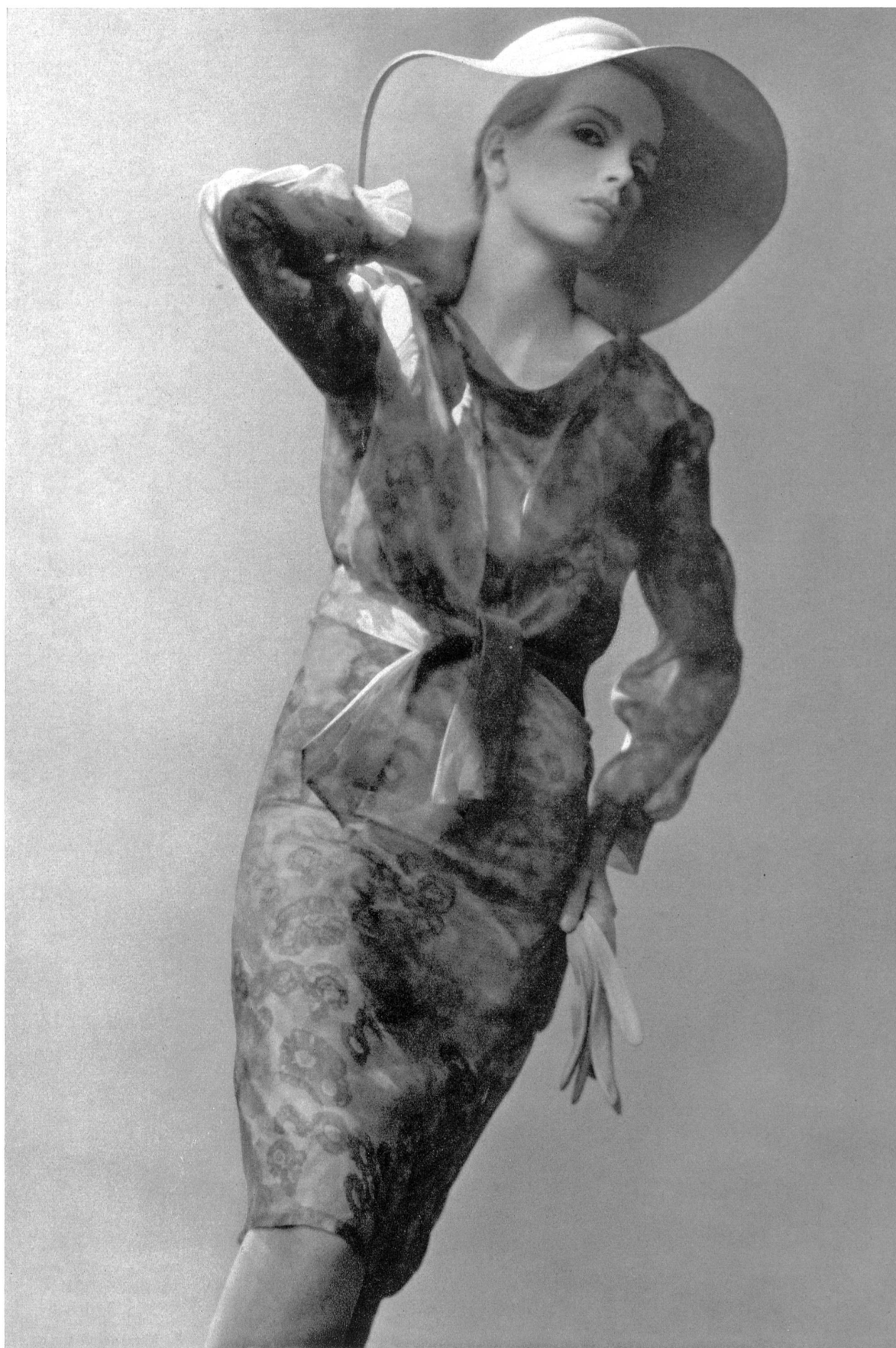
PIERRE BALMAIN Shantung et organdi de soie imprimés « Dauphine » et « Basra » de L. Abraham & Cie, Soieries S. A., Zurich

MODÈLES EXCLUSIFS — REPRODUCTION INTERDITE