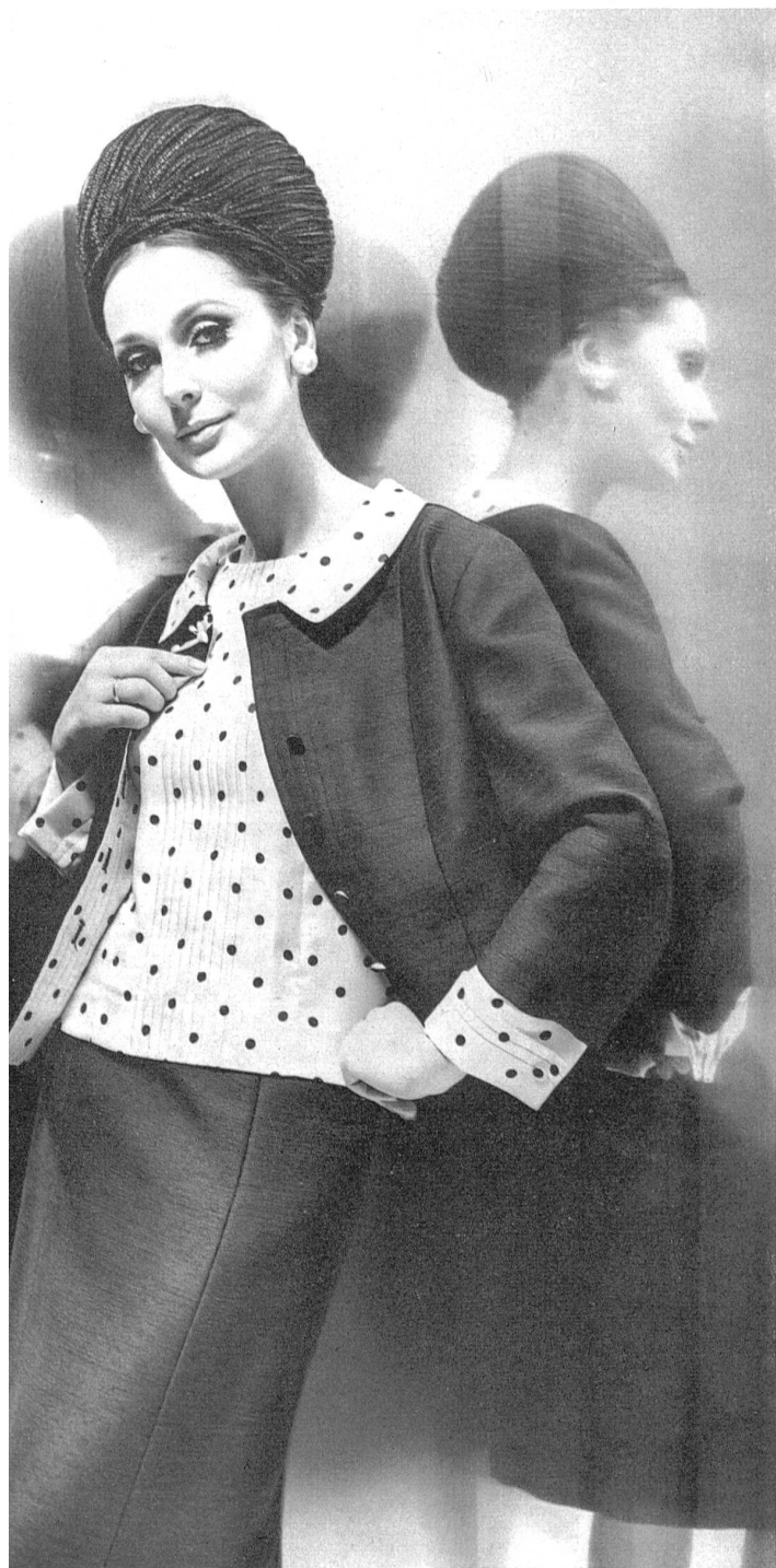
HEER & CIE S.A., THALWIL Shantung fibranne infroissable (crease resisting / inarrugable / knitterfrei) et twill imprimé (printed / estampado / bedruckt) Modèle Willy Meyer S.A., Zurich