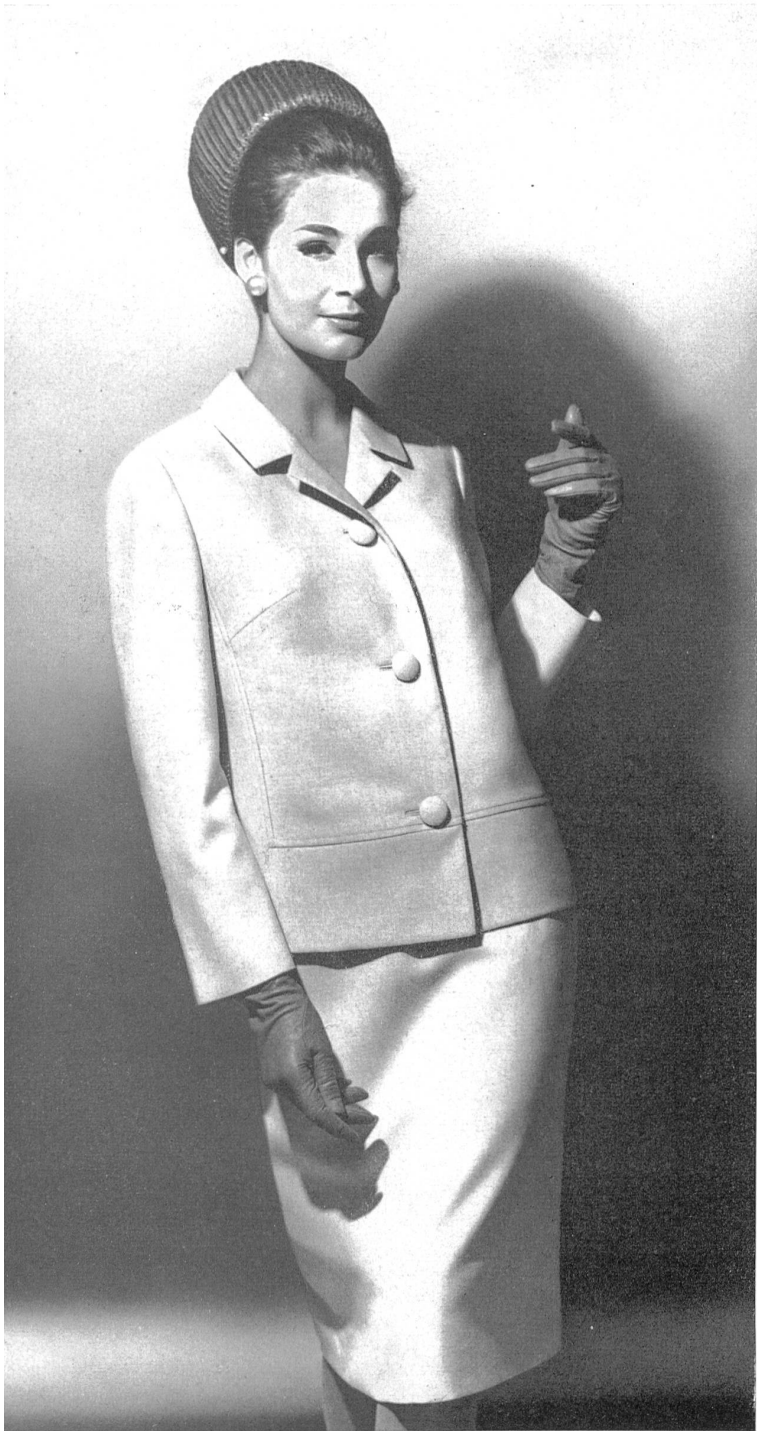
HEER & CIE S.A., THALWIL Fresco de « Terylène » et laine (« Téry- lène » and Wool / « Terileno » y lana / « Terylene » und Wolle) Modèle Paul Weibel A.G., Gossau