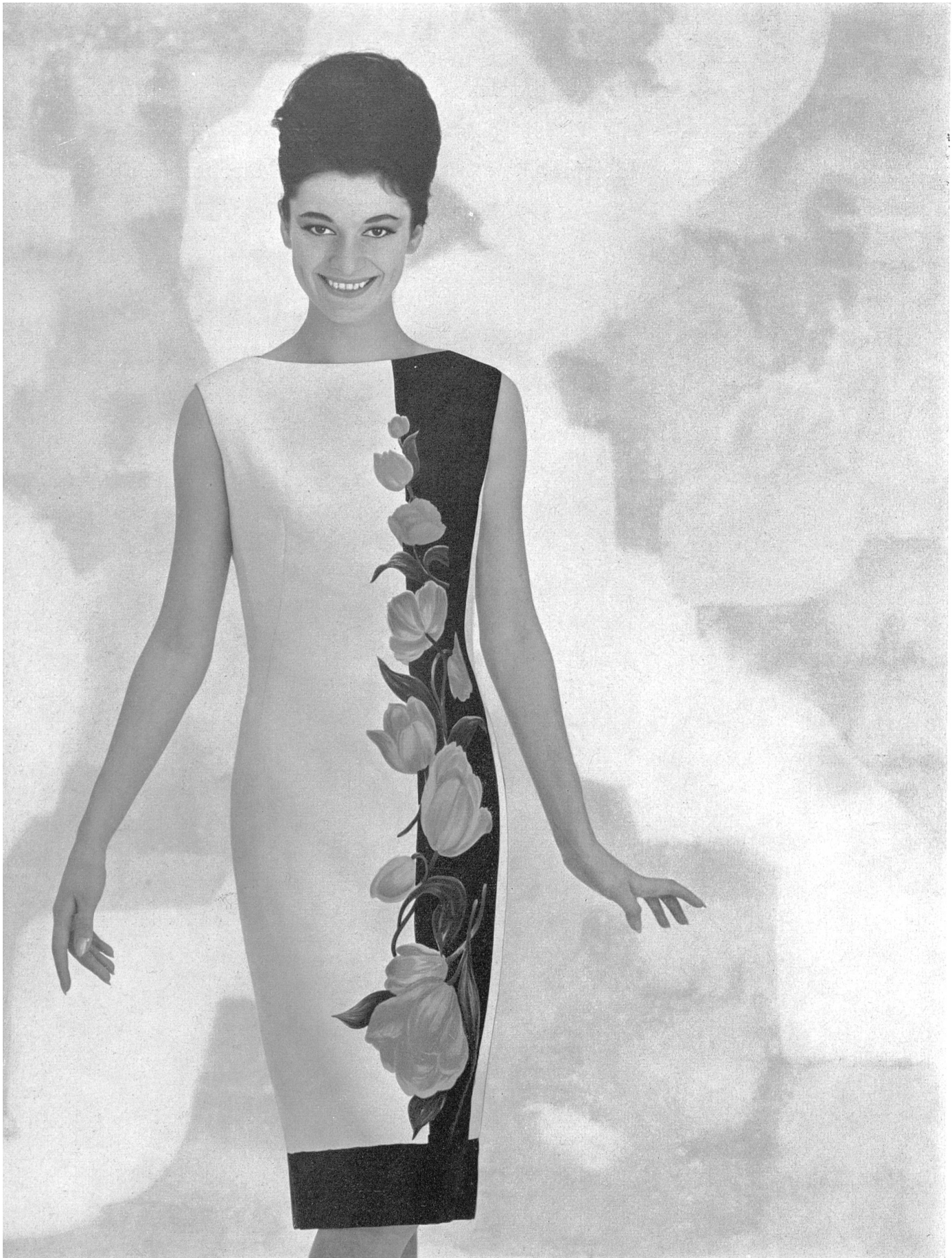
HEER & CIE S.A., THALWIL Panama de coton imprimé Printed basket weave cotton Panama de algodón estampado Baumwoll-Panama bedruckt Modèle Rena S.A., Zurich