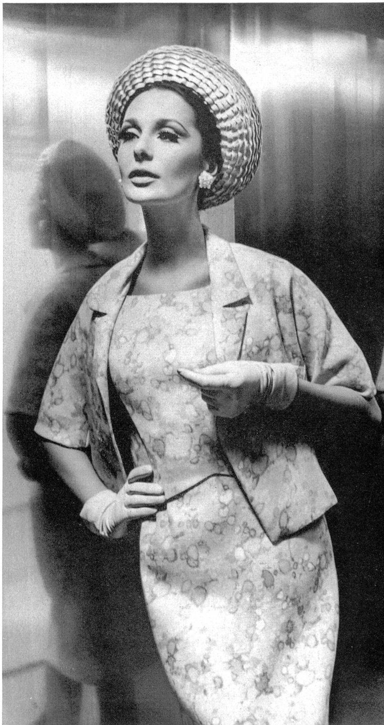
HEER & CIE S.A., THALWIL Fresco shantung imprimé (printed / estampado / bedruckt) Modèle Willy Meyer S.A., Zurich