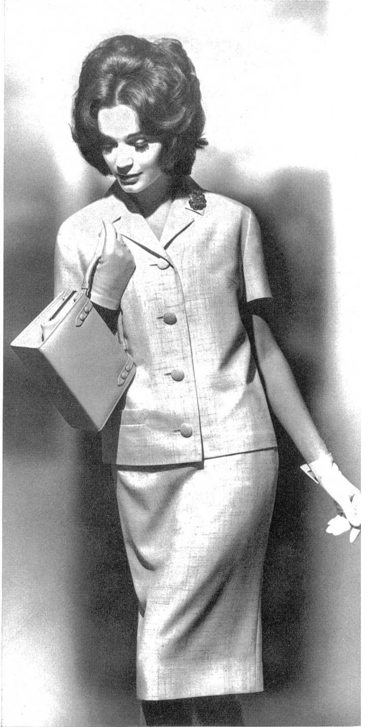
HEER & CIE S.A., THALWIL Shantung de « Terylène » et laine (« Tery- lene » and wool / « Terileno » y lana / « Terylene » und Wolle) Modèle Paul Weibel A.G., Gossau