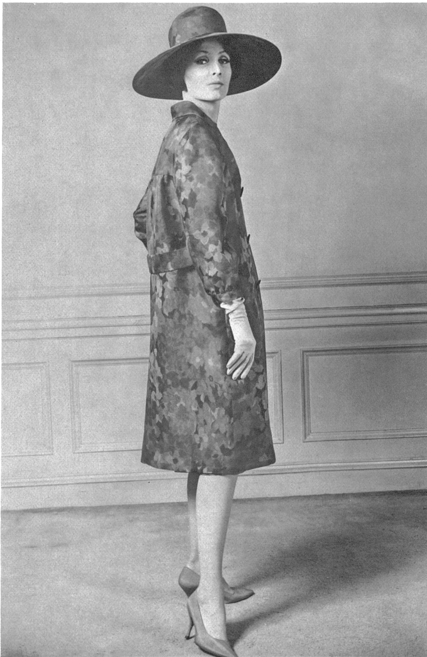
L. ABRAHAM & CIE, SOIERIES S.A., ZURICH Basra imprimé orange, rouge et jaune Printed Basra in orange, red and yellow Modèle: Elisabeth Arden, New York

Seit Jahrhunderten, und schon vor unserer Aera, durchläuft die Mode eine parallele Entwicklung. Die reichen Leute pflegten sich auf eine Weise zu kleiden, die