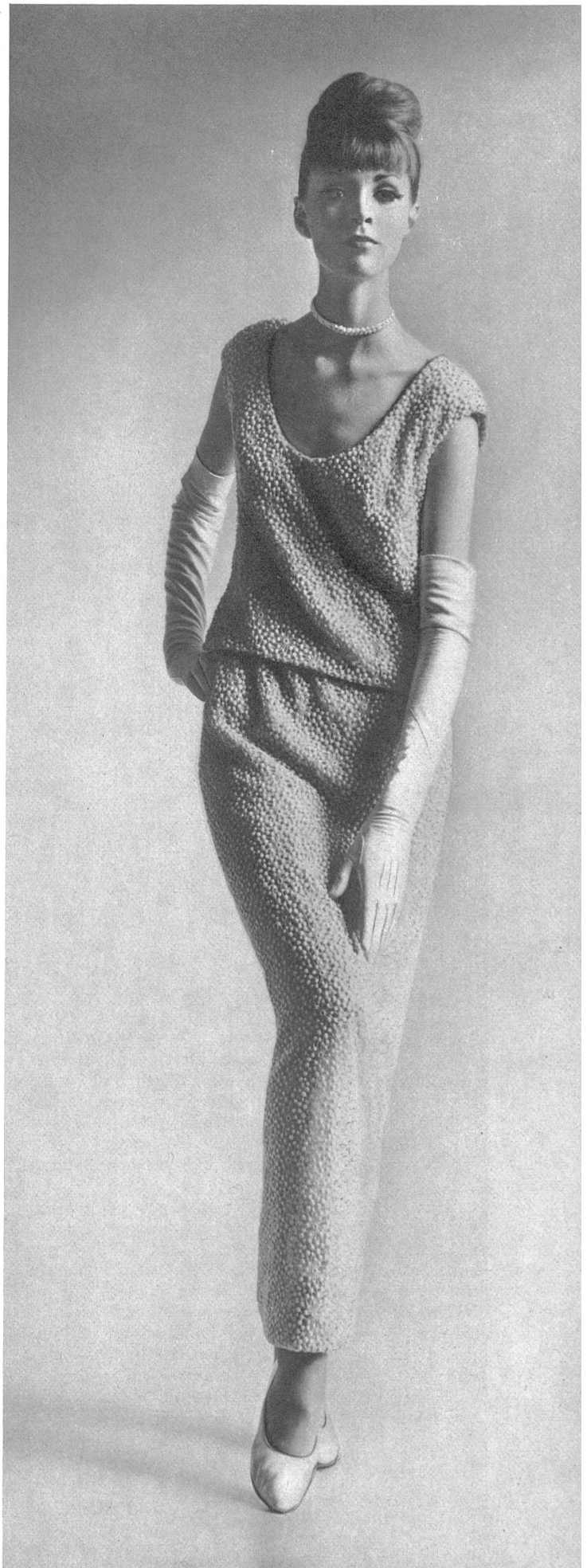
FORSTER WILLI & CO., SAINT-GALL Broderie guipure Guipure lace Modèle: Werlé of Beverly Hills

Daraus geht hervor, dass alles, was auf Raffinement beruht, eigentlich nie einfach sein kann. Die Einfachheit im Schnitt verlangt nach einem Ausgleich, der mit erlesenen und komplexen Geweben geschaffen wird. Der Erfindungsgeist, die Originalität und der Geschmack der Schweizer Textilschöpfer kommen diesem gemeinsamen Bedürfnis der Mode entgegen, treffen diesen Stich von