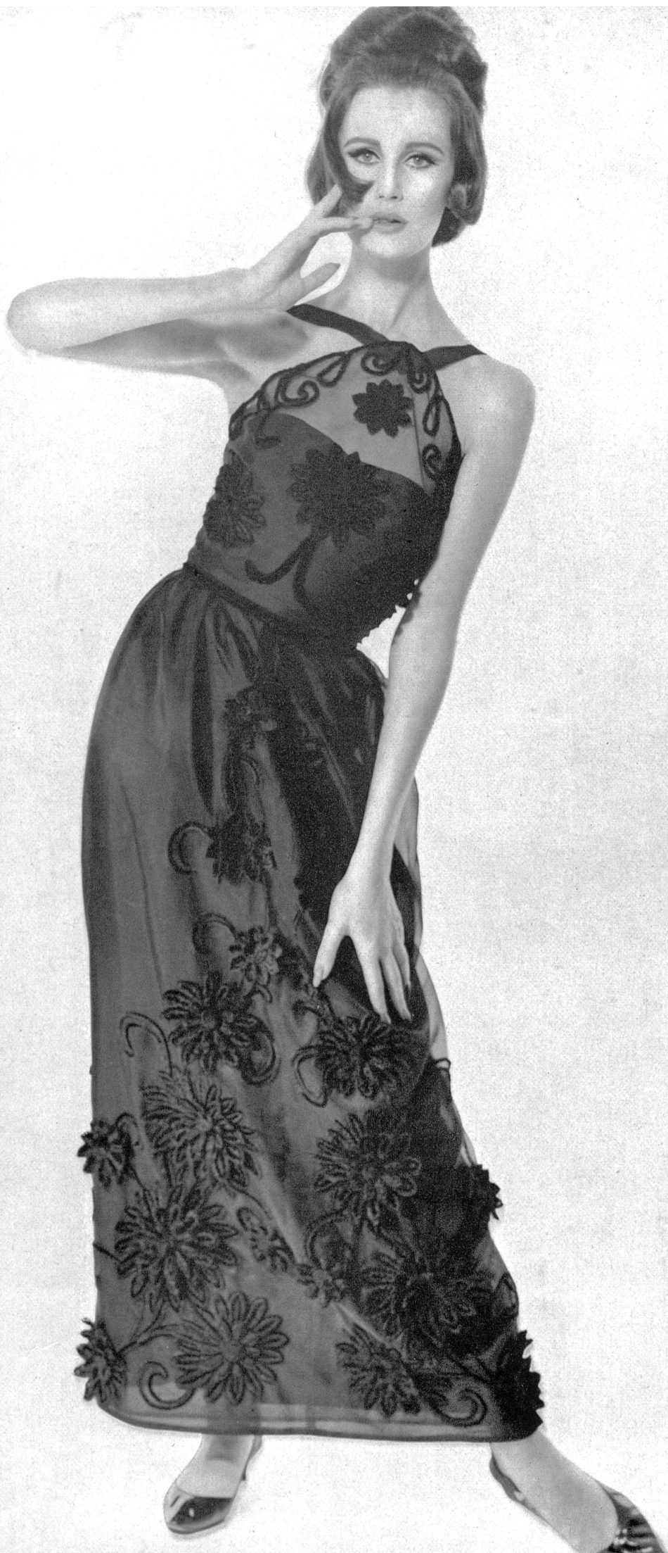
A. NAEF & CIE S.A., FLAWIL (SAINT-GALL) Broderie chenille noire Schwarze Chenille-Stickerei Modèle: Toni Schiesser, Francfort/M.