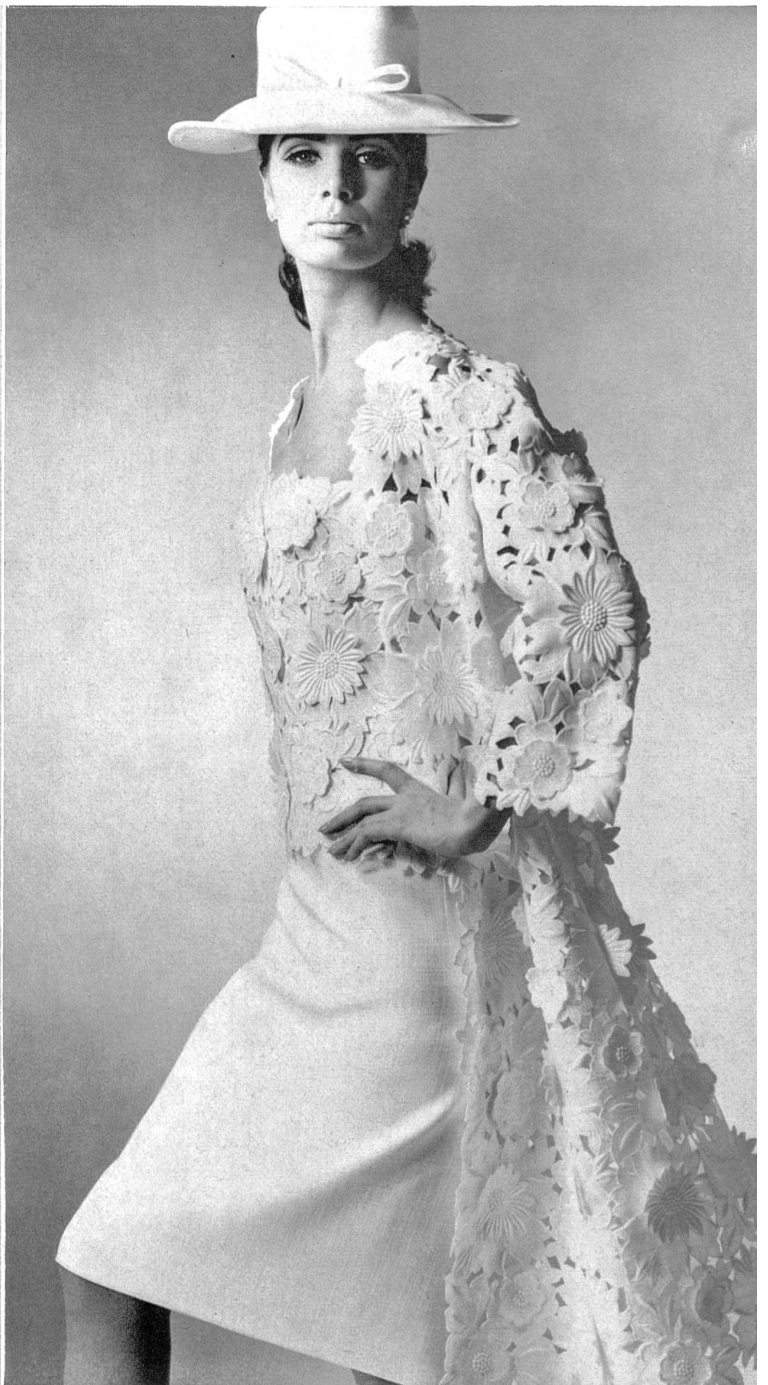
A. NAEF & CIE S.A., FLAWIL (SAINT-GALL) Broderie découpée avec applications Spachtelstickerei mit Applikationen Modèle: Toni Schiesser, Francfort/M.