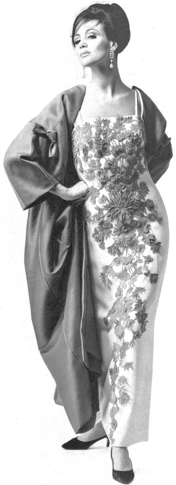
FORSTER WILLI & CO., SAINT-GALL Galon brodé sur velours Bestickter Samtgalon Modèle: Toni Schiesser, Francfort/M.