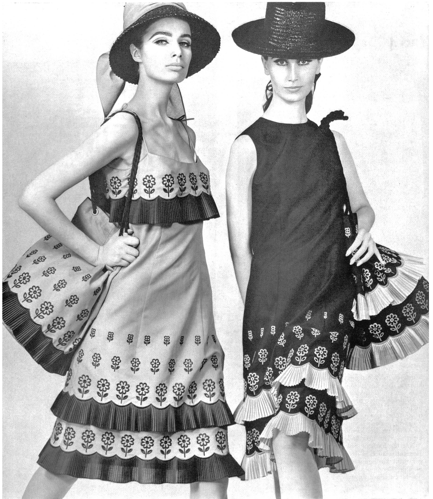
UNION S.A., SAINT-GALL Broderie sur coton Baumwollstickerei Modèles: Toni Schiesser, Francfort/M.