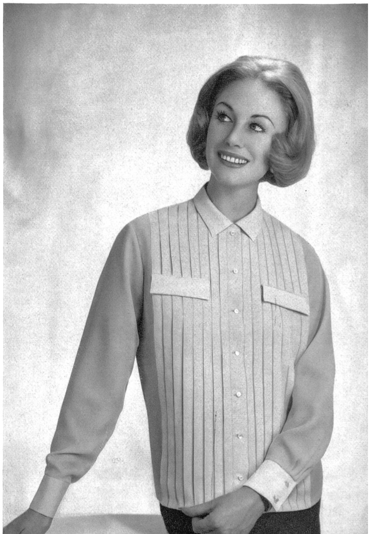
« RECO », REICHENBACH & CO. S.A., SAINT-GALL Crêpelaine Modèle: Rothkirch, Hildesheim

Nur für festliche Stunden — da will man Glanz und Romantik, auch in der Kleidung. Da kann das Material gar nicht kostbar und exklusiv genug sein. Da möchte man die Rivalinnen ausstechen, um jeden Preis — selbst den langwieriger Anproben!