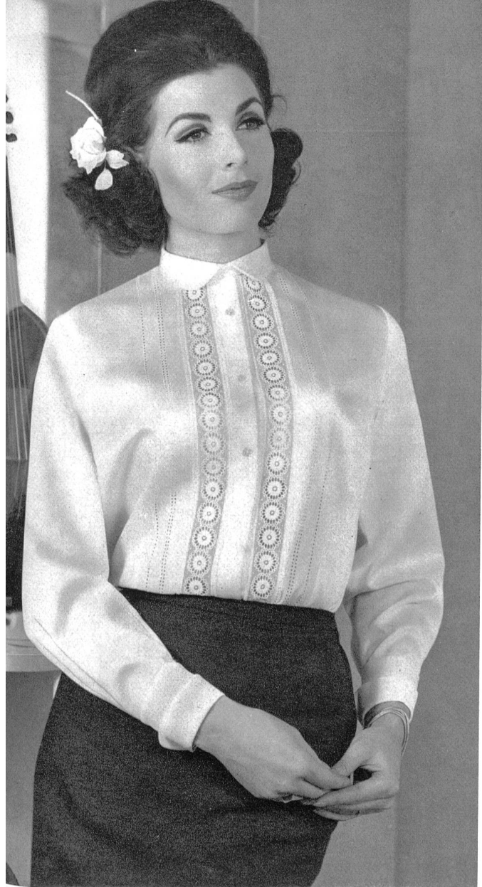
« RECO », REICHENBACH & CO. S.A., SAINT-GALL Satin brodé, avec applications de broderie chimique Bestickter Satin mit Atzapplikationen Modèle: Wilh. Büngener, Lage

Nicht zu überbieten sind dafür die St. Galler Spitzen und Stickereien, die das Flair des Erlesenen, Einmaligen und Unnachahmlichen haben — und es grosszügig auf die Trägerin ausstrahlen.