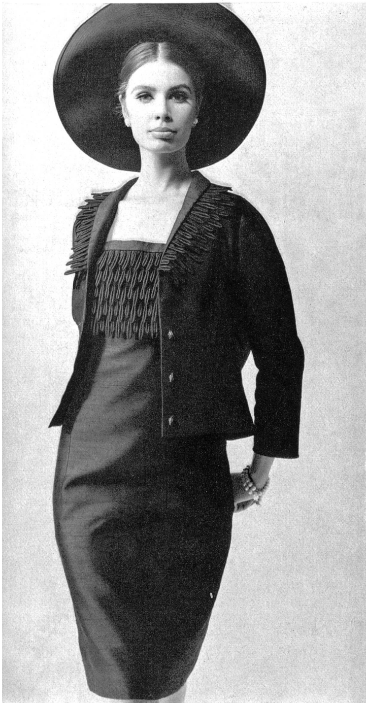
A. NAEF & CIE S.A., FLAWIL (SAINT-GALL) Guipure Ätzstickerei Modèle: Toni Schiesser, Francfort/M.