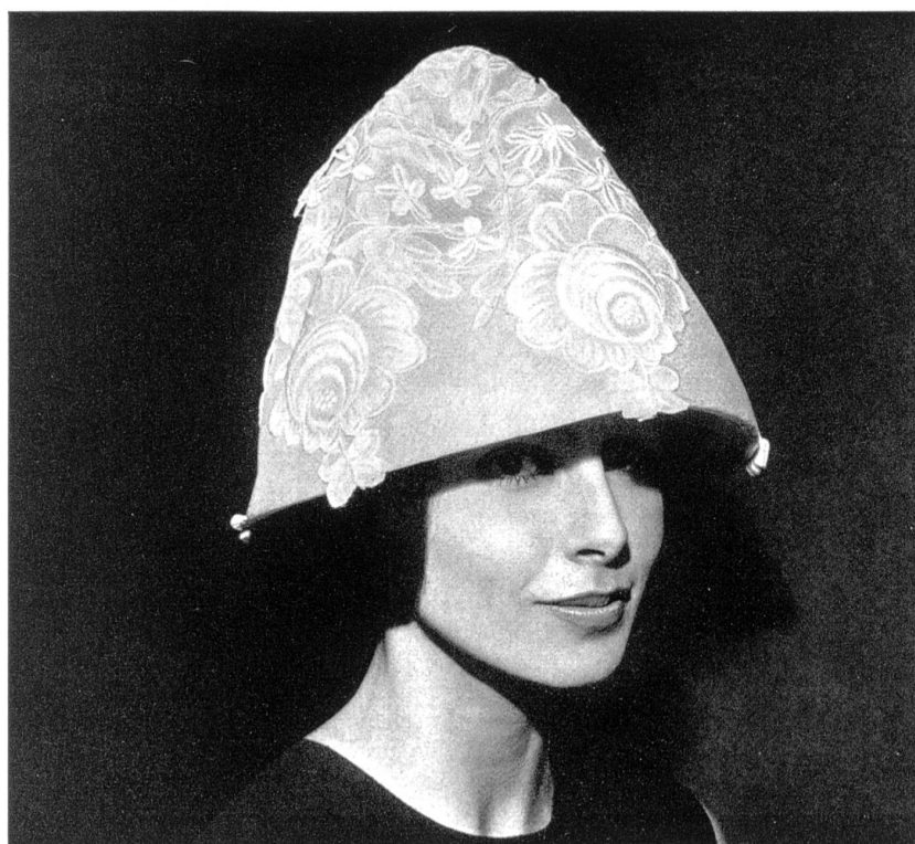
FORSTER WILLI & CO., SAINT-GALL Grands motifs brodés, appliqués sur organdi de soie blanc Large embroidered motifs appliquéd on white organza Modèle: Simone Mirman, Londres