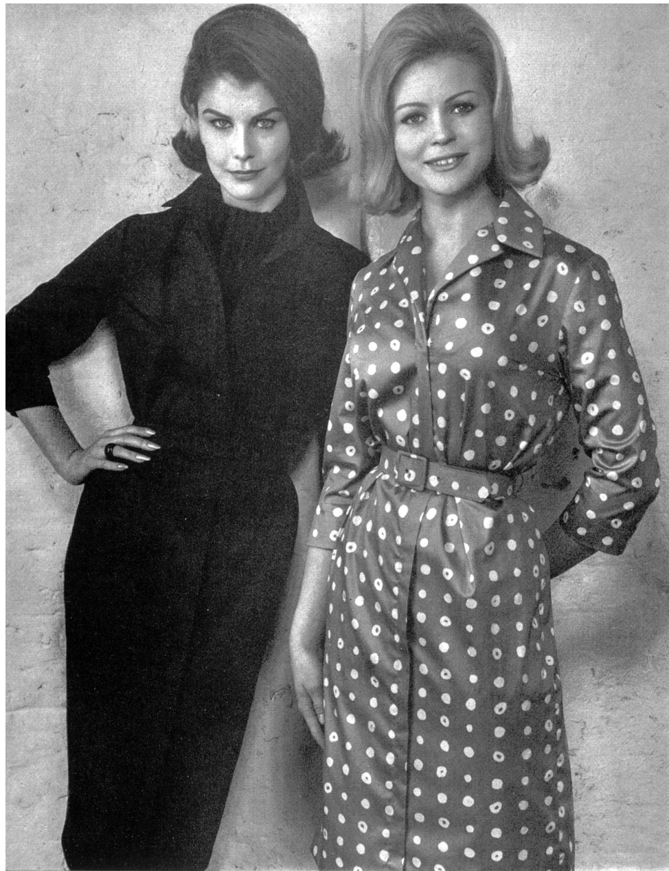
STOFFEL S.A., SAINT-GALL Satin de coton Modèles: Frederick Starke, Londres