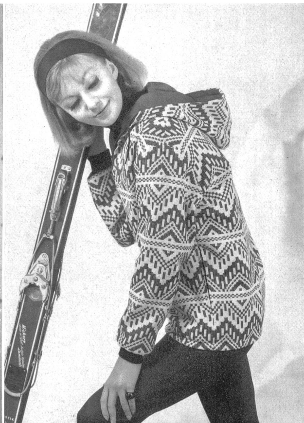
◀◀ « WOCO », WINZELER, OTT & CIE S.A., WEINFELDEN Popeline de coton hydro fugee, imprimée à la main Hand printed water repellent cotton poplin Modèle: Arcy Manufacturing Co., Londres