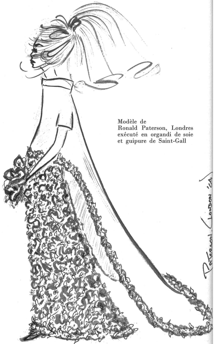
Modèle de Ronald Paterson, Londres exécuté en organdi de soie et guipure de Saint-Gall

Die helvetische Textilindustrie hat in Grossbritannien ihren gesicherten Platz für fast alle Erzeugnisse der häuslichen Versorgung, für die Herrenbekleidung und die