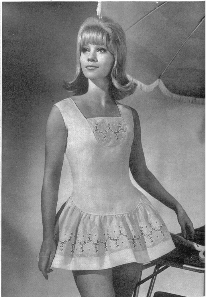
« ERHUCO », EUGSTER & HUBER S.A., SAINT-GALL Broderie sur tissu « Sedusa » en pur « Térylène » « Sedusa », pure « Terylene » embroidered fabric Modèle: Teddy Tinling, Londres