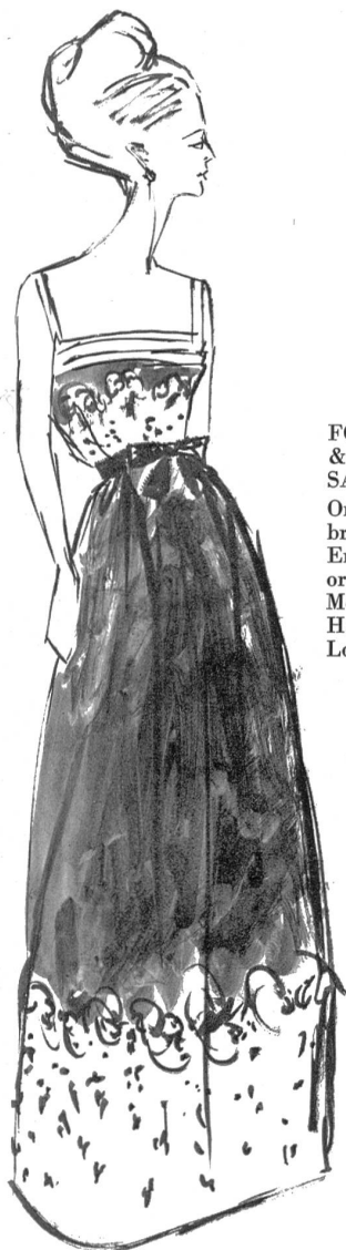
FORSTER WILLI & CO., SAINT-GALL Organdi de soie brodé en bordure Embroidered organza edging Modèle de Hardy Amies, Londres