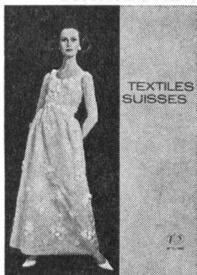
JACQUES HEIM Organza brodé avec motifs de guipure de Forster Willi & Co., Saint-Gall. Grossiste à Paris: Robert Burg & Cie