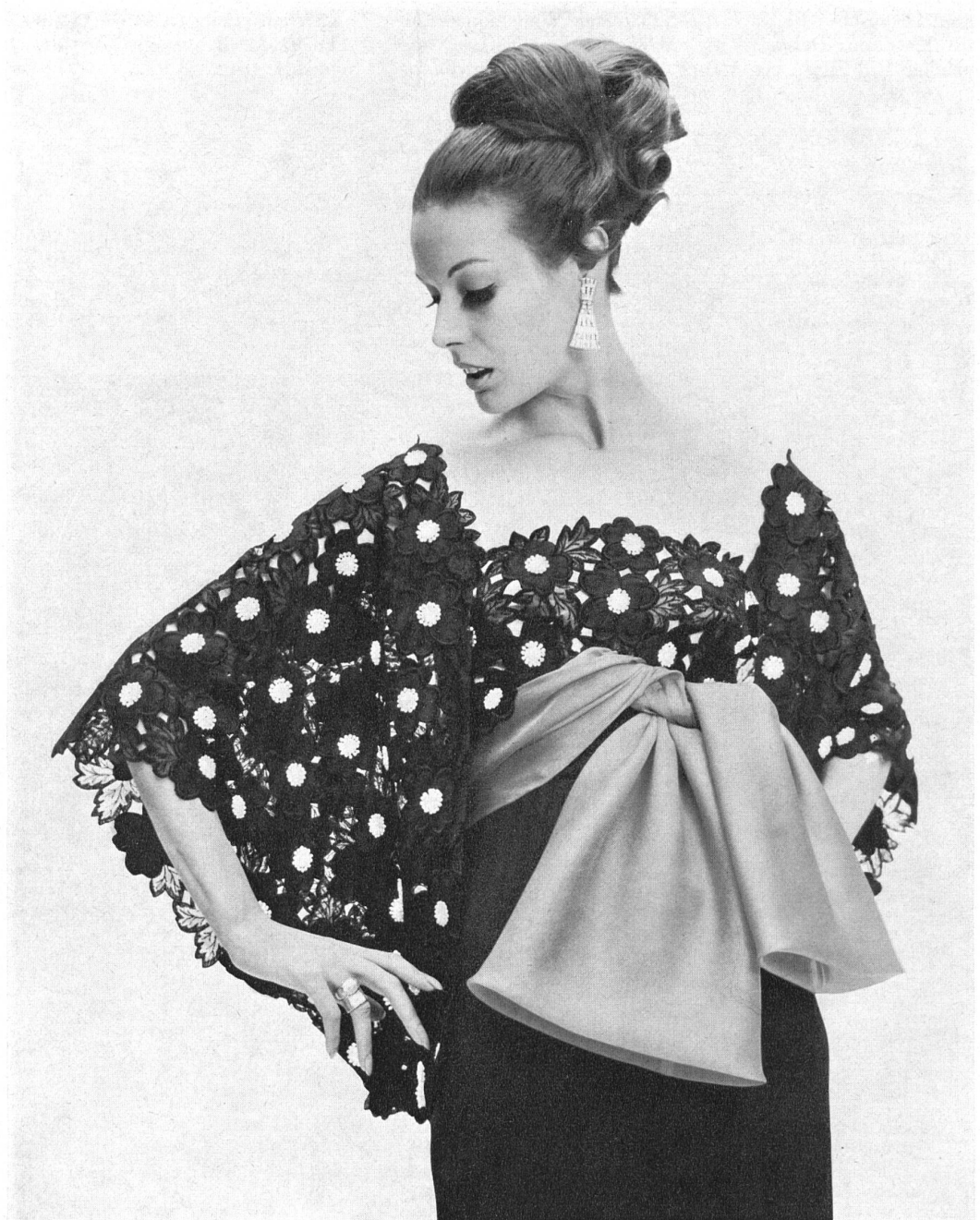
UNION LTD. SAINT-GALL Broderie découpée sur organza de soie noir Black cut-out lace of silk organza Modèle: Hardy Amies, Londres

schöpfer — sein, der es für seine reguläre Kollektion Herbst/Winter 1965 entworfen hat: es ist ein wunderbar schlankes Fourreau von einer trügerischen Einfachheit, aus einem Elfenbein-Gold Lamé von Abraham, das mit einem winzigen Turban aus dem gleichen Stoff mit einer Wolke von hauchfeinem blassgoldenen Tüll getragen wird.