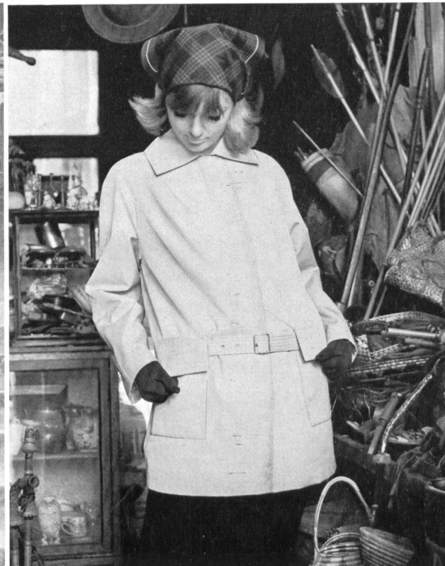
3 STOFFEL LTD., SAINT-GALL Tissu Aquaperl à finissage hydrofuge et antitaches Scotchgard Aquaperl fabric with Scotchgard rain and stain repeller finish Modèles: (à gauche / left) Heptex Ltd., Leeds (à droite / right) Cotsmoor Ltd., London