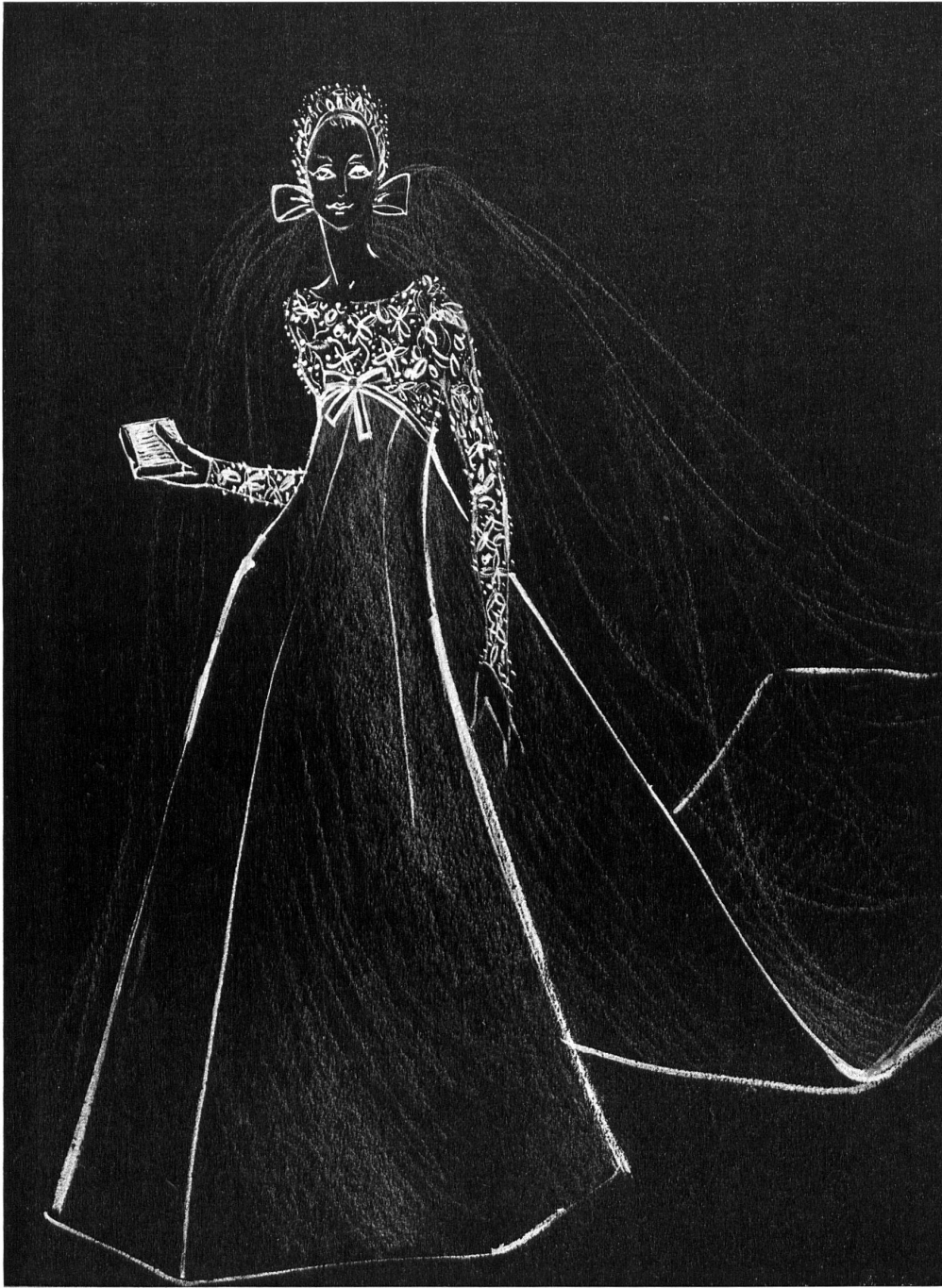
Magnifique robe de mariée; haut et manches avec appli- cations de broderies de: Superb wedding gown; top and sleeves with super- imposed applications of lace by: FORSTER WILLI & CO., SAINT-GALL Rahvis, London

Tartans und warme Pelzfutter liefert, weiss er auch mit seiner Zeit zu gehen und kommt der Nachfrage nach kleineren Preisen mit einer zweiten Couture-Kollektion entgegen, eine Spezialserie eleganter und praktischer Ensembles, die nur einer Anprobe bedürfen und eine Woche nach der Bestellung geliefert werden können. Sein kleiner Salon ist wie immer reich ausgestattet für den Herbst mit Kostümen in leuchtenden, dem Regen trotzenen Farben und mit eleganten kleinen Kleidern für Cocktail und Dinner.