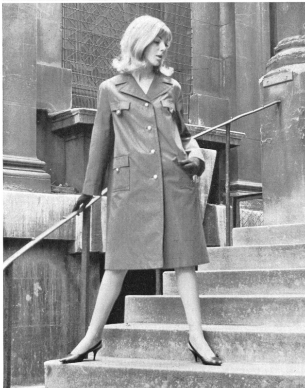
1 STOFFEL LTD., SAINT-GALL Tissu Aquaperl à finissage hydrofuge et antitaches Scotchgard Aquaperl fabric with Scotchgard rain and stain repeller finish Modèle: Morcosia