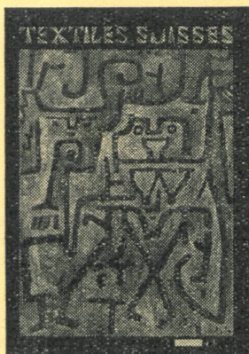
UNSER TITELBLATT Siehe Seite 117