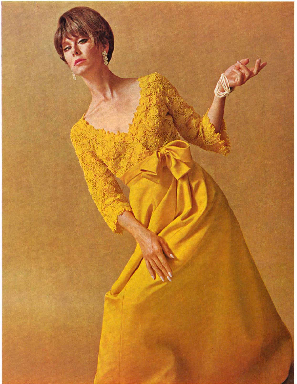
Guipure de coton de Saint-Gall avec applications St. Gall appliquéé cotton guipure Modèle Jean Louis, Los Angeles

Wie die Erde um die Sonne kreist, so ändern auch die Modeschöpfer ihre Richtung, ungestüm oft, dann wieder behutsam. Diese Saison bringt heftige Farbwechsel, subtile Änderungen der Linie. Michael Novarese zeigt eine Kollektion von zurückhaltender Eleganz, die nicht nur körpergerecht ist, sondern künstlerischen Sinn für das Detail verrät. Seine sogenannten «overall»-Kleider sind eigentlich eher «under-all»-Kleider: einfache kleine Dinger, die, zu passenden Jacken getragen, reizvolle