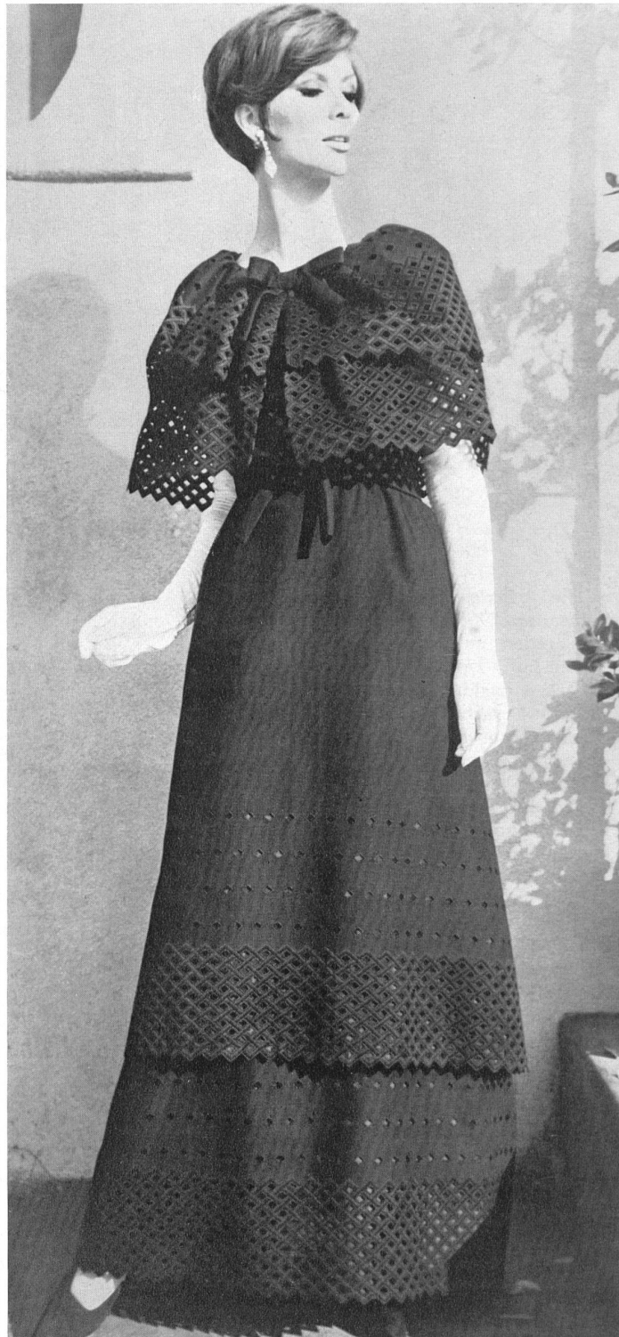
FORSTER WILLI & CO., SAINT-GALL Bordure brodée dans le nouveau style géométrique Embroidered edgings in the new geomet- rical style Modèle Michael Novarese, Los Angeles