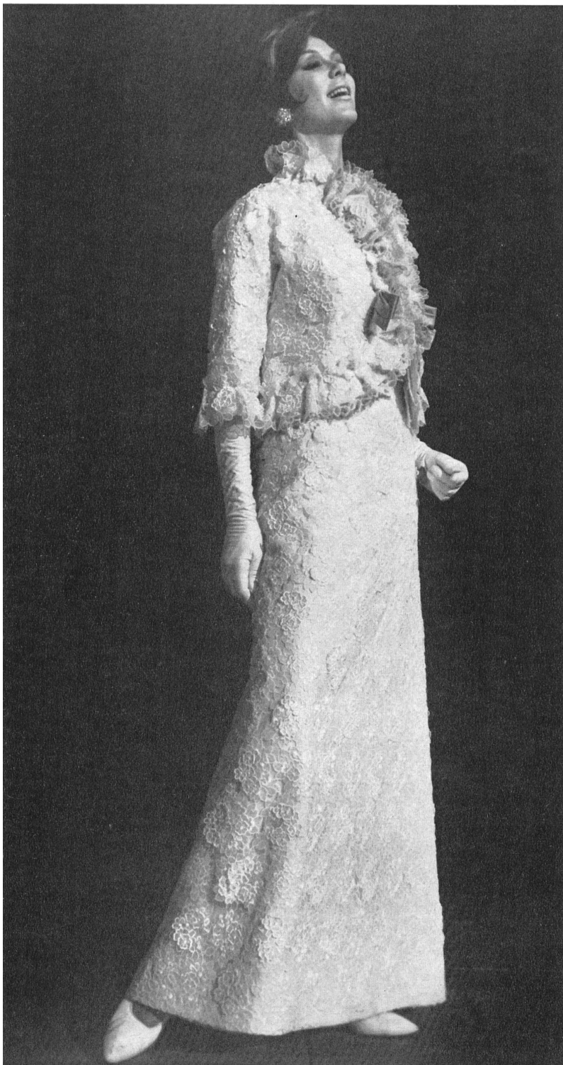
FORSTER WILLI & CO. SAINT-GALL Broderie avec applications sur organza de soie blanc Embroidered white silk organza with appliqué-work Modèle Michael Novarese, Los Angeles

Wechselnde Saison - wechselndes Modebild