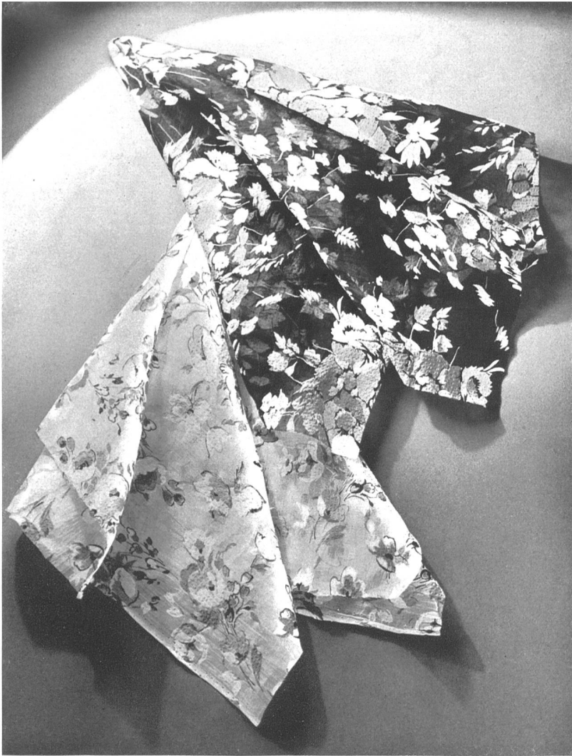
Dernières créations de Taco S. A., Zurich.

La mode a recours aux tissus de coton en matière de décoration. Peut-on renouveler son intérieur sans dépenses excessives ? Oui, car les étoffes de coton offrent pour cela maintes combinaisons. Les percales, le reps, le satin et les mousselines, par leur gamme de coloris clairs ou foncés, par leurs dessins genre ancien ou moderne, s'adaptent à tous les styles. Un choix judicieux parmi ces tissus habillera une pièce avec art et aura l'avantage de ne pas coûter trop cher. C'est dans ce but que les fabricants suisses ont dirigé leurs efforts, et la matière de qualité qu'ils fournissent reste à la portée de tous. M. S.