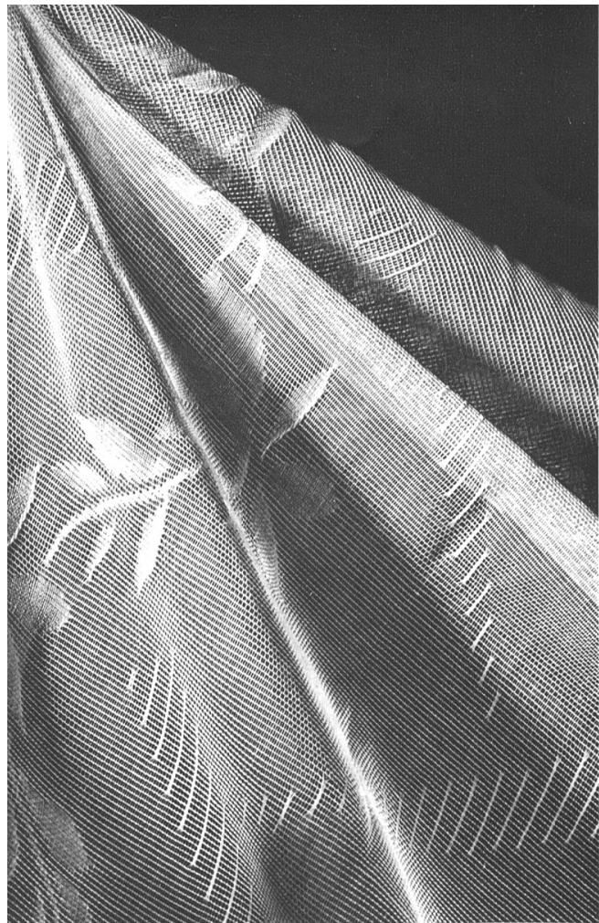
Tissu pour rideaux, marque Emand, d'Emile Anderegg S.A., St-Gall.

constitué la plupart des tenues de plage et des robes d'été, des vastes manteaux, pyjamas, shorts, bains de soleil, turbans, robes de campagne. Les différents tissages du piqué en font un tissu plein de fantaisie: tantôt il est rayé, quadrillé, tantôt pointillé ou chevronné. Quant aux cretonnes aux vifs coloris, les couturiers ont utilisé certaines d'entre elles pour des manteaux du soir, et c'était d'un effet surprenant. Tulles, organdis, mousselines, tissus ajourés de broderies anglaises, c'est vous qui apportez toute cette poésie aux délicates soirées d'été. Les fabricants vous ont dotés des plus jolis agréments en vous tissant, en vous brodant, en vous imprimant. Nous avons, grâce à vous, une collection complète qui s'offre à notre désir.