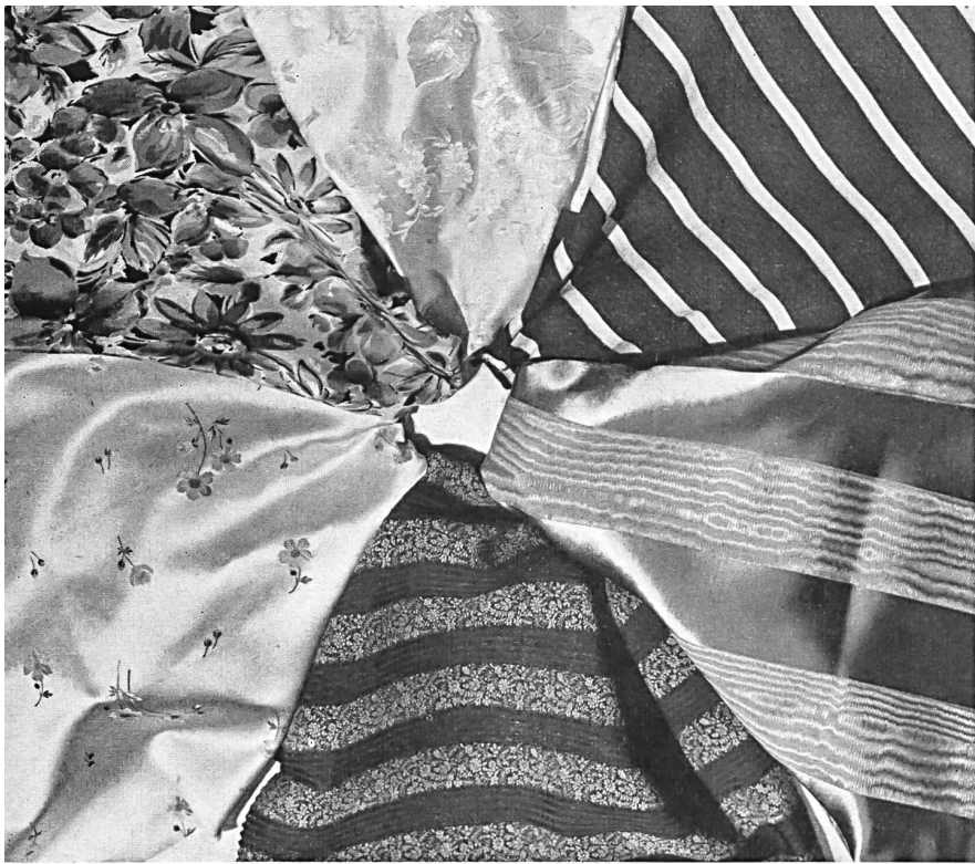
Tissus pour robes fournis par l'Association des fabricants suisses de tissus de soie, Zurich.

La production de l'industrie suisse de la soie est, en effet, extrêmement étendue et les milliers de nouveaux modèles ont trouvé l'approbation de la clientèle des plus grands centres mondiaux de la Haute Couture. Toutes les soies, de la plus simple doublure au brocart le plus riche, sont tissées en Suisse. Qu'il s'agisse de soie ou de rayonne, on trouve dans ce pays les genres