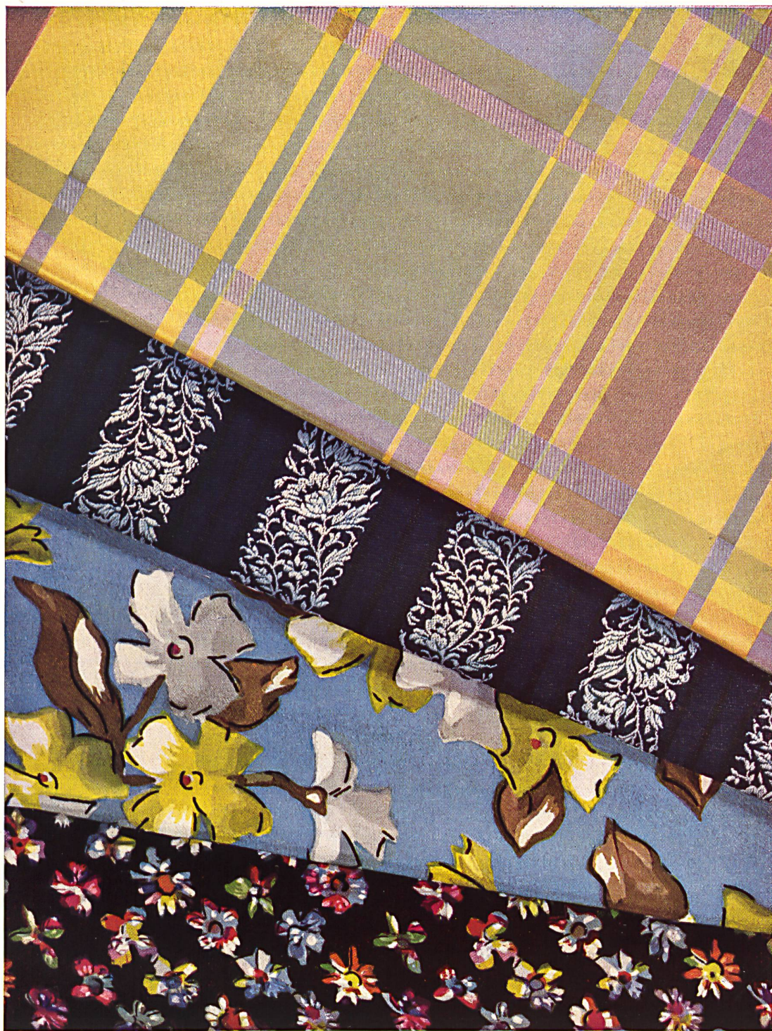
Taffetas quadrillé, Façonné rayé et Crêpes de Chine imprimés de Robt. Schwarzenbach & Co., Thalwil.

Les tissus pour cravates, dont la Haute Couture commence à faire des robes de chambre et des blouses, d'une rare élégance, restent un des articles suisses les plus recherchés pour ses belles qualités.