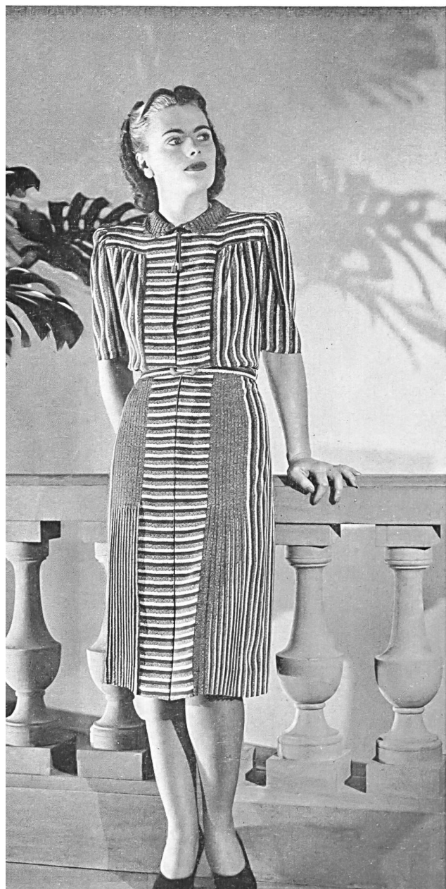
Robe de soie de C. Baumann, Zurich.

La tâche infiniment délicate de choisir avec goût et d'appliquer pratiquement les tendances diverses inspirées par les grands maîtres de la Haute Couture incombe à quelques ateliers spécialisés de la confection zuricoise.