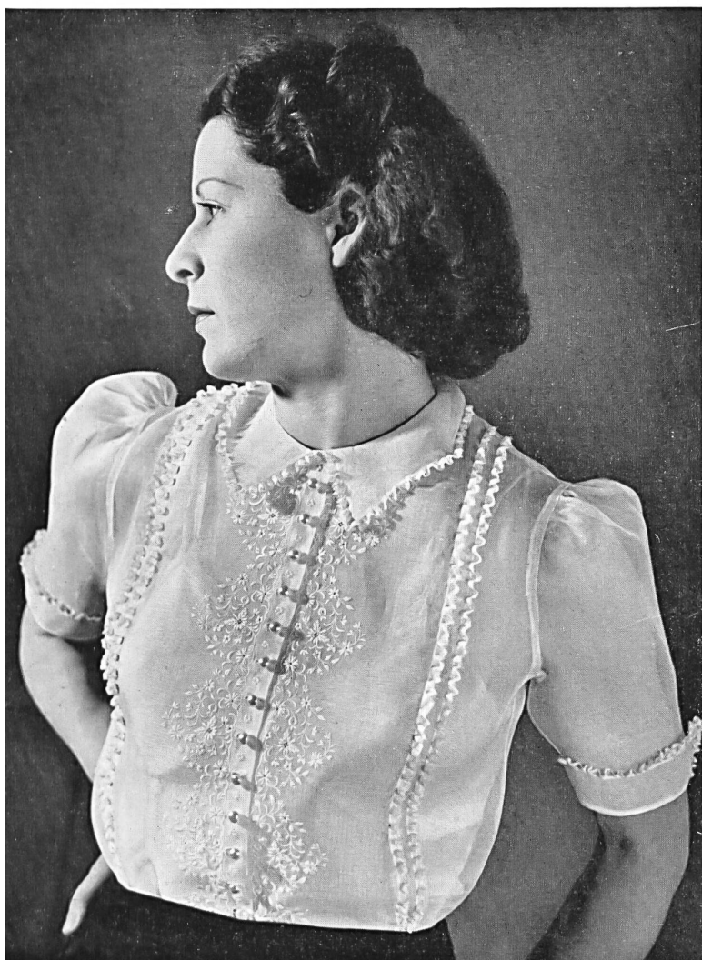
Blouse d'organdi brodé de Haury & Cie, St-Gall.

qui auront tous les suffrages. Cependant les robes de soie noire resteront toujours appréciées pour leur distinction et leur style parfaits.