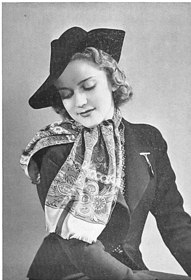
Echarpe de soie de F. Blumer & Cie, Schwanden.

Le choix de coupes, couleurs et tissus pour les robes de dîner et de gala est très grand. Pendant la saison chaude, ce seront certainement les tissus légers et vaporeux — organdi et dentelles —