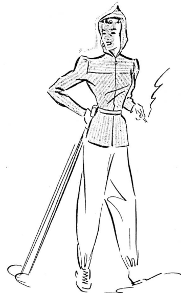
Modèles de E. Kneubuhler, Fabrique de vêtements, Zofingue