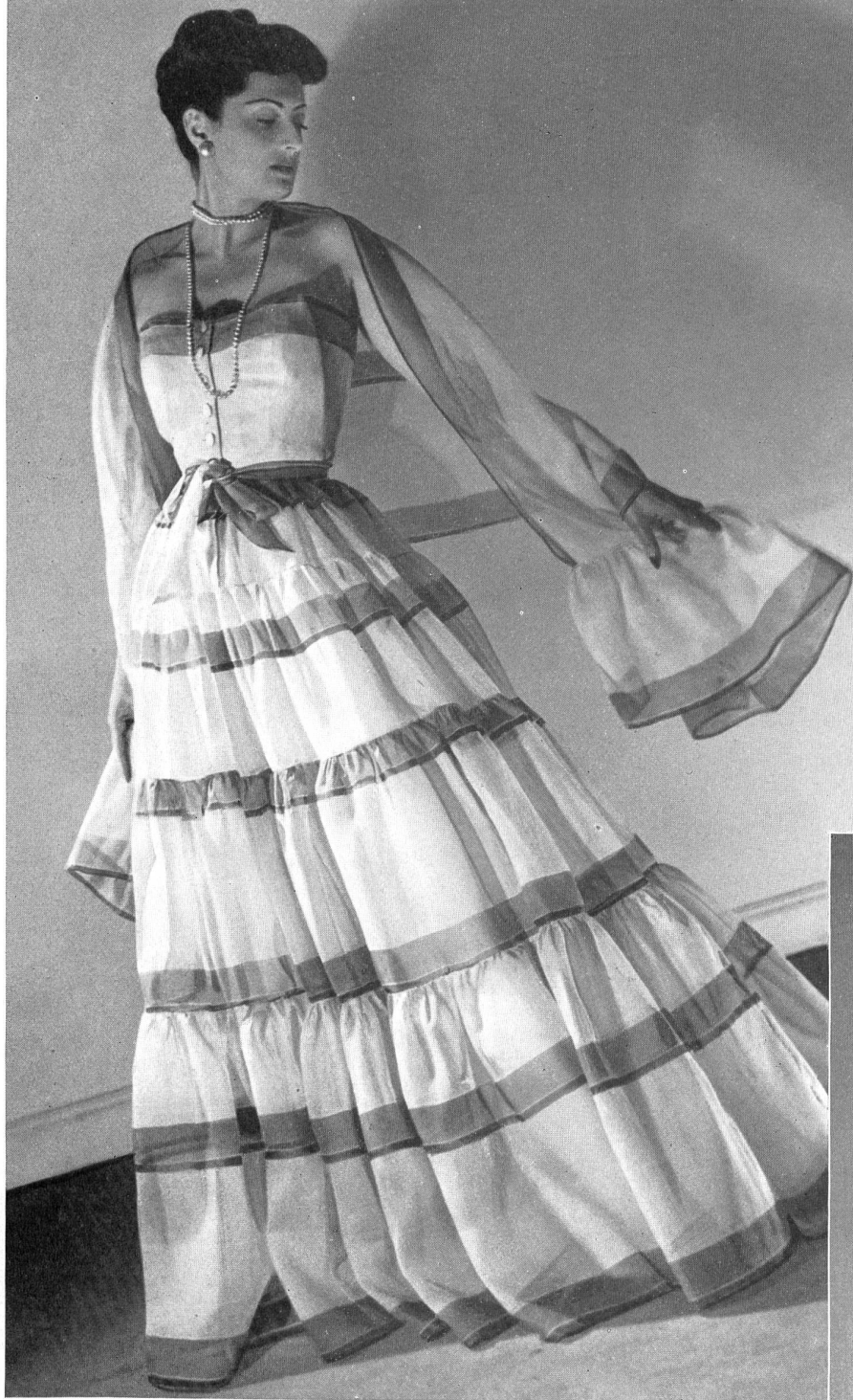
BALENCIAGA Stoffel & Cie, St-Gall. INAMO, ZURICH.