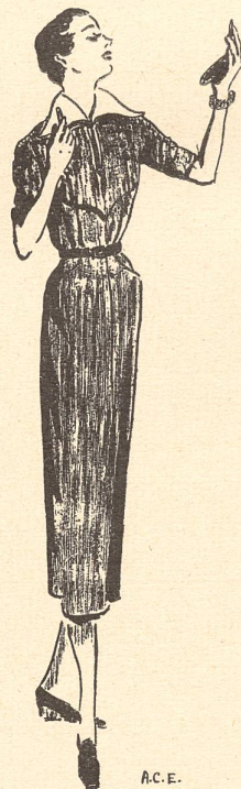
Élégante robe de flanelle de Marcus. Col de piqué blanc détachable, avec cravate noire.