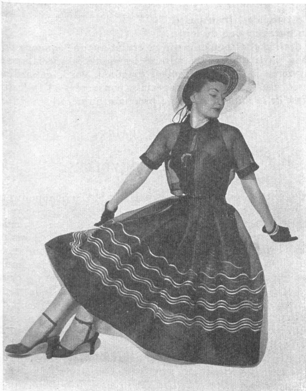
Robe d'après-midi de Aldrich en organdi suisse marine.

Les cotons fins suisses : batiste, voile, dotted Swiss, organdi, etc., ont été présentés sous forme de modèles d'été de trente-sept fabricants américains de confection.