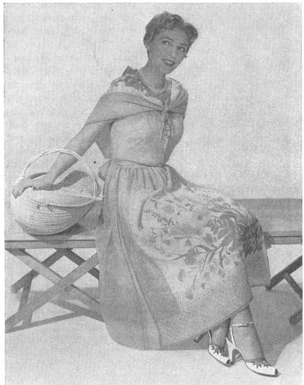
Robe de « L'Aiglon » en voile suisse infroissable.

Il s'agissait de montrer que les tissus de coton fins tels qu'ils sont fabriqués en Suisse, conviennent particulièrement bien aux modes et climats américains, pour toutes les occasions de la journée ou du soir, non seulement à cause de leur qualité intrinsèque et de leur fraîcheur au