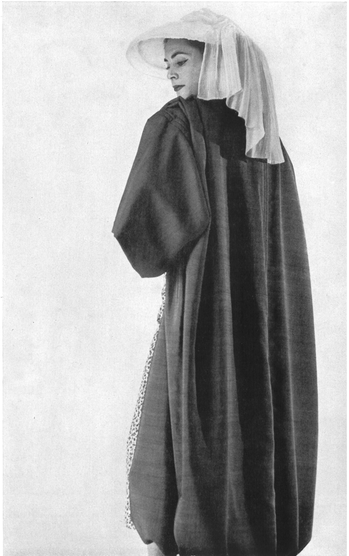
CHRISTIAN DIOR Honan couleur de Rudolf Brauchbar & Cie, Zurich.