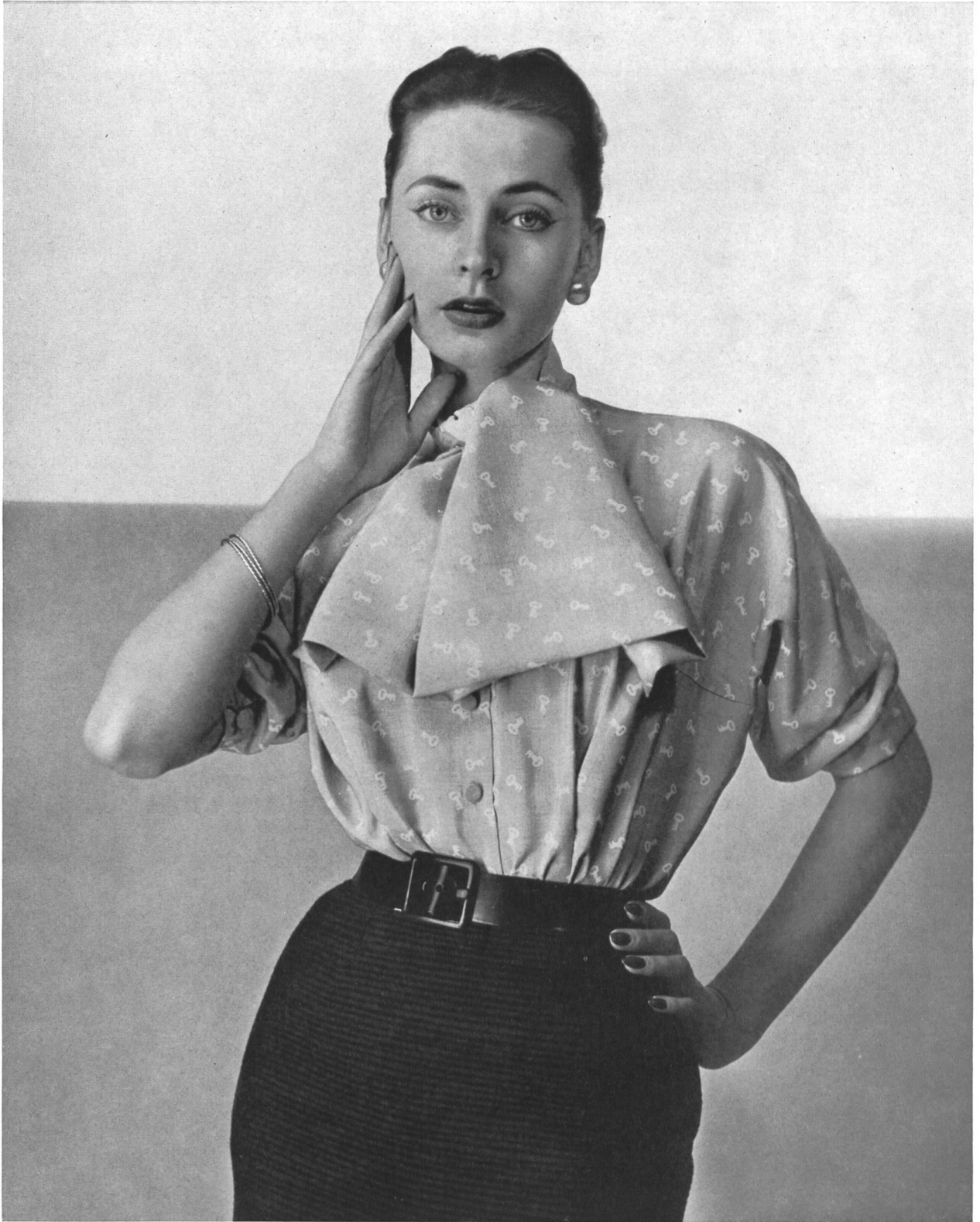
CHRISTIAN DIOR Honan imprimé de Rudolf Brauchbar & Cie, Zurich.