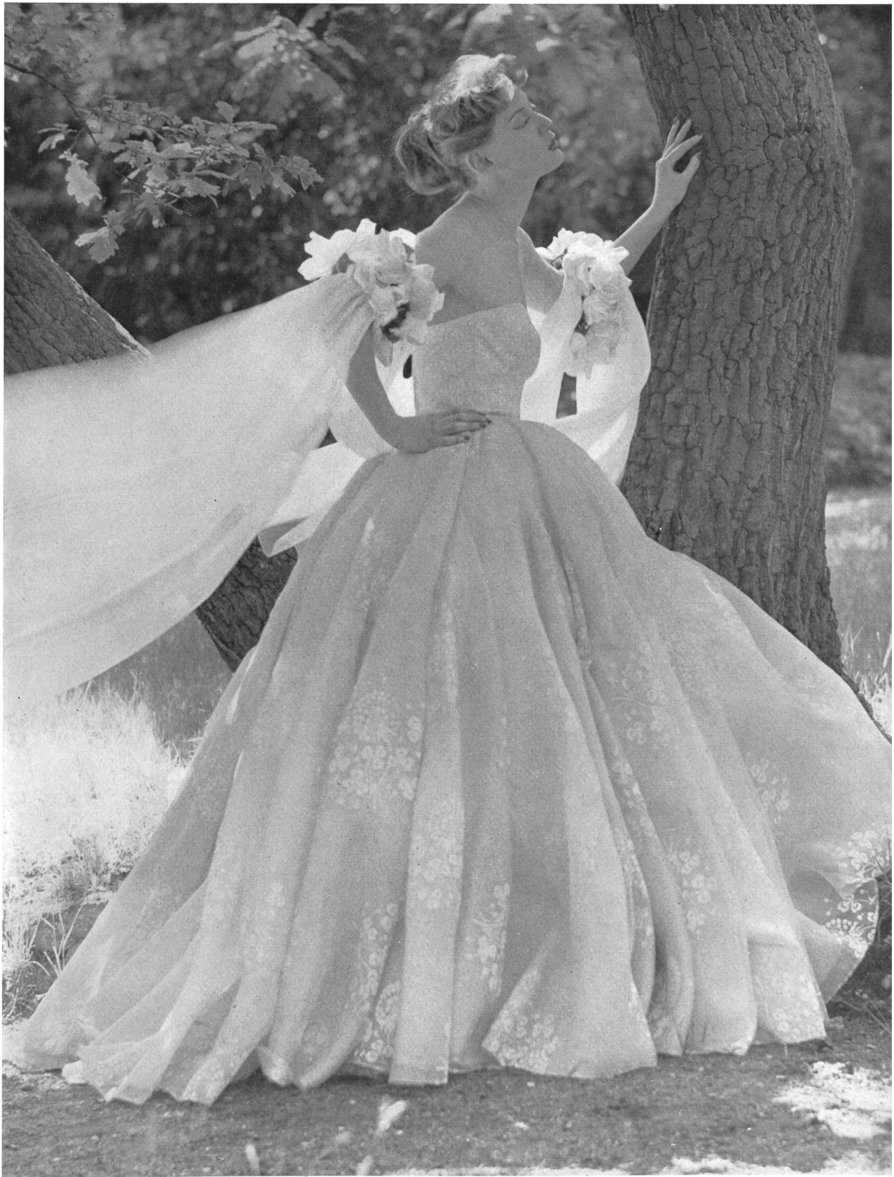
SERGE KOGAN Tissu « Flockprint » de Union S. A., St-Gall ; grossiste à Paris : Pierre Brivet S. à r. l.

Nous pensons intéresser nos lecteurs de l'hémisphère austral en reproduisant ici quelques modèles de collections de cette année précédant celle de l'hiver 1953-1954.