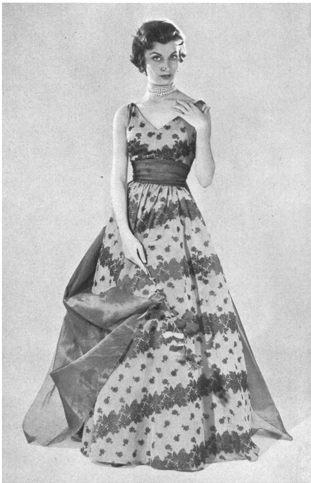
NICOL MODELLER A.-B., GÖTEBORG Organza broché de Rudolf Brauchbar & Cie., Zurich.

La Suisse est, pour la Suède, un important fournisseur de produits textiles et d'habillement. Comme les habitants de beaucoup d'autres contrées septentrionales, les Suédois, s'ils sont sensibles à l'élégance, apprécient aussi beaucoup la qualité; et cette qualité, ils savent qu'ils peuvent la trouver dans les produits suisses, que ce soient des vête-