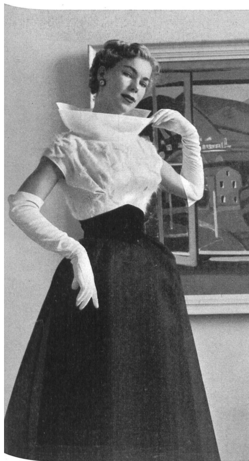
HENSEL & MORTENSEN, BERLIN Fil à fil Directoire knitterfrei von Heer & Co. A.-G., Thalwil.