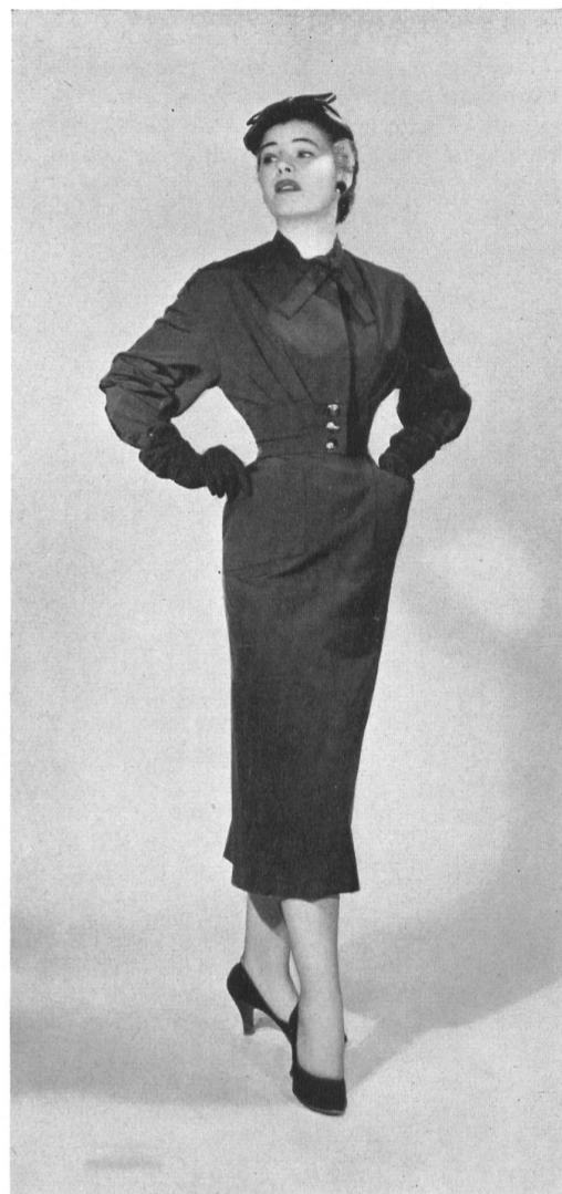
CHRISTIAN DIOR, NEW YORK

« Amadis » silk by L. Abraham & Cie, Soieries S. A., Zurich.