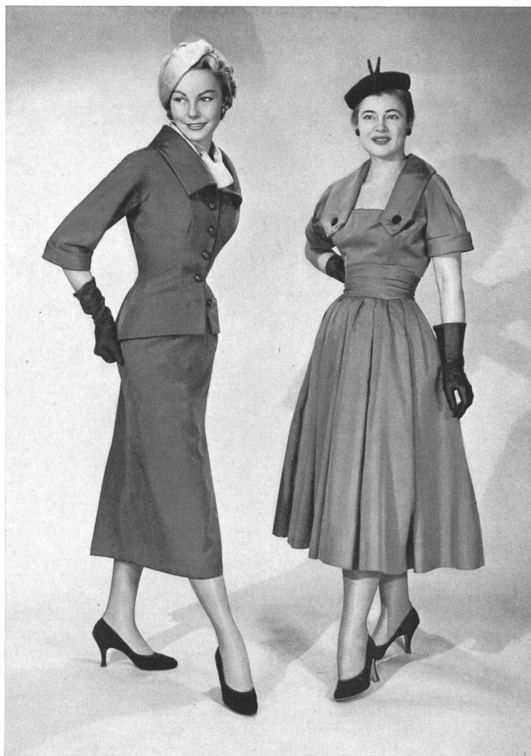
CHRISTIAN DIOR, NEW YORK

Les tissages américains et les fabriques de tissus de Suisse et d'autres pays d'Europe rivalisent d'ingéniosité