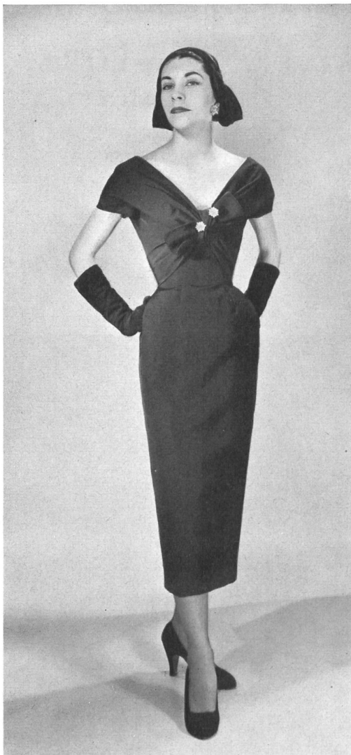
CHRISTIAN DIOR, NEW YORK

« Amadis » silk by L. Abraham & Cie, Soieries S. A., Zurich.