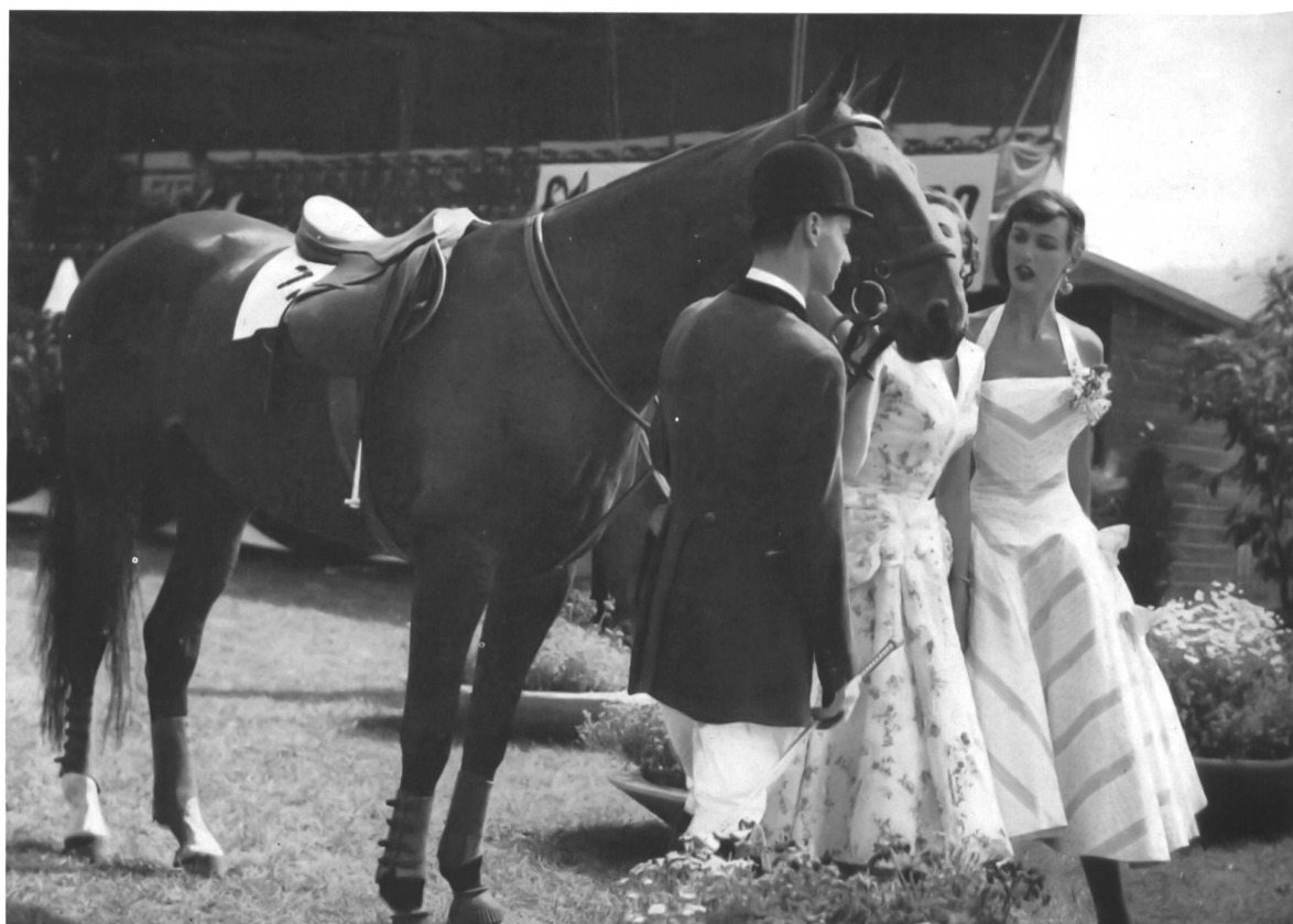
Beauté, jeunesse et cheval.

Le Musée des Beaux-Arts de Saint-Gall avait aussi mis sur pied, avec l'appui de collectionneurs privés et d'artistes, une exposition d'une très belle tenue, Le tableau dans l'habitation moderne que nous ne pouvons malheureusement pas analyser ici, faute de place. Il y eut aussi un bal avec défilé de mannequins et, pour les journalistes invités, des excursions dans de pittoresques régions de Suisse orientale, une réception du Conseil d'Etat, une visite commentée de la bibliothèque conventuelle et des