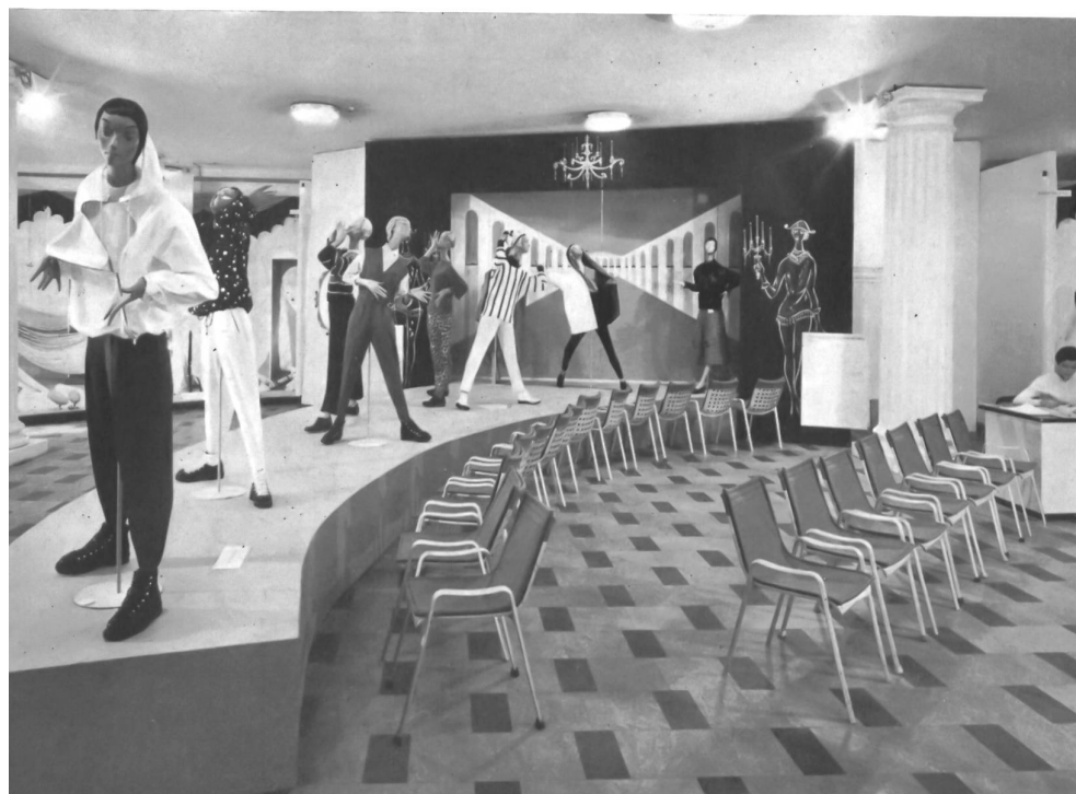
Vêtements de sport.