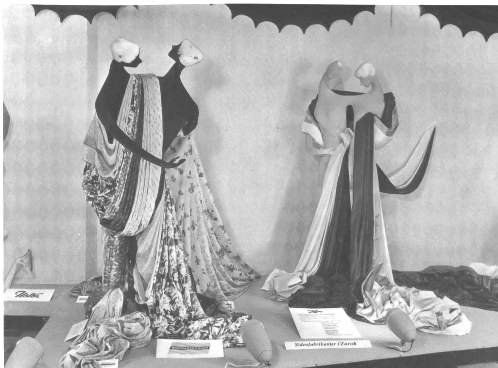
Un aspect de l'exposition de l'industrie des soieries.