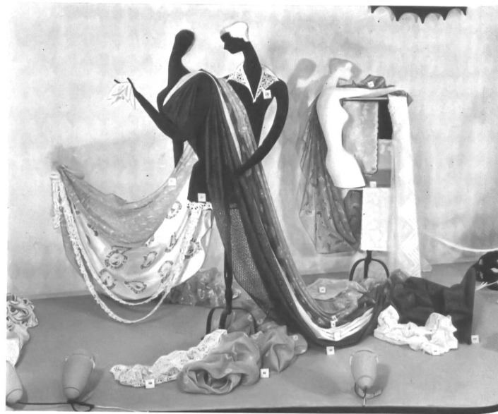
Broderies et cotons fins de Saint-Gall.

La « Semaine Suisse » de Stockholm a été un succès. Espérons qu'elle contribuera à développer durablement les relations commerciales suédo-suisse, comme le vœu en a été exprimé.