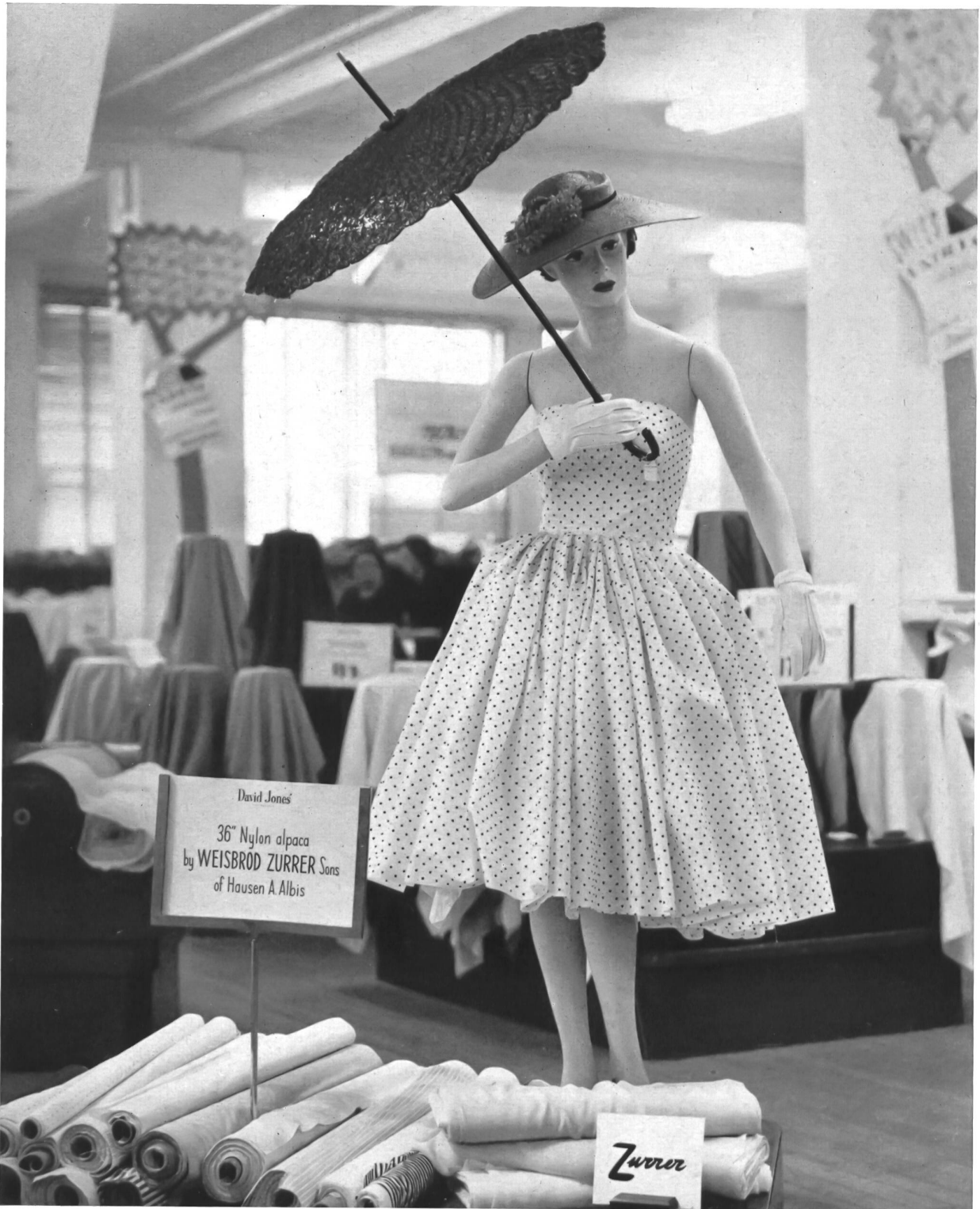
A Swiss fabrics display at David Jones', Sydney

Printed washable orlon dress, fabric by Weisbrod-Zurrer Sons, Hausen a. A. (Switzerland)