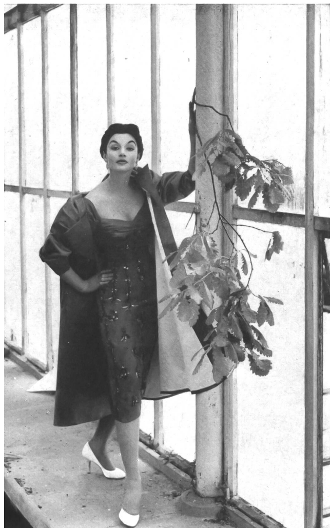
L. Abraham & Co., Silks Ltd., Zurich Pure silk Duchesse satin.