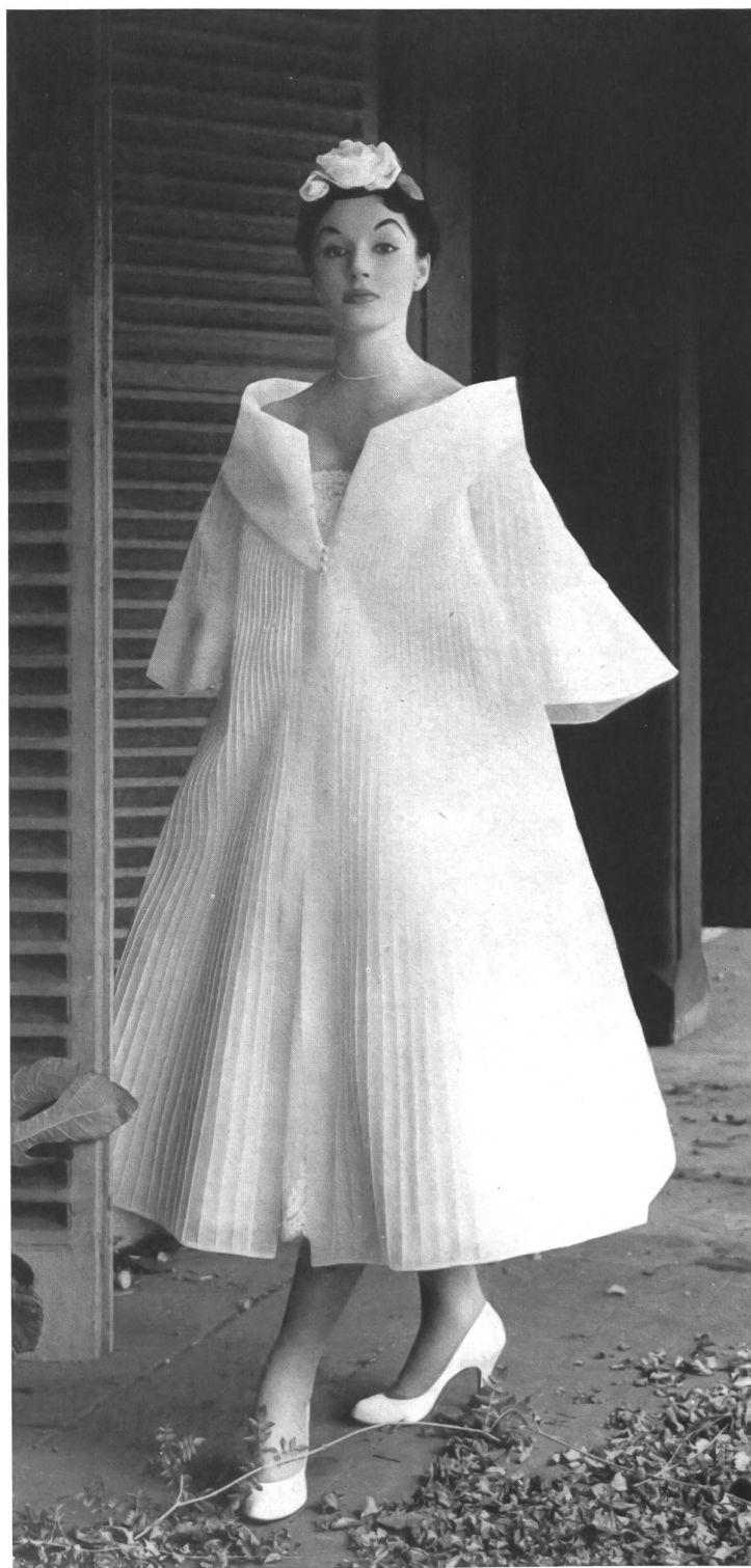
L. Abraham & Co., Silks Ltd., Zurich Basra.