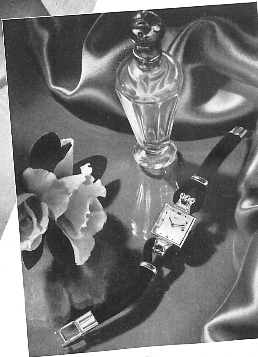
Manufacture des montres DOXA S. A., Le Locle S.T. Studio