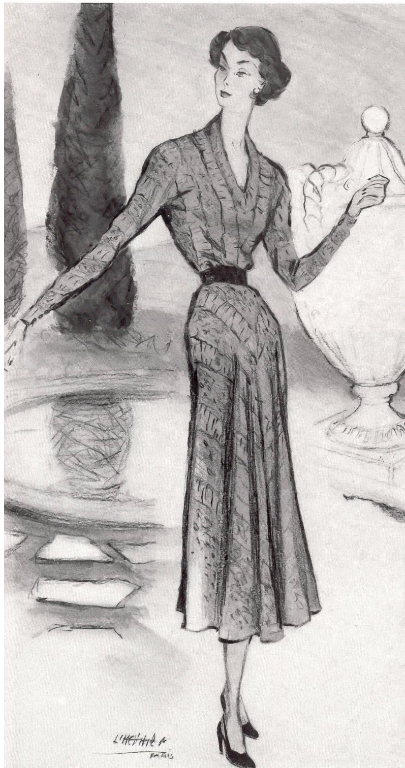
Société de la Viscose Suisse S. A., Emmenbrücke