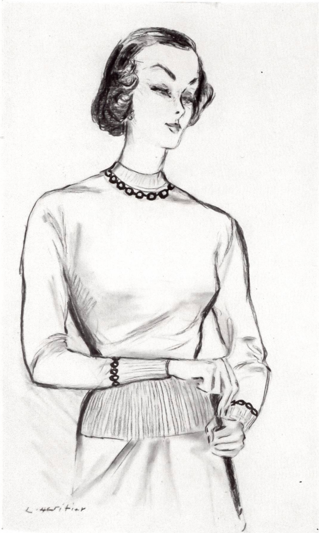
ANNY BLATT Union S. A., St-Gall PIERRE BRIVET FILS, PARIS