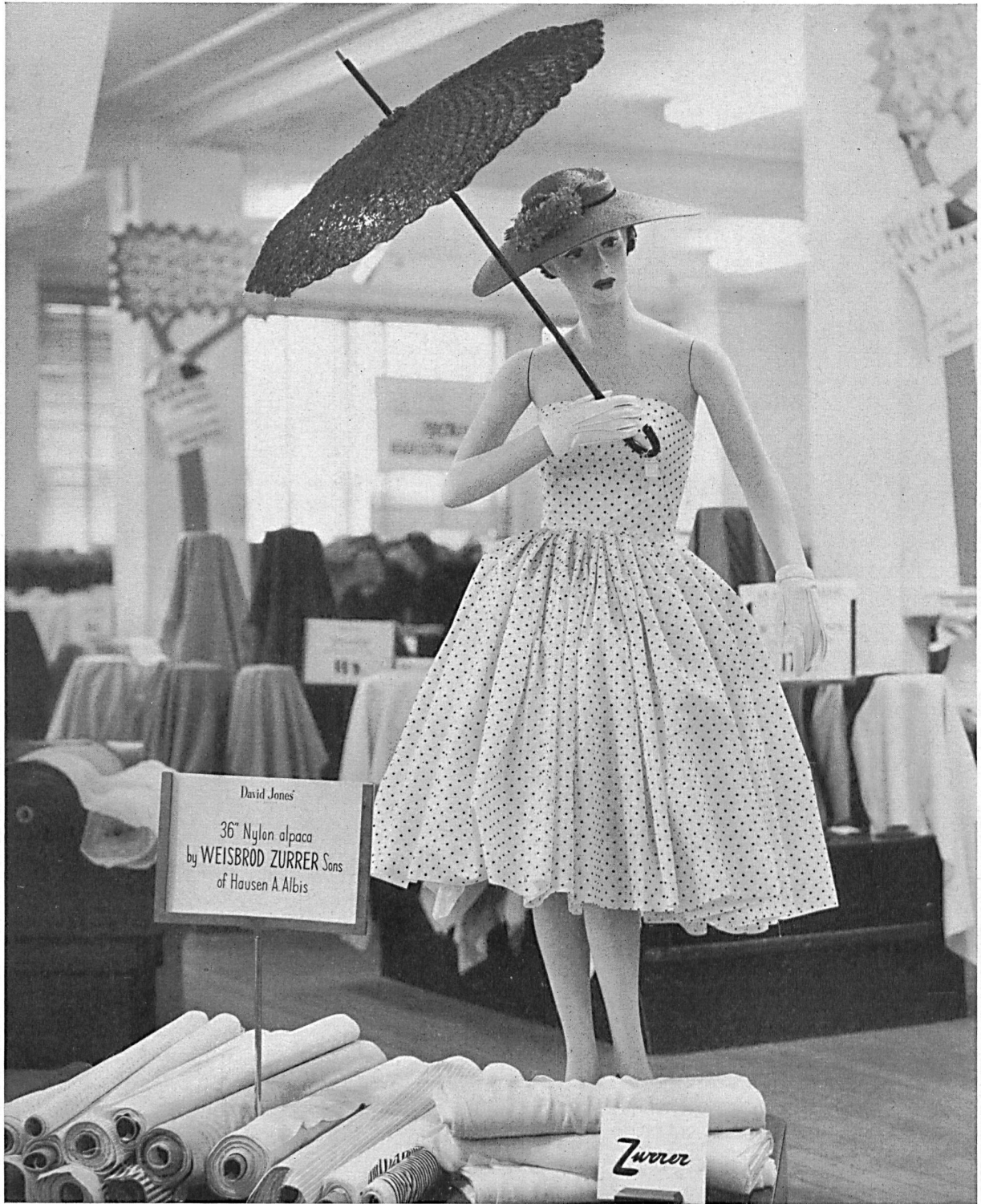
A Swiss fabrics display at David Jones', Sydney

Printed washable orlon dress, fabric by Weisbrod-Zurrer Sons, Hausen a. A. (Switzerland)