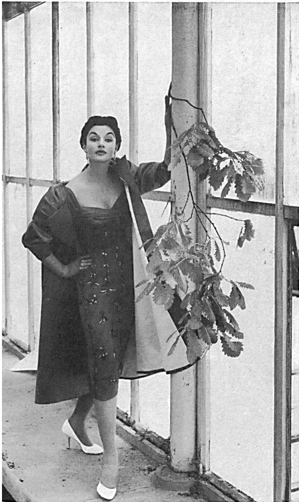
L. Abraham & Co., Silks Ltd., Zurich Pure silk Duchesse satin.