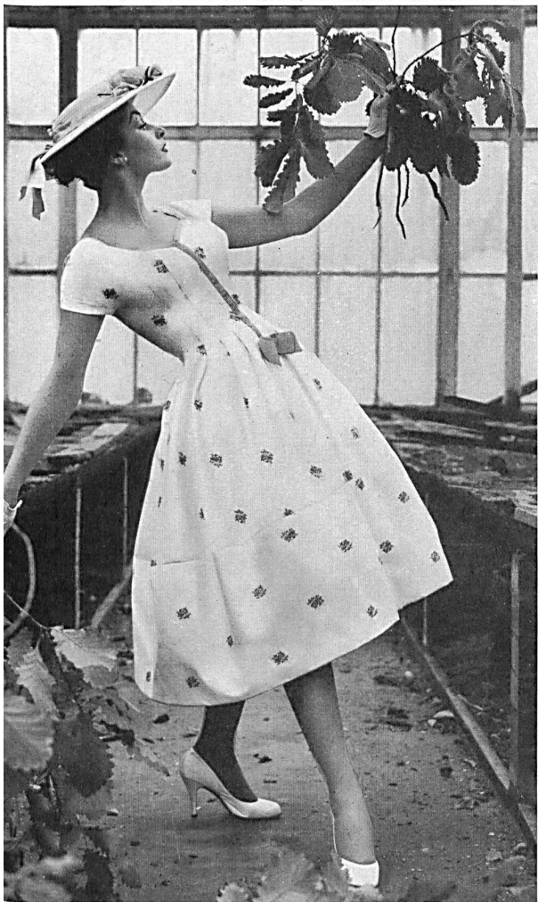
L. Abraham & Co., Silks Ltd., Zurich Embroidered cotton fabric.