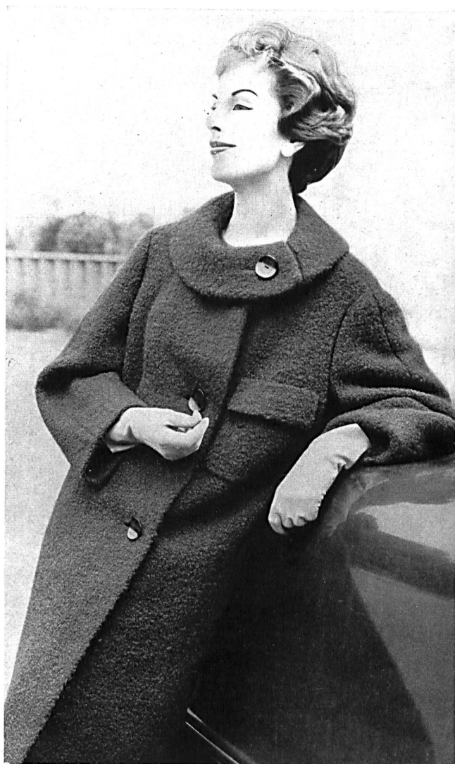
Wintermantel aus Jacqmar Bouclé

STRENGELBACH Strick- und Wirkwarenfabrik Tel. (062) 8 10 53