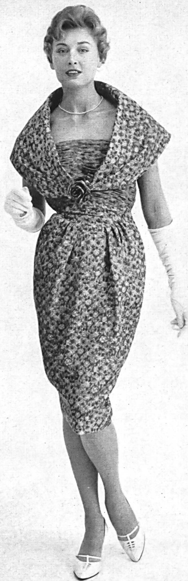
ROBT. SCHWARZENBACH & CO., THALWIL Imprimé pure soie / pure silk printed fabric Modèle Continental Modes, Sydney