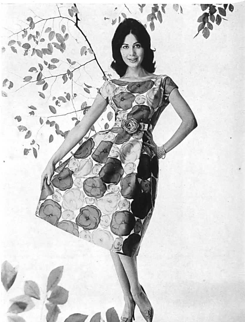
HEER & CIE S. A., THALWIL « Satin Sauvage », coton imprimé Grossiste à Paris: Robert Burg & Cie Modèle Géo Boutet, Paris