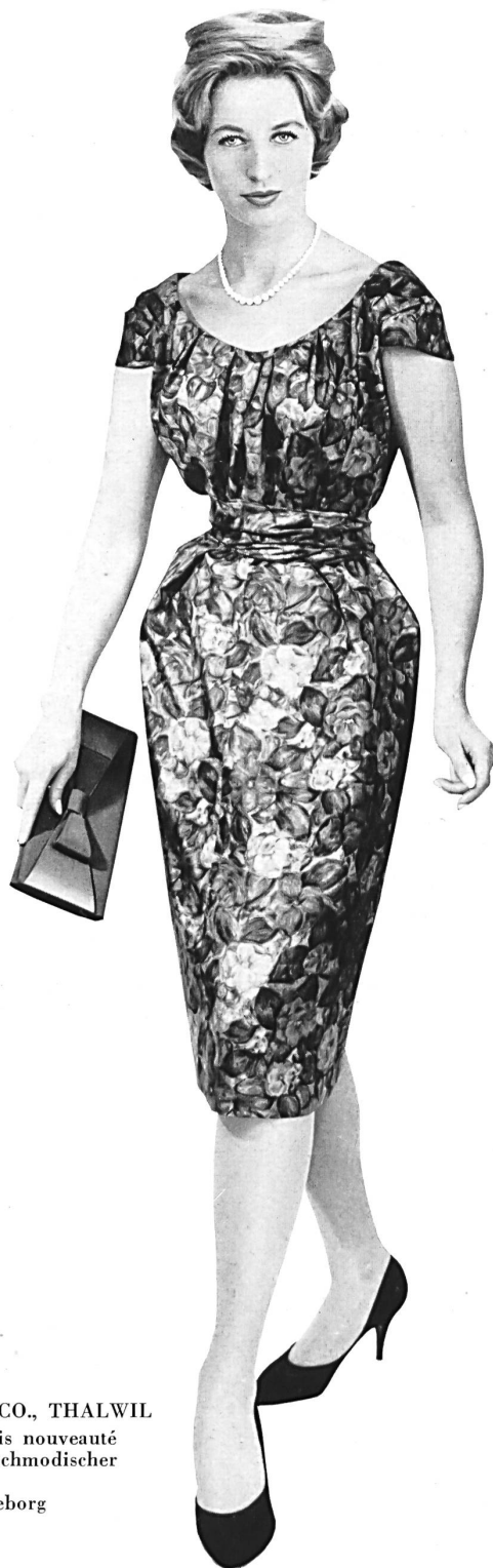
ROBT. SCHWARZENBACH & CO., THALWIL Pure soie, imprimée main, coloris nouveauté Handbedruckte reine Seide in hochmodischer Colorierung Modèle A/B Lena-Modeller, Göteborg