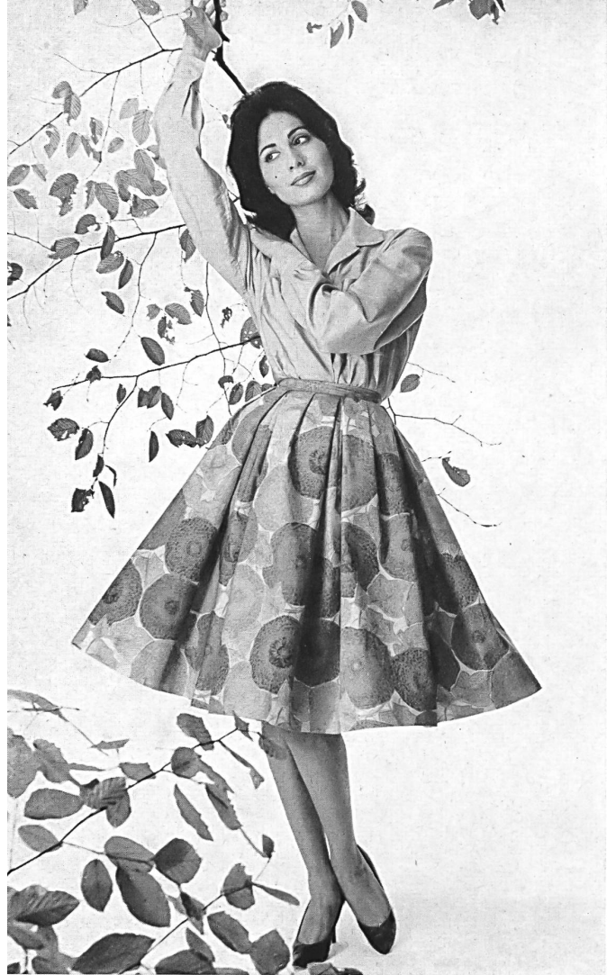
HEER & CIE S. A., THALWIL « Satin Flirt », coton imprimé Grossiste à Paris: Robert Burg & Cie Modèle Péroche, Paris