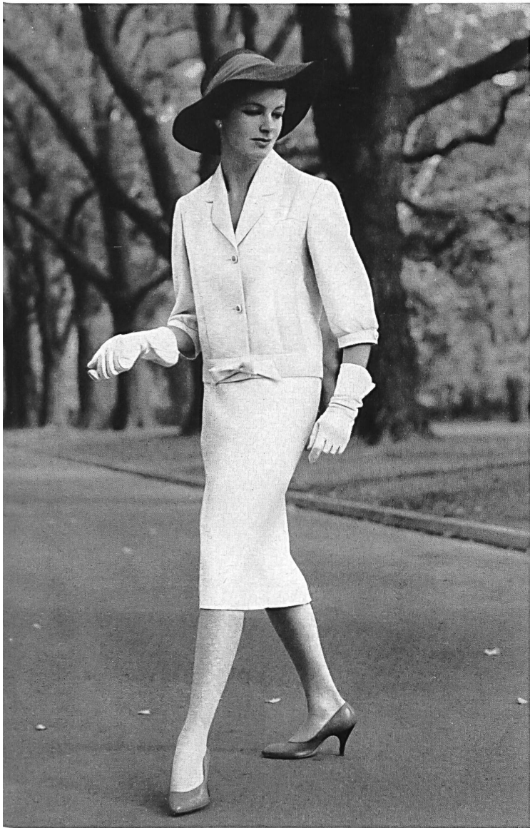
« ZURRER » WEISBROD-ZURRER SÖHNE, HAUSEN a.A. « Nanking » pure fibranne / pure spun rayon Modèle Raymon Manufacturing Co., Melbourne