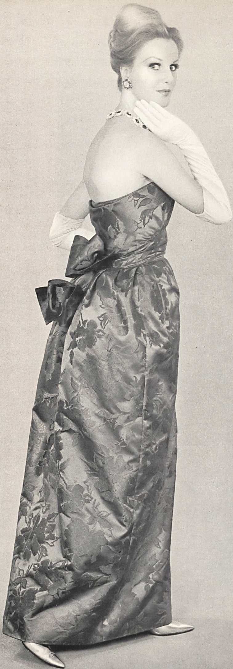
LANVIN CASTILLO Soie brochée « Damar » de L. Abraham & Cie, Soieries S.A., Zurich