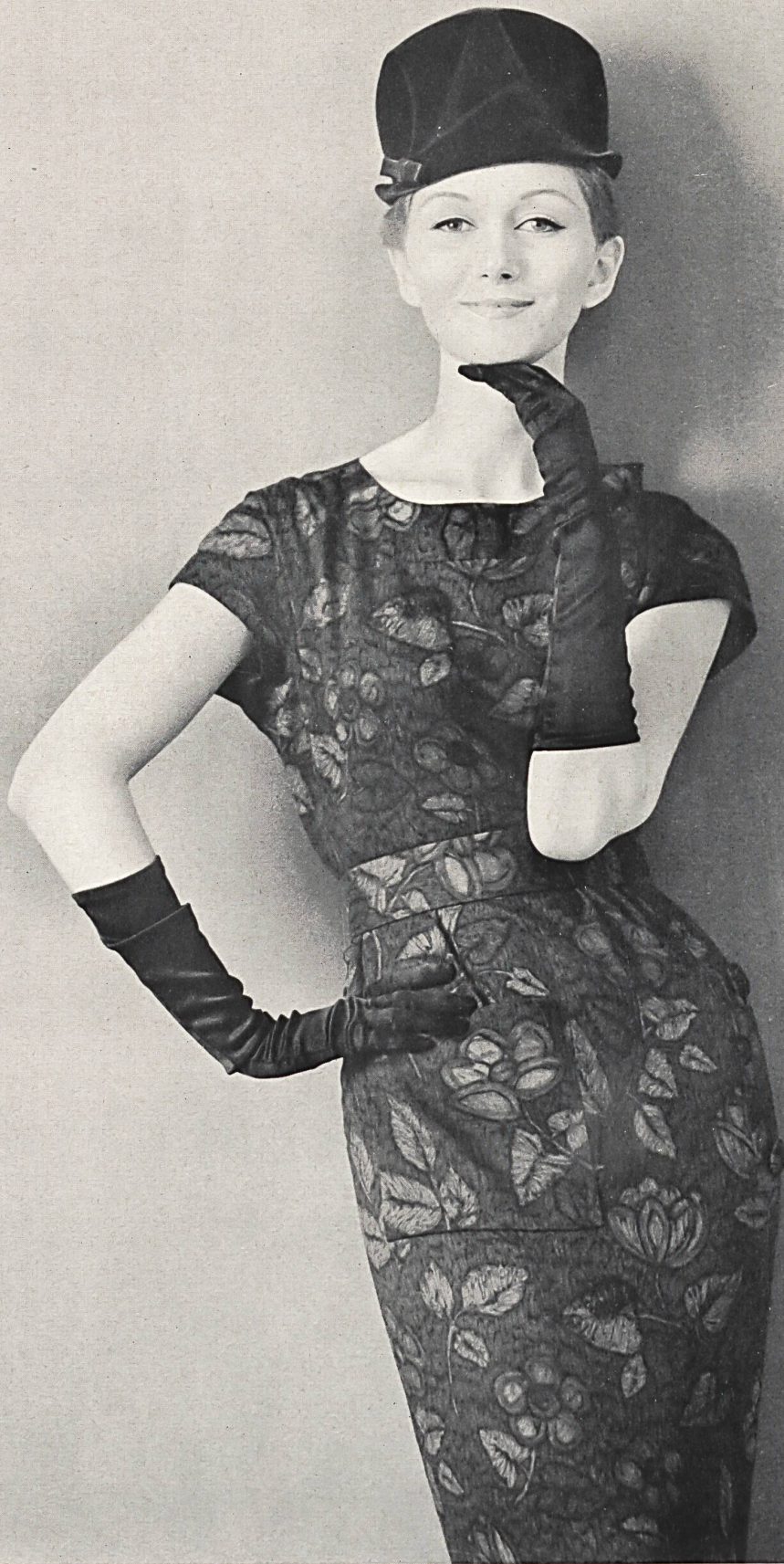
PIERRE CARDIN « Lavinia » de Reichenbach & Co., Saint-Gall Distribué par Montex, Paris