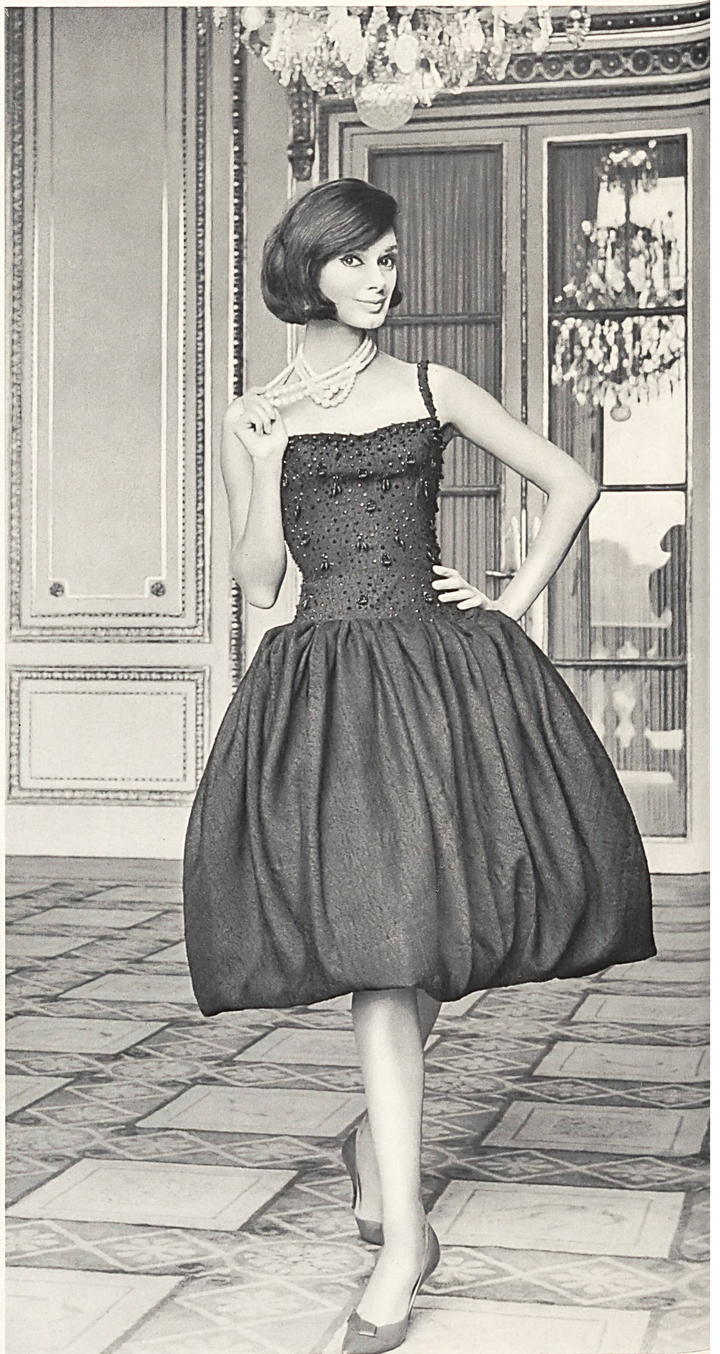
JACQUES HEIM Tissu « Kolibri » (soie naturelle) de Heer & Cie S.A., Thalwil Grossiste à Paris : Robert Burg & Cie