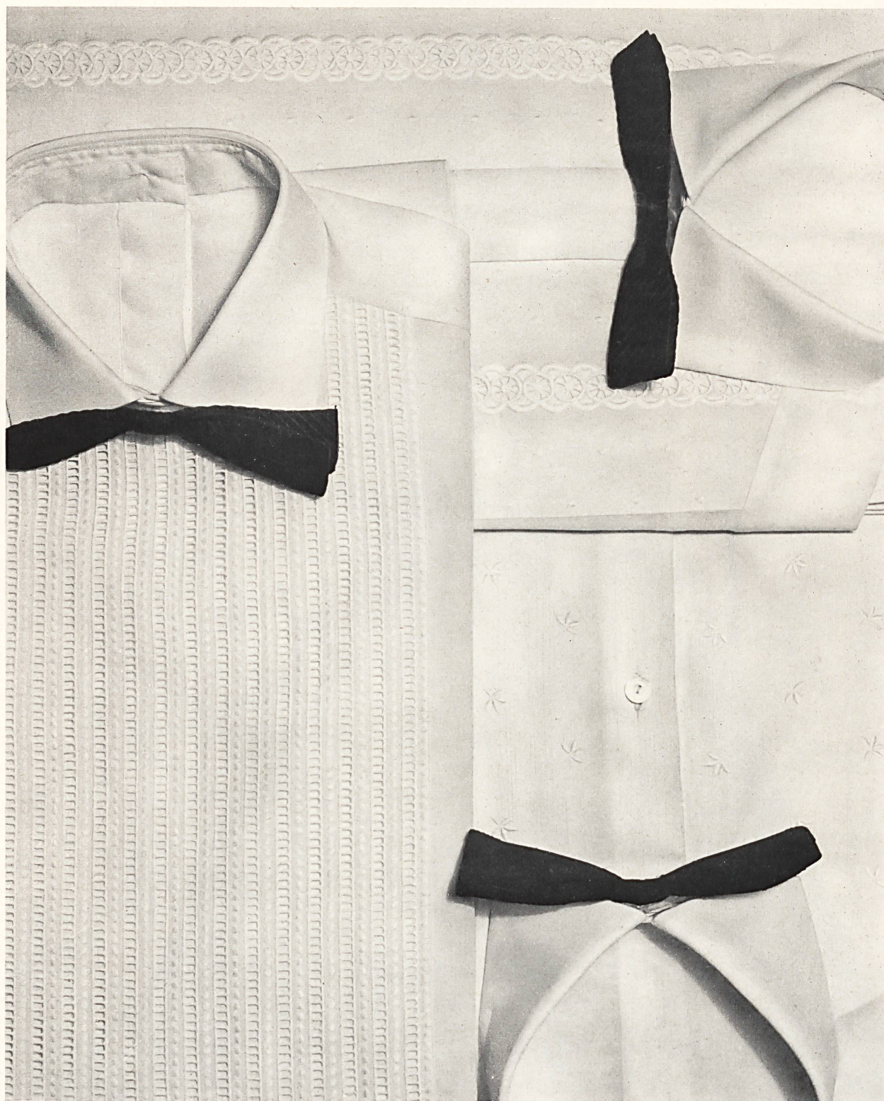
PIERRE CARDIN Batiste Minicare et Shantunella Minicare brodés de Forster Willi & Co, Saint-Gall