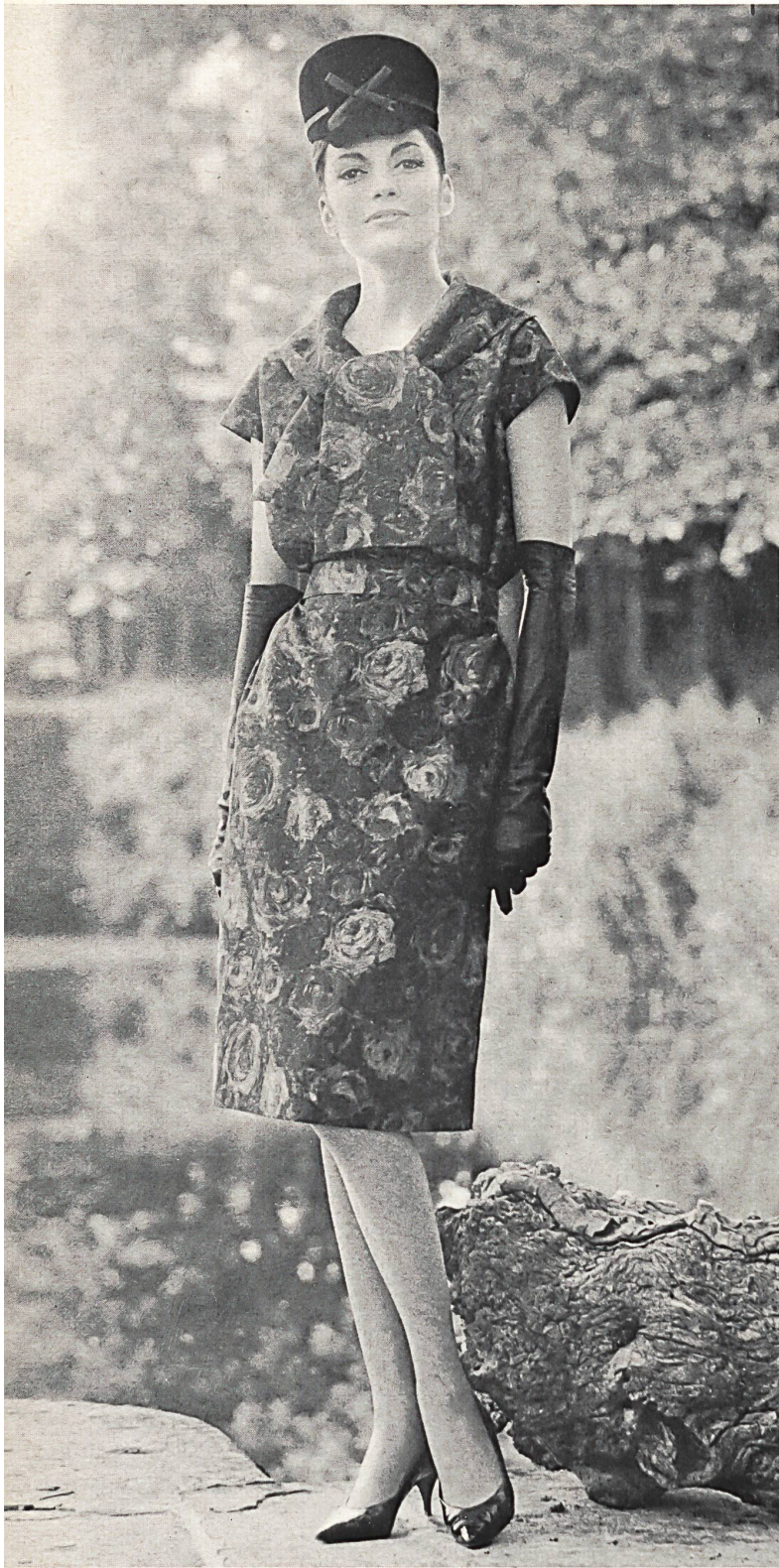
PIERRE CARDIN Soielaine « Miranda » de Reichenbach & Co., Saint-Gall Distribué par Montex, Paris