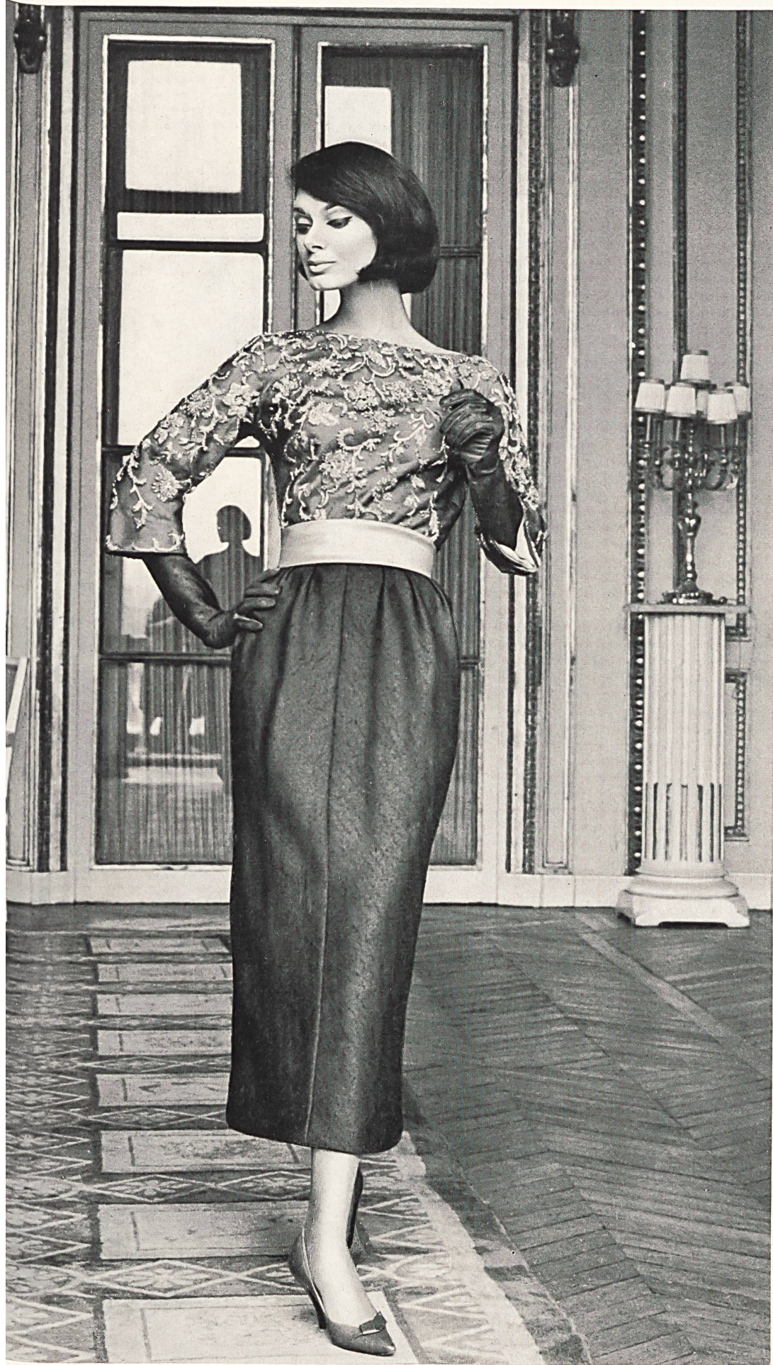
JACQUES HEIM Tissu «Kolibri» (soie naturelle) de Heer & Cie S.A., Thalwil Grossiste à Paris : Robert Burg & Cie