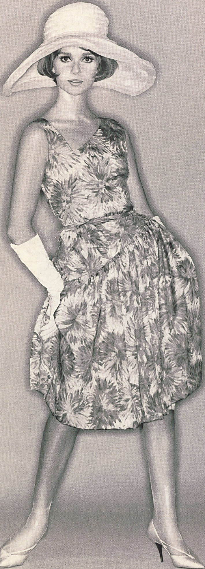
MAGGY ROUFF Tissu pure soie « Manina » de Robt. Schwarzenbach & Co., Thalwil