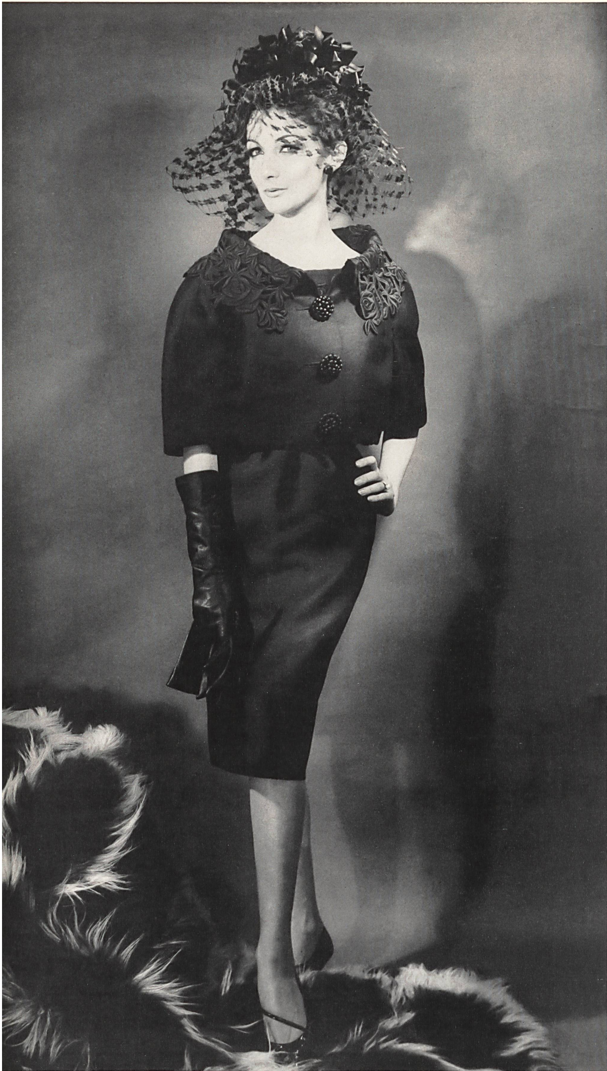
BERNARD SAGARDOY Broderie noire découpée de Union S. A., Saint-Gall Grossiste à Paris: Robert Burg & Cie