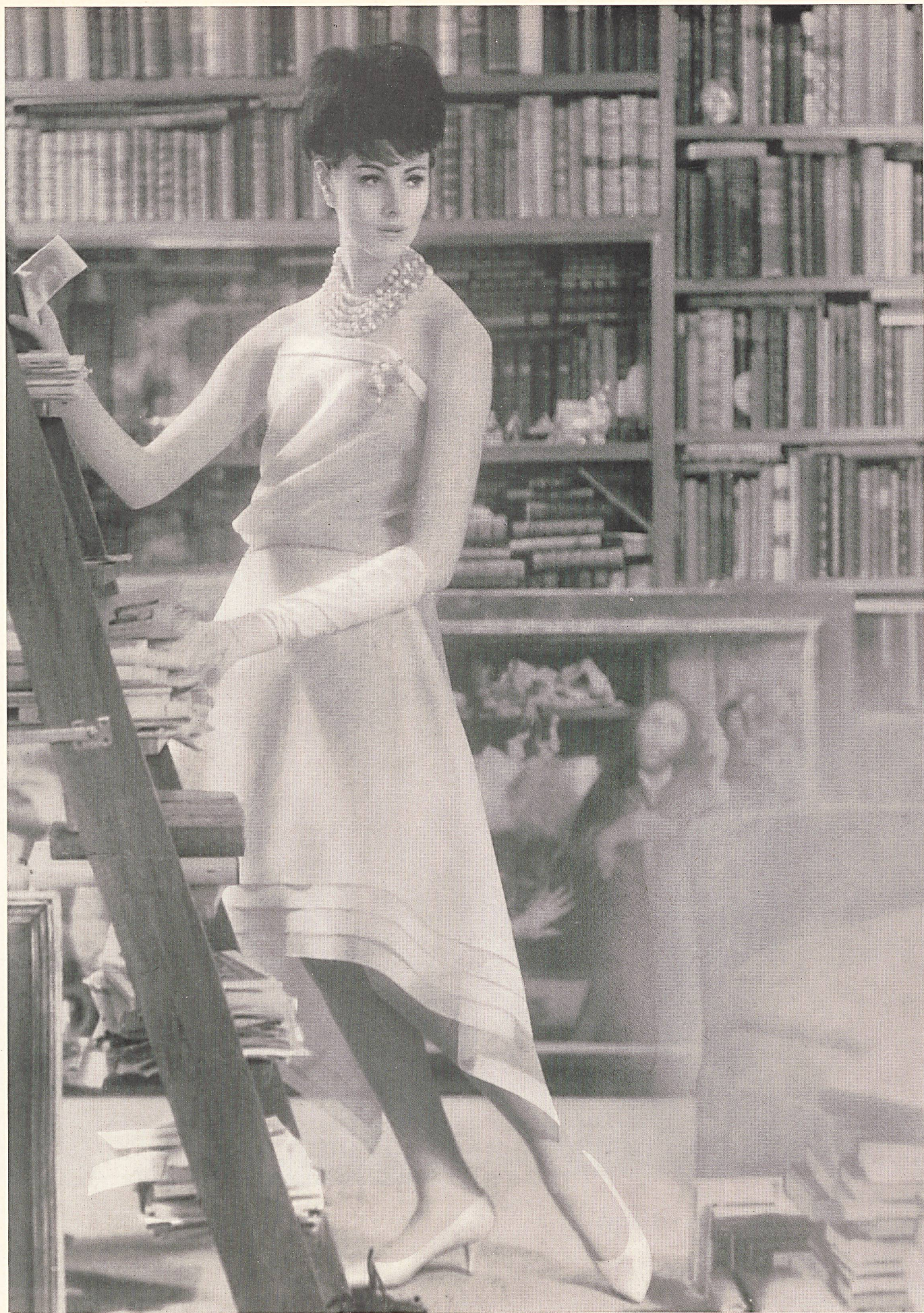
CHRISTIAN DIOR « Basra » de L. Abraham & Cie, Soieries S. A., Zurich