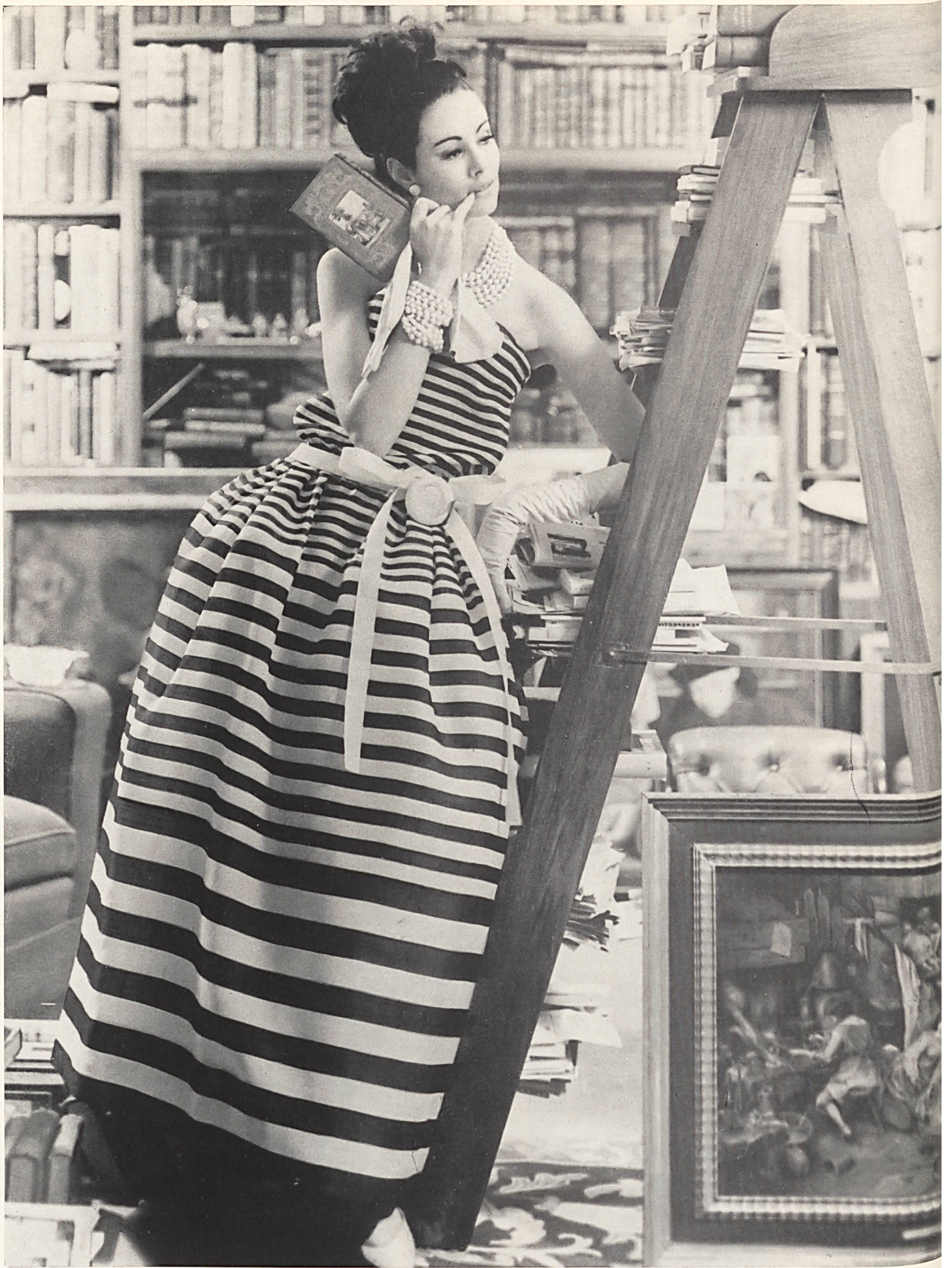
CHRISTIAN DIOR «Gazar» rayé de L. Abraham & Cie, Soieries S. A., Zurich