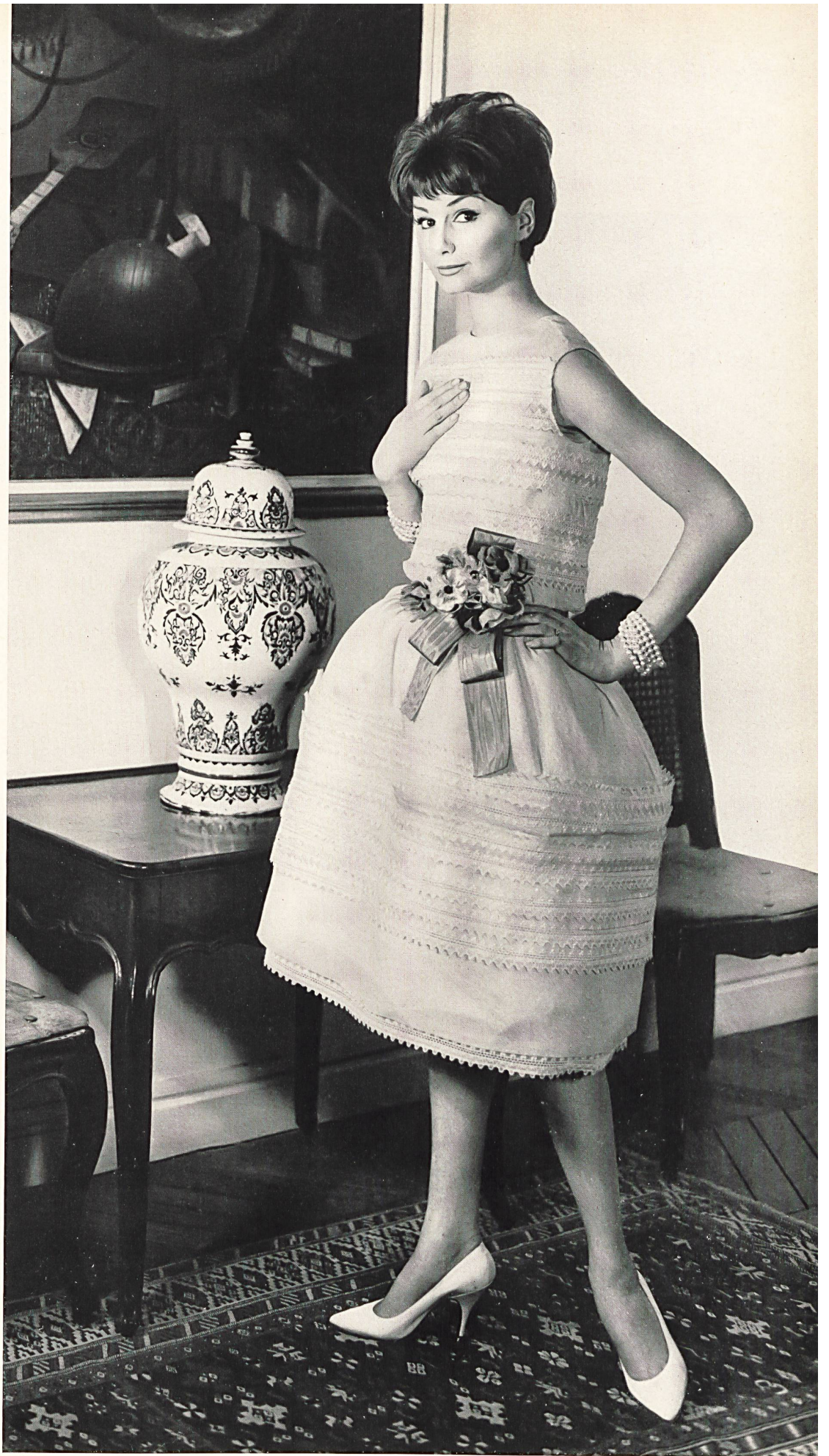
CHRISTIAN DIOR Organdi brod  de Forster Willi & Co., Saint-Gall