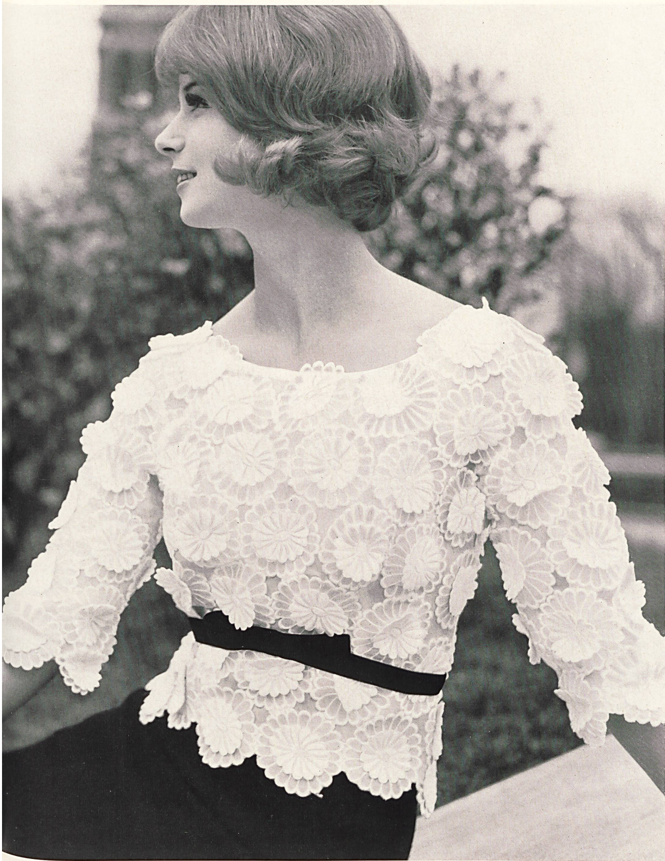
JACQUES HEIM Broderie «Nelo» appliquée sur organdi de J. G. Nef & Co. S. A., Hérisau