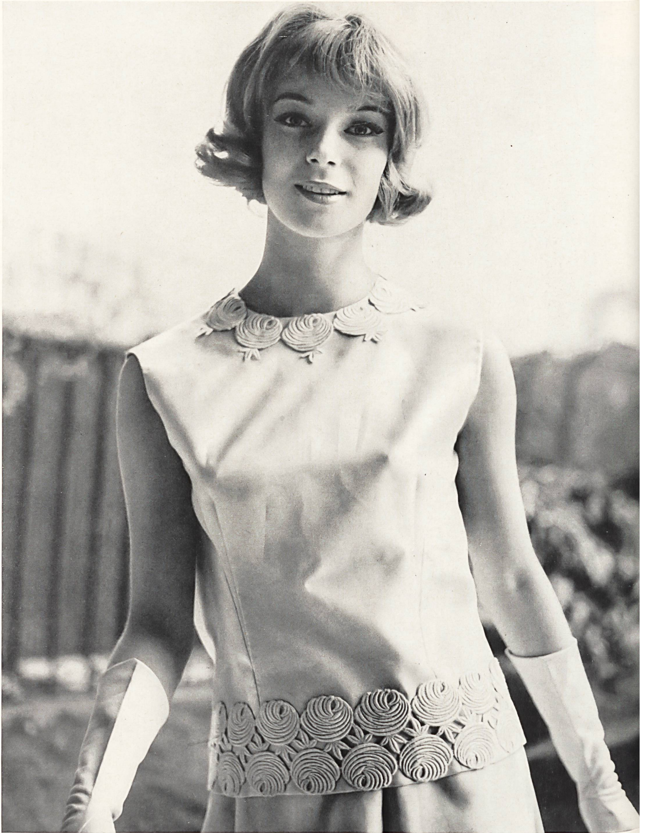
BERNARD SAGARDOY Bande de guipure de Jacob Rohner S. A., Rebstein