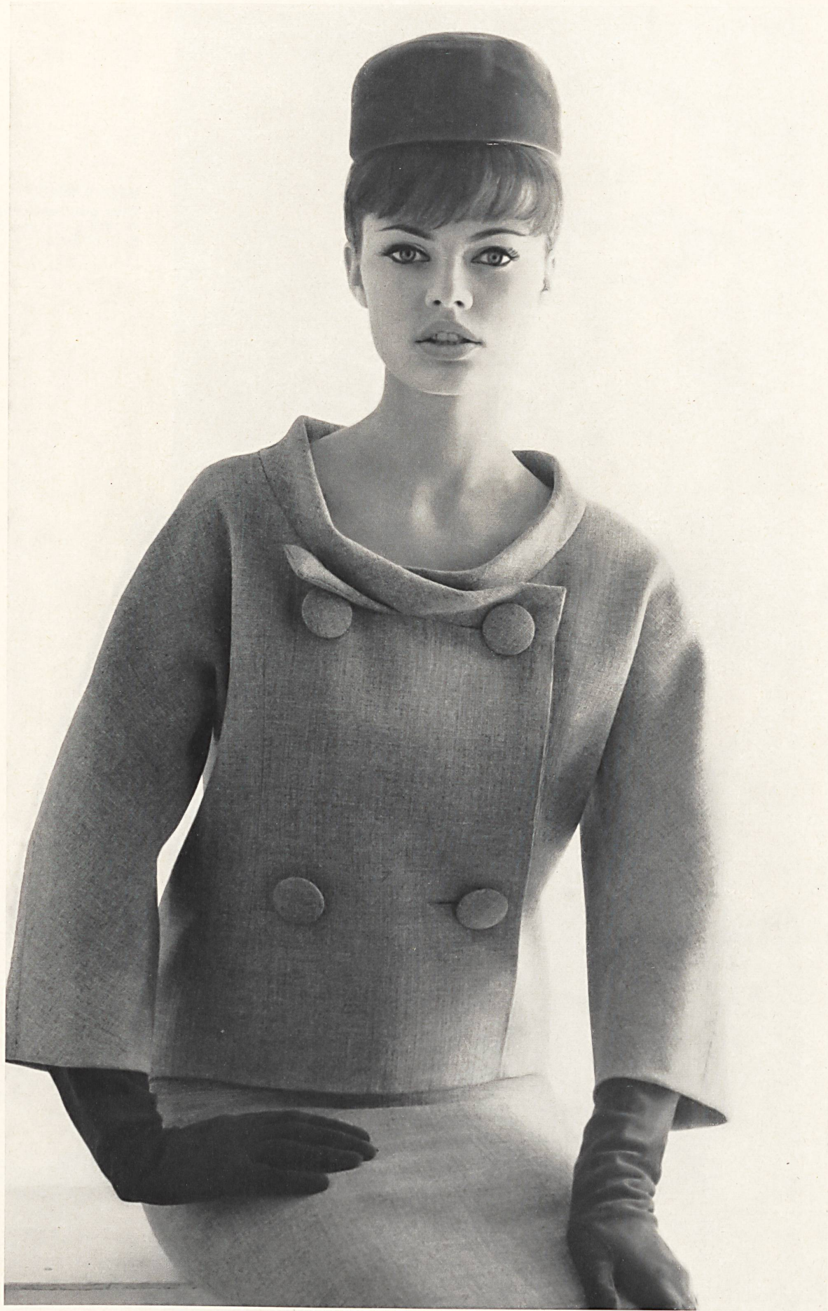
PIERRE CARDIN « Shetty fashion fil » des Tissages de soieries Naef Frères S. A., Zurich