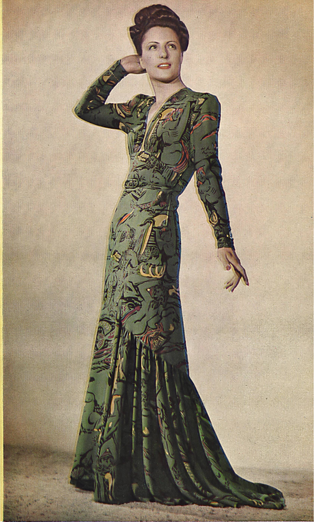
« La chevauchée de Poséidon » : Paul Daunay.

A pure silk fabric by : Tejido pura seda, de : Stehli & Co., Zurich.