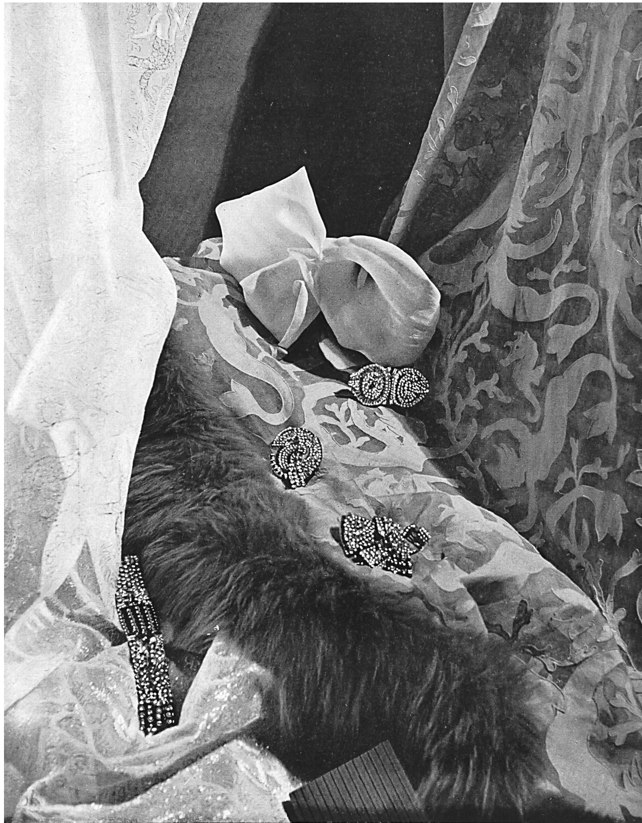
Jewels by : Joyas de : E. Gubelin, Lucerne.

Joyas... remate del vestido ; adorno luminoso. Semejantes a los reflejos del sol en las aguas, echan los resplandores de sus piedras magníficas en ricos poemas de oro y ametistas, de diamantes y rubíes, despeñándose en pesadas pulseras, o cuajándose en el estuche de la sortija, del broche.