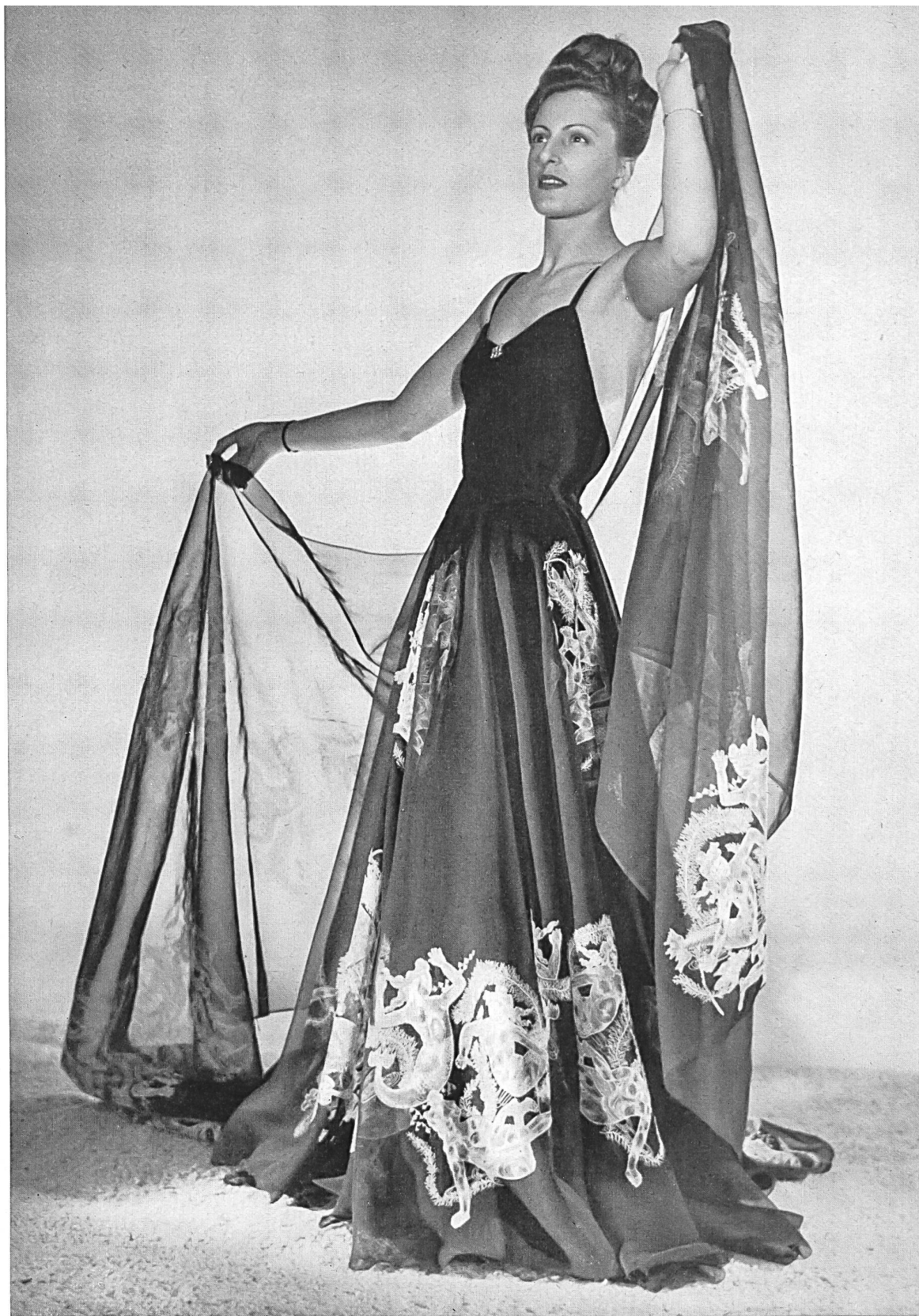
« Calypso » : Paul Daunay. Black silk organza embroidered with delicate motifs in white : Organza de seda negra, bordada de motivos blancos muy fina- mente hechos : Walter Schrank & Co., St. Gall.

« ...Sin cesar, con letanías de suavidad amorosa, Calipso quiere adormecer en él el recuerdo de su Itaca... »