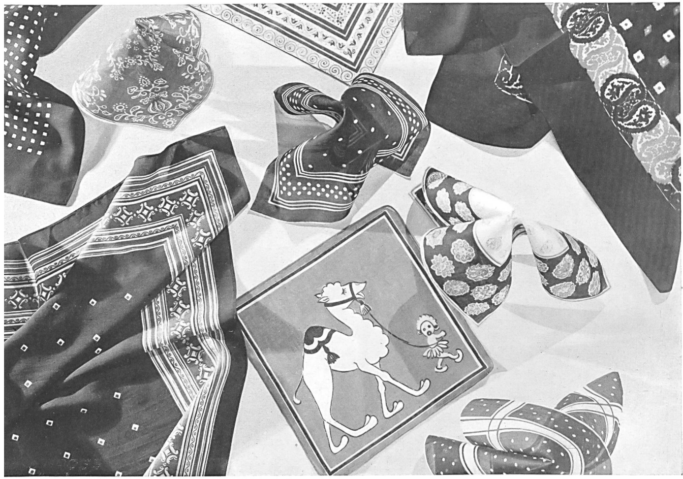
J. Kreier-Baenziger's Erben. St. Gall.

Fichus, printed handkerchiefs, children's handkerchiefs in cotton lawn and staple fibre.