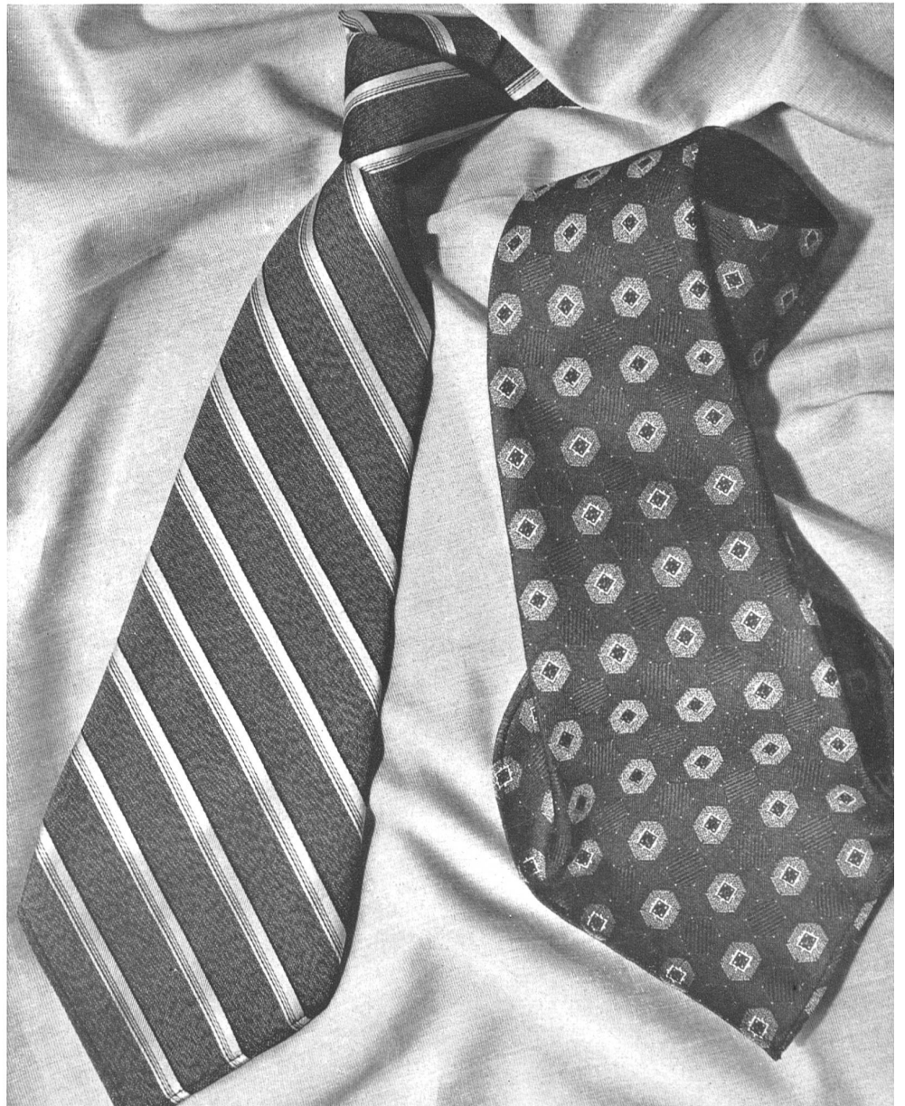
E. Vonwiller, Zurich.