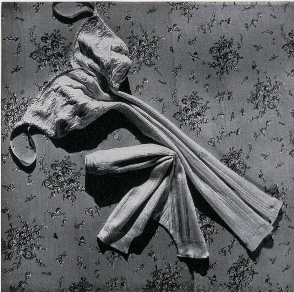
S. A. ci-devant W. Achtnich & Cie, Winterthour. Juego interior de fantasía «SAWACO», seda pura; hechura sostén; pantalón reforzado. S. T. Studio.