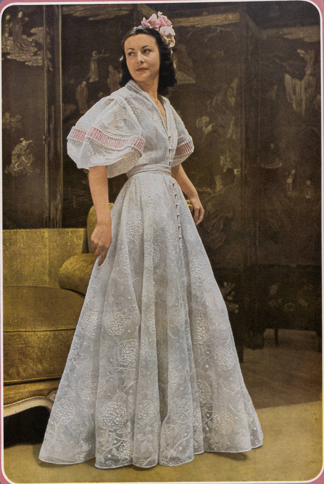
BRUYÈRE Reichenbach & Cie, St-Gall