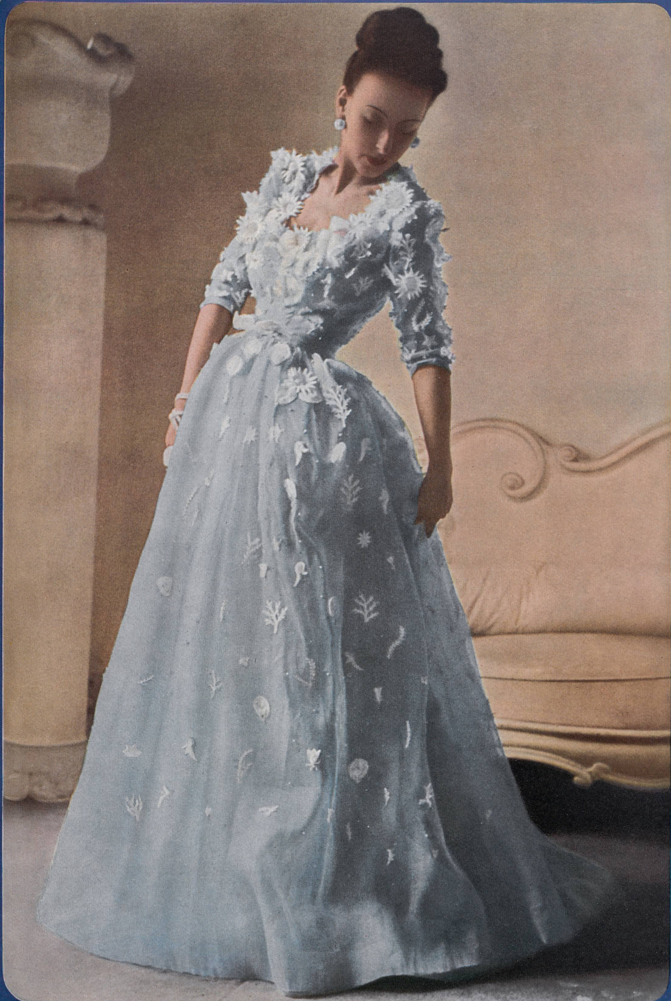
BALENCIAGA Aug. Giger & Cie, St-Gall