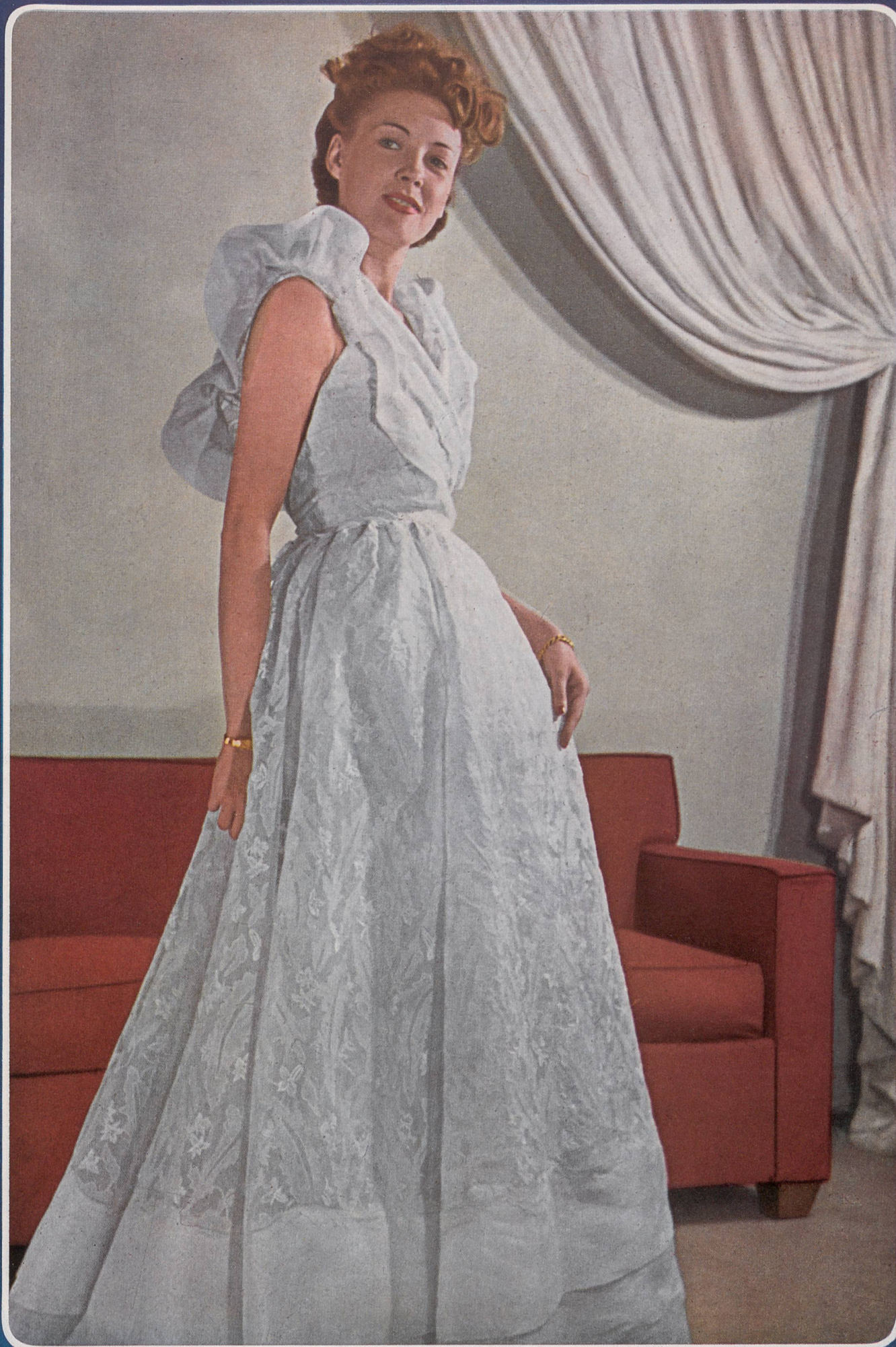
LUCIEN LELONG Union S.A., St-Gall