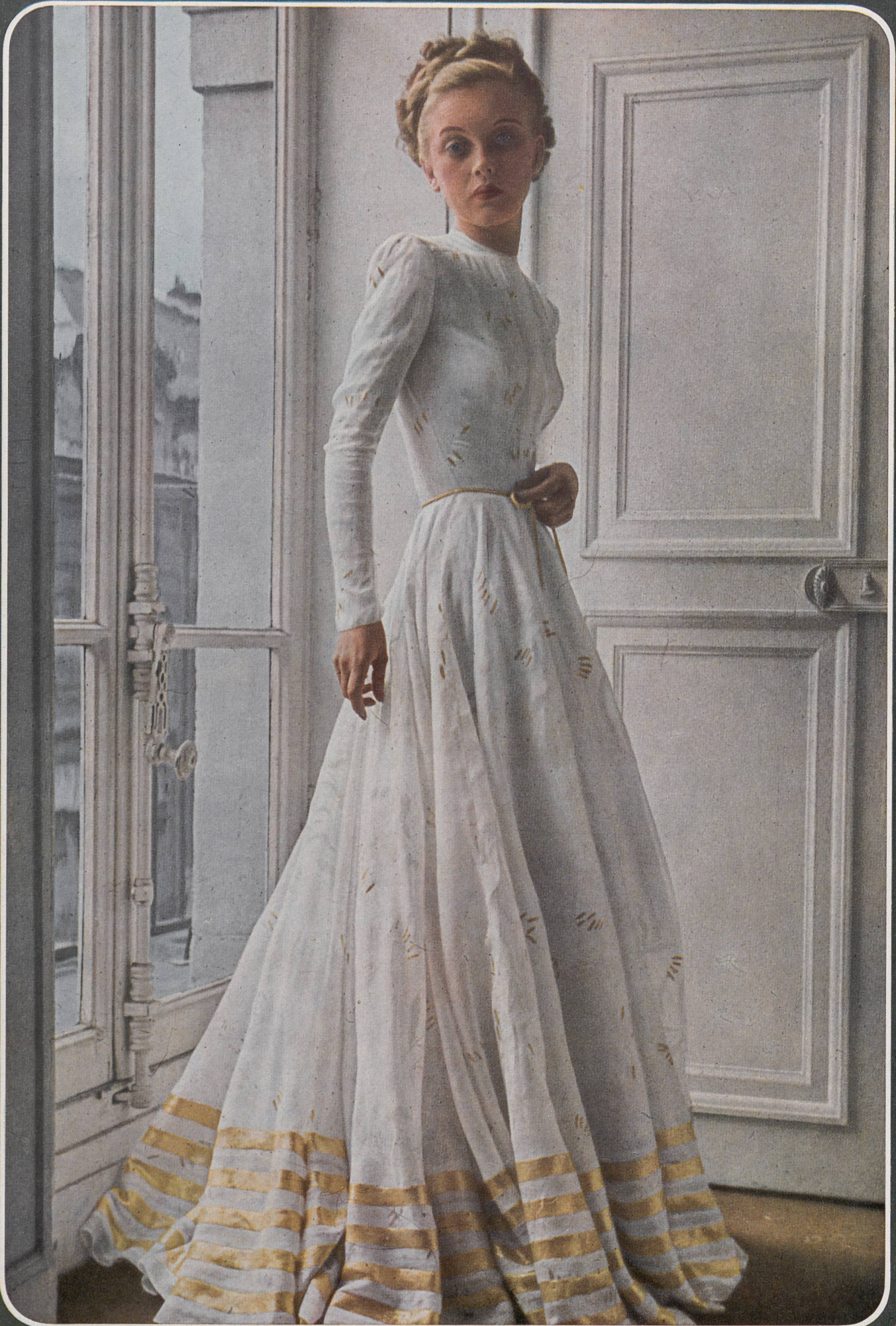
GRÈS Mettler et Cie S.A., St-Gall