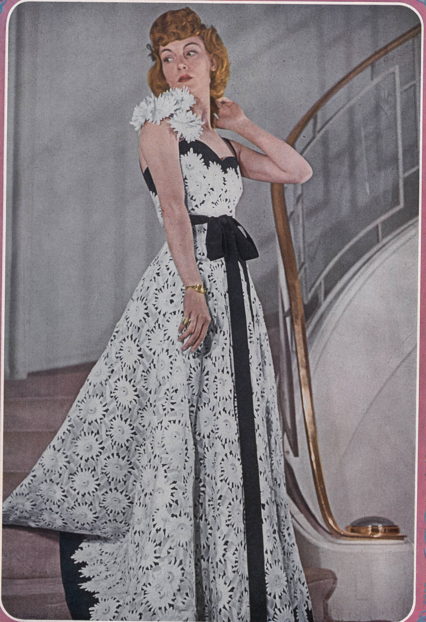
PAQUIN Union S.A., St-Gall