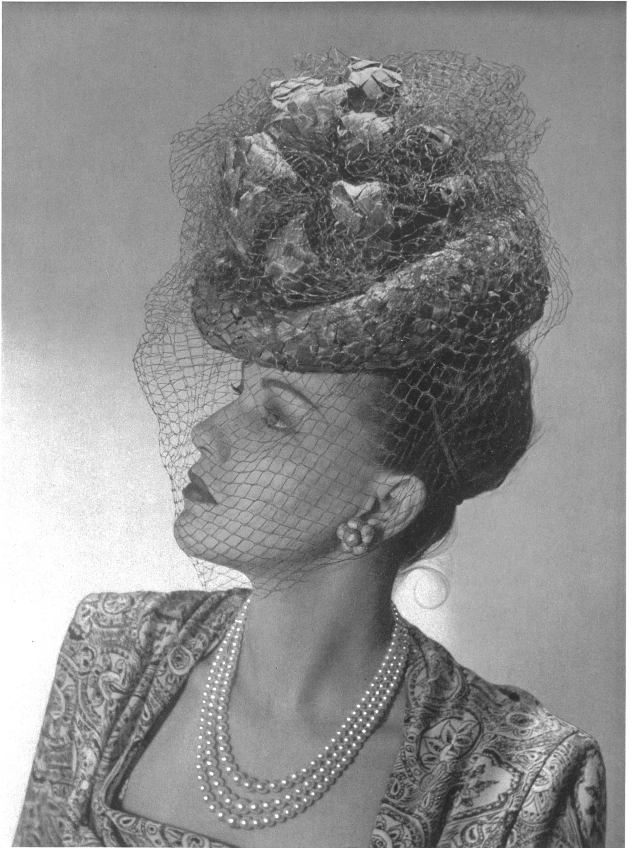
M. Bruggisser & Cie S. A., Wohlen Trenza de paja « YOWA » Création: J. & R. Polla, Zurich