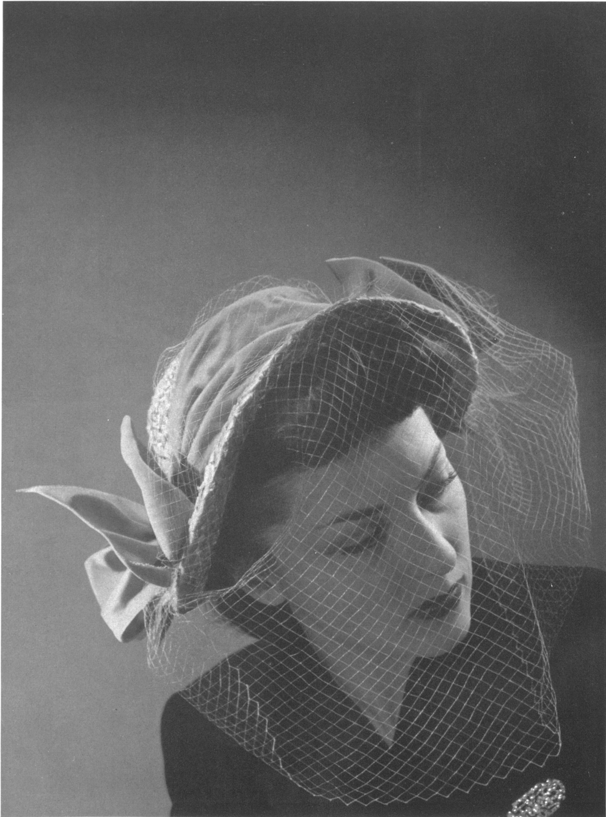
Stäger & Cie S. A., Villmergen Sombrero en trenzado de paja Modèle Bachler, Berne