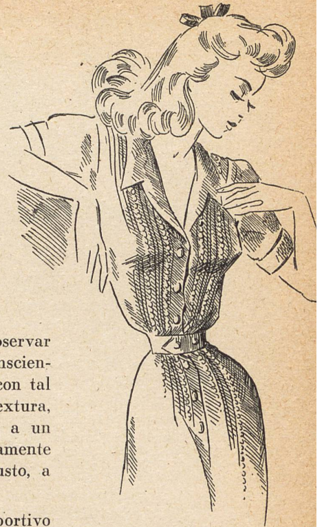
3. Modelo Mc Cutcheon's de batista de rayón importada de Suiza.

Los comerciantes al por mayor y los detallistas americanos hacen observar todos ellos que sus parroquianas se han vuelto «quality conscious», conscientes de la calidad, y que ya no se contentan de un tejido cualquiera con tal de que sea de un bonito color. La perfección del material, del la textura, del acabado, del tinte, son cualidades fundamentales que confieren a un tejido su valor real y a un vestido su «chic» inimitable. Eso es precisamente lo que las industrias suizas pueden ofrecer a la mujer de buen gusto, a aquellas que saben apreciar la verdadera elegancia.