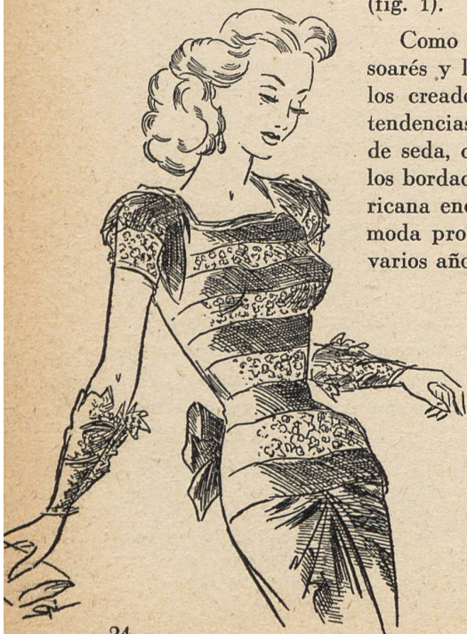
2. Traje de soaré, creación original de Boué Sœurs, Nueva-York — «Glamorous Evening», cuerpo de encaje recamado de oro sobre tul castaño oscuro, sobre falda de tafetán del mismo color con drapeados huecos y anudados en la espalda.

Como es natural, en los vestidos de falda larga que se llevan para las soarés y las cenas, así como en los elegantes trajes para casa, la fantasía de los creadores de modelos puede darse rienda libre para interpretar estas tendencias nuevas. Y es precisamente en la calidad inimitable de las telas de seda, de las finas batistas de rayón de los organdíes, de los encajes y de los bordados importados de Suiza, donde la alta confección y la costura americana encuentran un precioso auxiliar (fig. 2). No debe olvidarse, que si la moda procura producir efecto, impresión, la mujer americana que, durante varios años ha estado privada de artículos de lujo, busca a su vez la calidad.