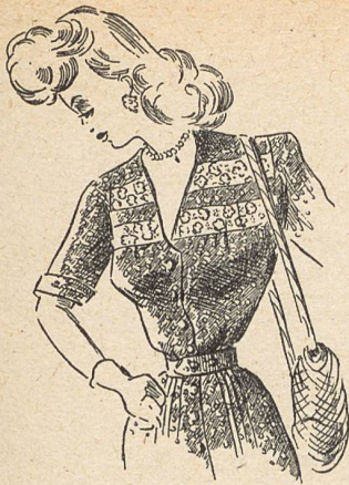
3. Modelo Mc Cutcheon's de «dotted swiss», bодоques suizos.