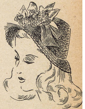
4. Sombrero de paja suiza de la Manufactura K. G. Hat Co.

No debe olvidárenos el mencionar a la población de Wohlen, en Argovia, para dar una imagen completa de la moda americana de 1947 (fig. 4). Este centro suizo donde se hacen los trabajos de paja y las trencillas para sombreros, contribuye muy ampliamente a abastecer a los sombrereros de Nueva-York y de todas las Américas. Y esta temporada, toda mujer verdaderamente preocupada por su elegancia y por la perfección de su toilette, llevará sombrero, el cual ha vuelto a ser el complemento indispensable de los conjuntos más elaborados, más coquetamente complicados que se podrán ver surgir desde Nueva-York a Hollywood, desde Chicago hasta la Nueva-Orleans, desde Miami hasta Palm-Springs.