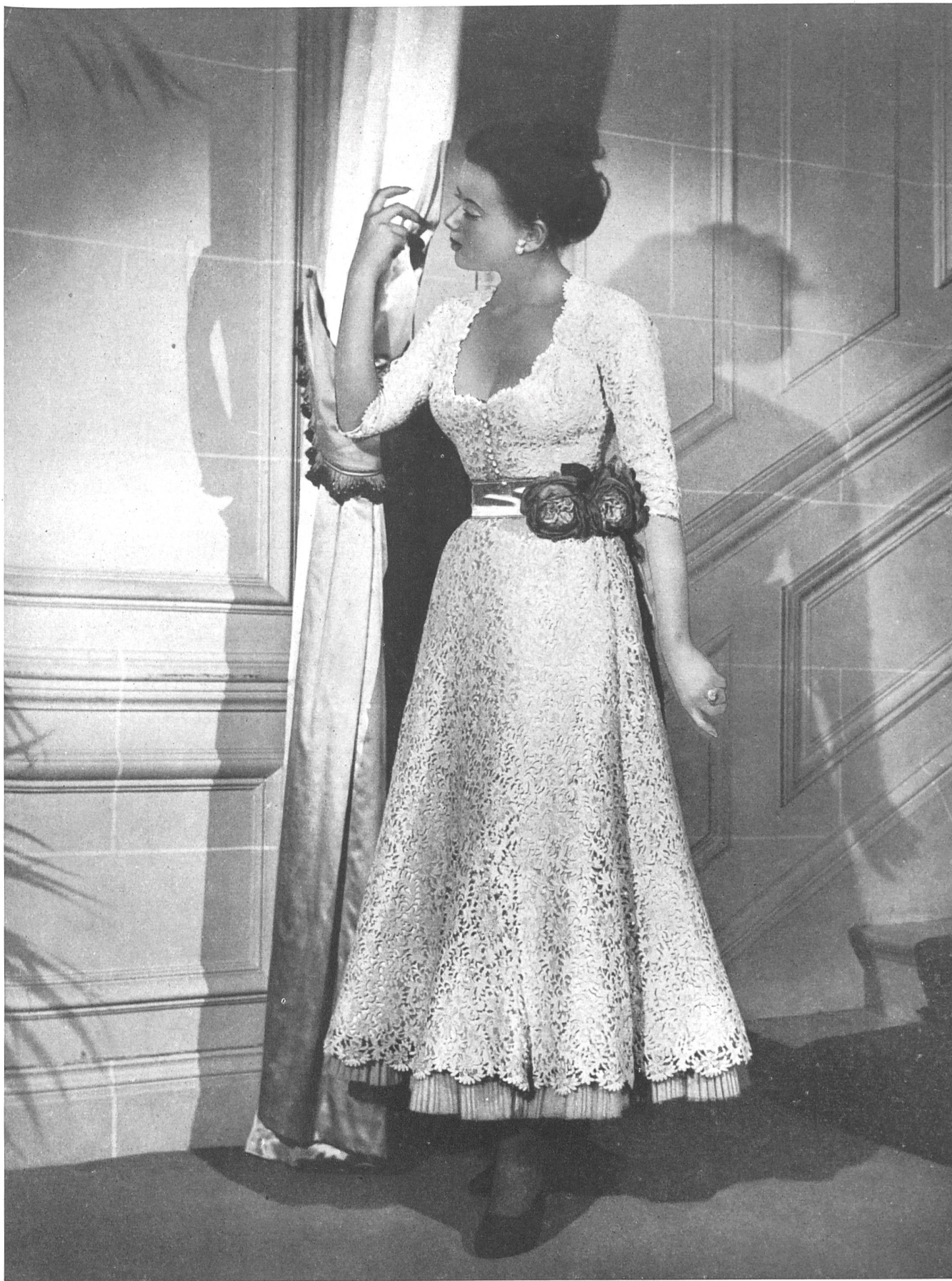
CHRISTIAN DIOR Aug. Giger & Co., St-Gall PIERRE BRIVET FILS, PARIS