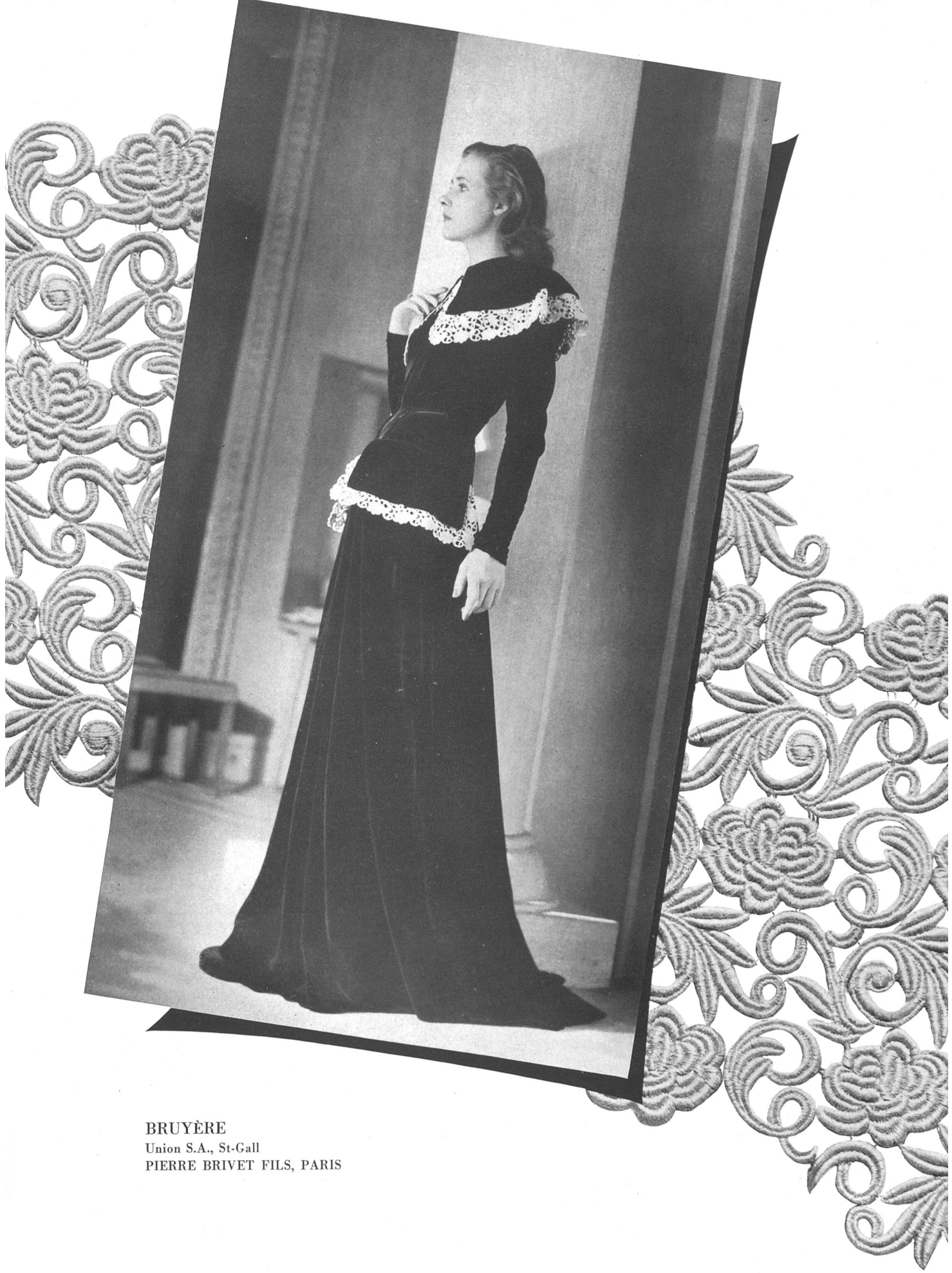
BRUYÈRE Union S.A., St-Gall PIERRE BRIVET FILS, PARIS