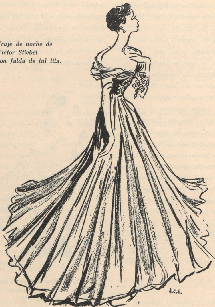
Traje de noche de Victor Stiebel con falda de tul lila.