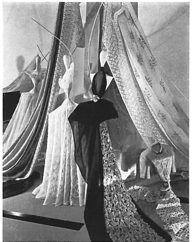
Vista de la presentación de los bordados y tejidos finos de San-Gall. Blick auf die St-Galler Stickereien und Feingewebe.