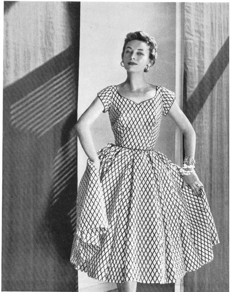
PAT PREMO A Plastoprint cotton fabric by Stoffel & Co., St-Gall.