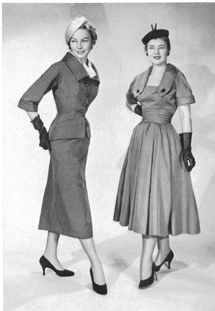
CHRISTIAN DIOR, NEW YORK

Rivalizando en ingenio, los telares americanos y los de Suiza u otros países de Europa inundan el mercado con hermosos tejidos de una variedad sin límites. Y la actual boga de emplearlos, mezclándolos de mil maneras