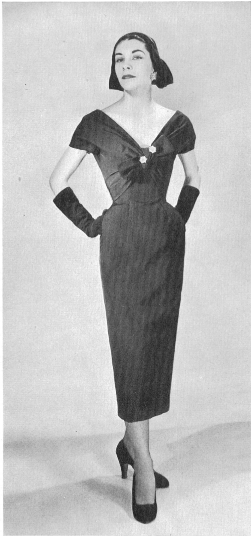
CHRISTIAN DIOR, NEW YORK

« Amadis » silk by L. Abraham & Cie, Soieries S. A., Zurich.