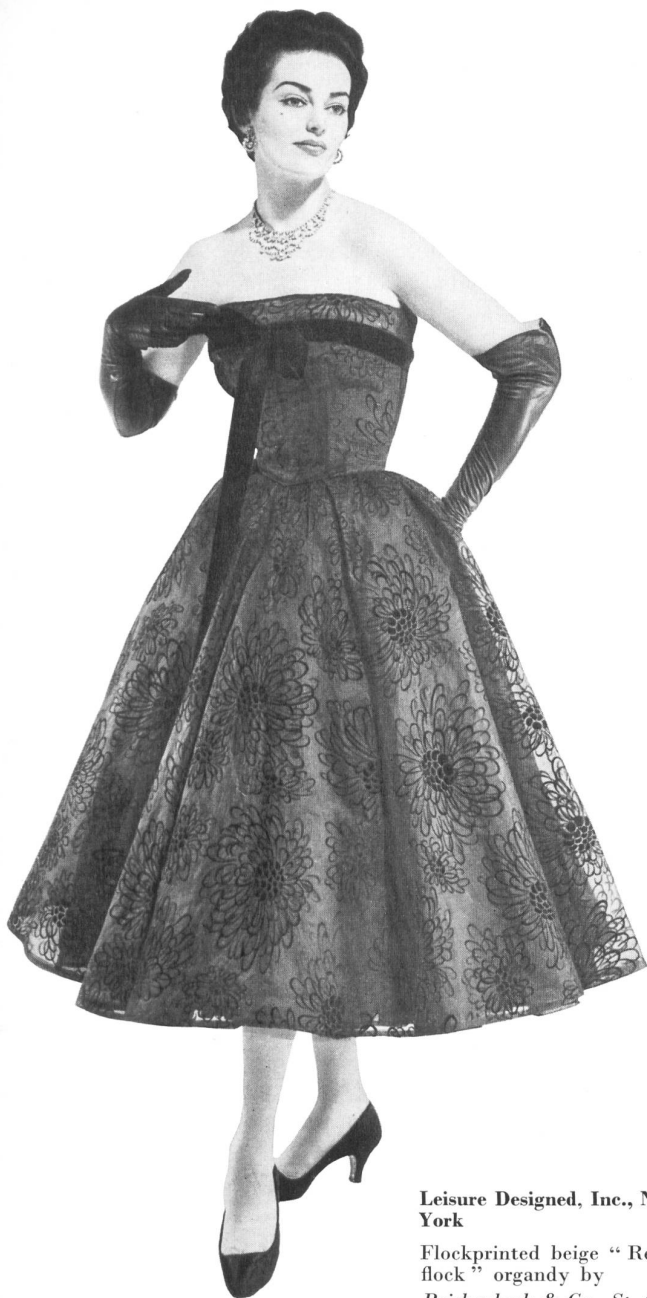
Leisure Designed, Inc., New York

Flockprinted beige "Reco-flock" organdy by Reichenbach & Co., St. Gall