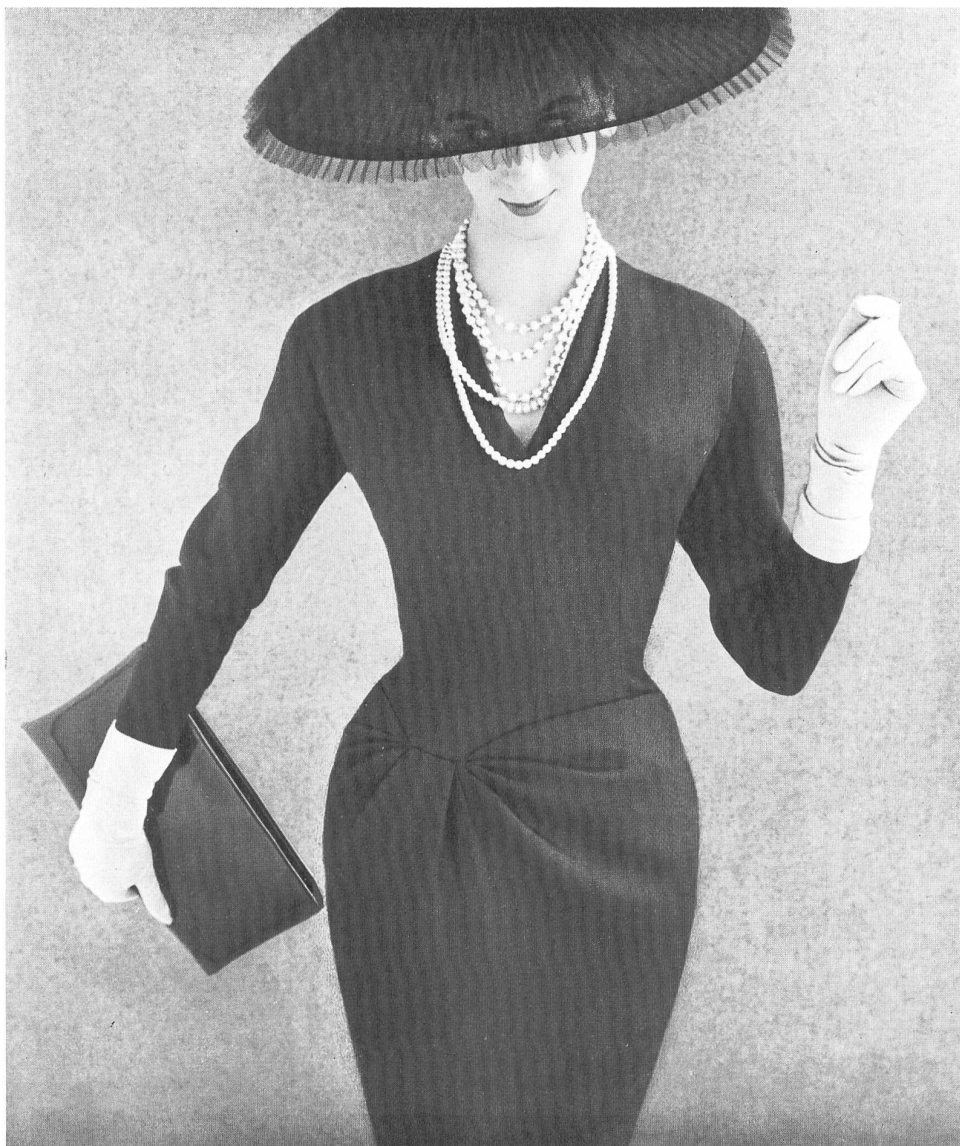
Roter Models Ltd., London Lamé crystal by Reiser & Co., Zurich.

Hemos de hacer observar aquí que, en general, el vestido se va adaptando a las situaciones nuevas, y debido a ello, la televisión, considerada como una ocasión para reuniones entre amigos, ha dado origen a una nueva moda. Se trata de asistir a las sesiones de televisión lo más confortablemente que sea posible. Aunque no sean completamente indispensables, los vestidos para televisión valen tanto como lo que cuestan ya que permiten economizar sobre el desgaste de los demás artículos de vestuario. Un sobretodo para televisión, de malla jersey roja, muy ajustado, abierto en los costados y completamente abotonado por delante, con anchos puños negros en mangas semilargas, de tres cuartos, y una banda también negra haciendo juego en el borde de la falda, me llamó la atención en la sección