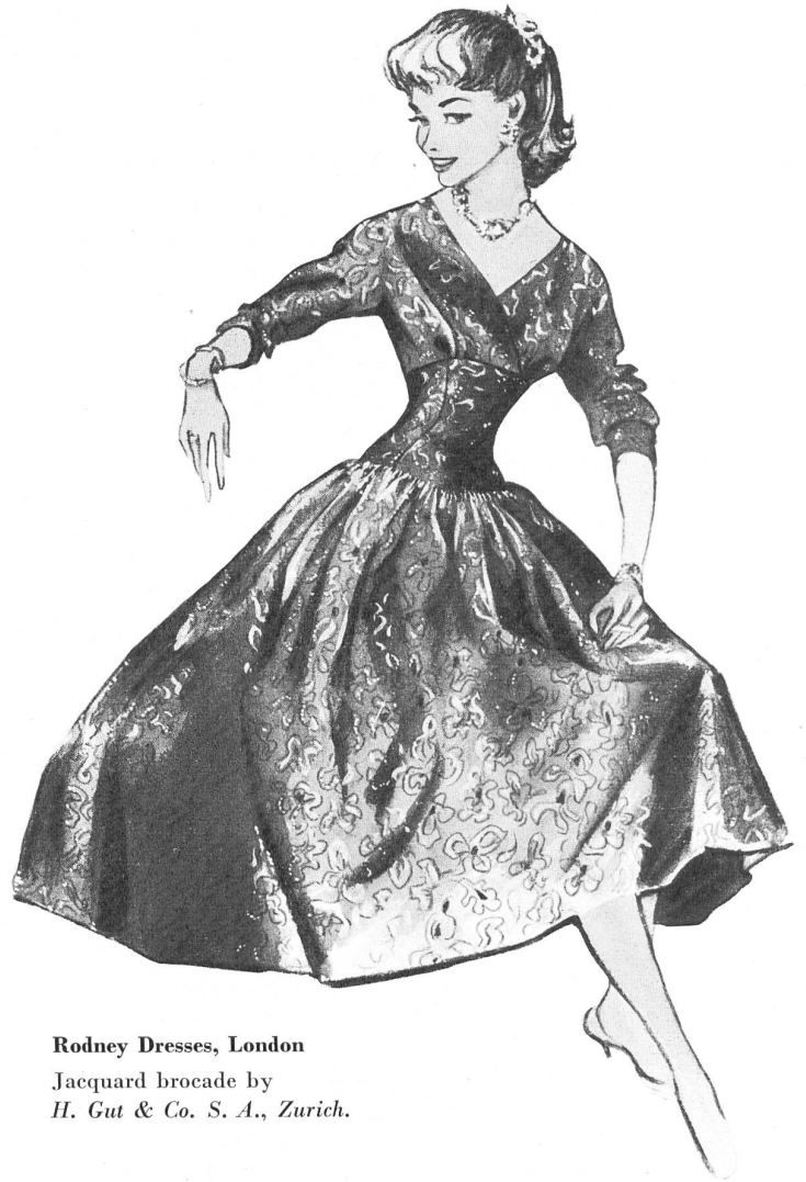
Rodney Dresses, London

A los fabricantes de vestidos no les embaraza la dificultad que presentan los hombres estrechos y el