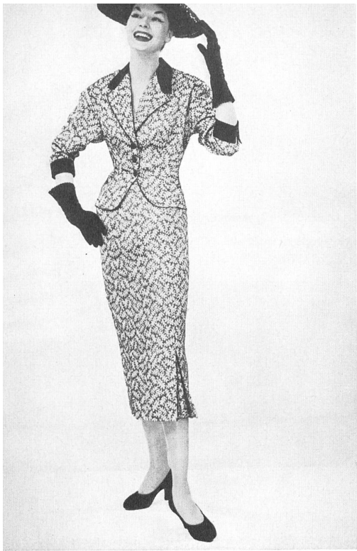
Jersey Mavèl, Amsterdam Panama façonné de Rudolf Brauchbar & Cie, Zurich