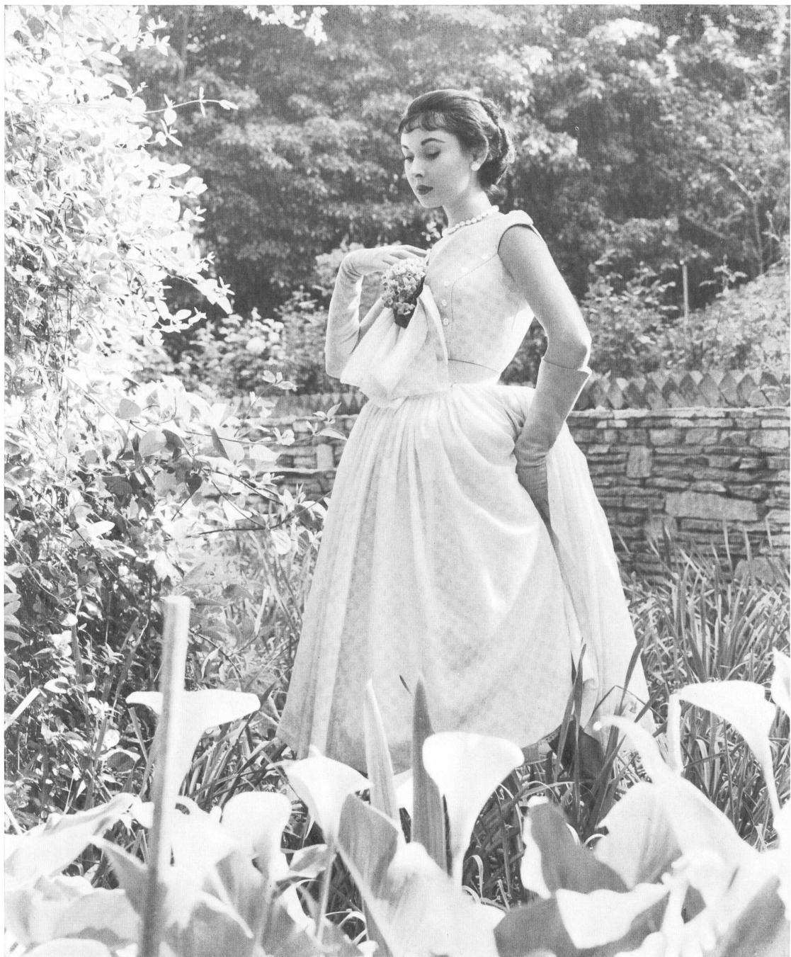
Blue check patterned cotton voile.

afamado salón de Hattie Carnegie. Dióse cuenta entonces de que era precisamente en esta esfera donde estaba su vocación y, ya durante su aprendizaje, estudió el dibujo en una escuela de bellas artes, aprendió la técnica del corte y del drapeado y, como tenía talento, empezó a vender dibujos suyos a las casas neoyorkinas fabricantes de ropa confeccionada.