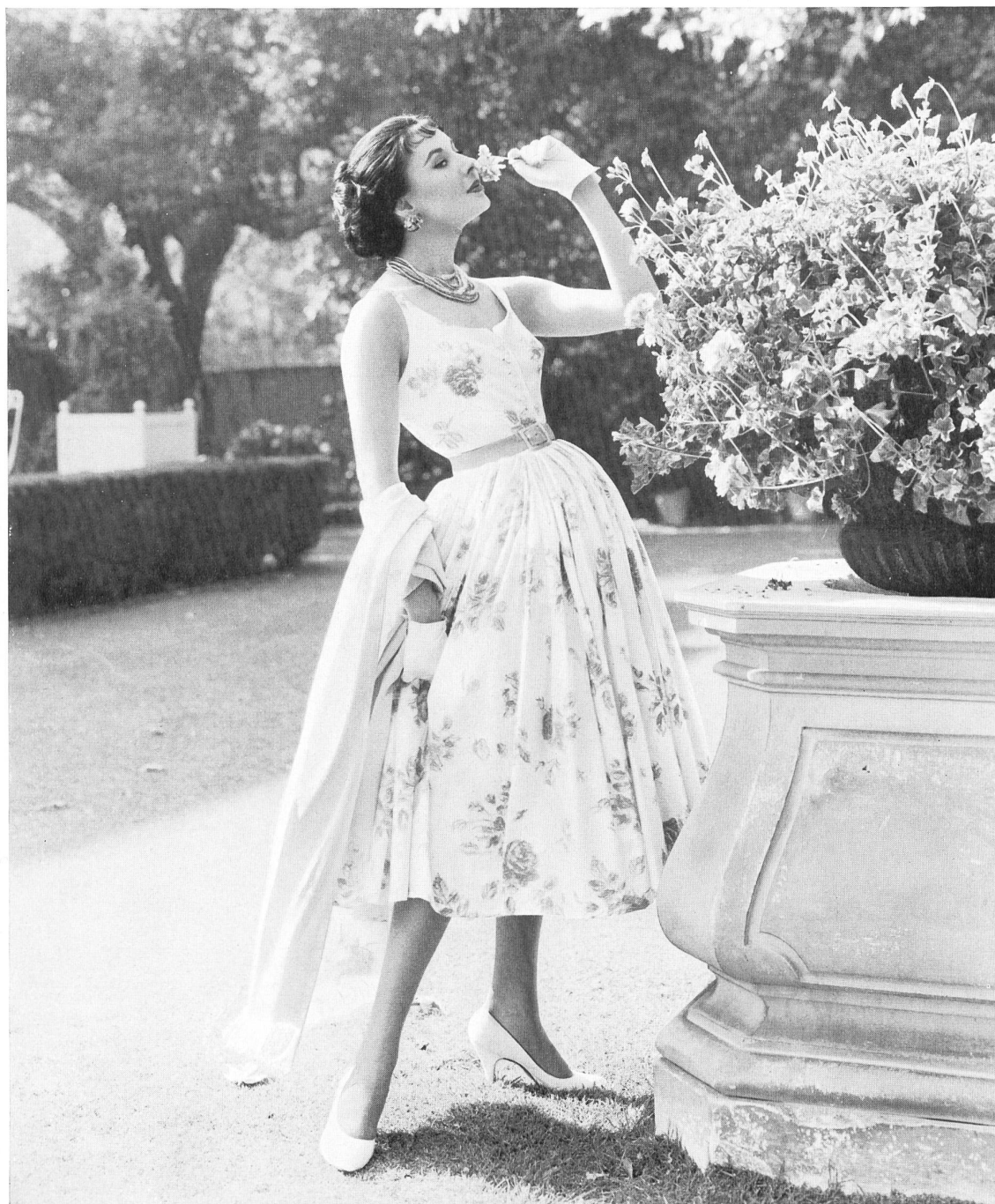
White cotton fabric with pink printed roses.

Esto nos hace volver la vista veintinueve años atrás, cuando James Galanos nació en Filadelfia, en una familia de emigrados griegos. Primeramente vivió en pequeñas poblaciones de Pensilvania y de Nueva Jersey hasta que salió del domicilio de sus padres a los dieciocho años para vender tejidos y procurar crearse relaciones en el