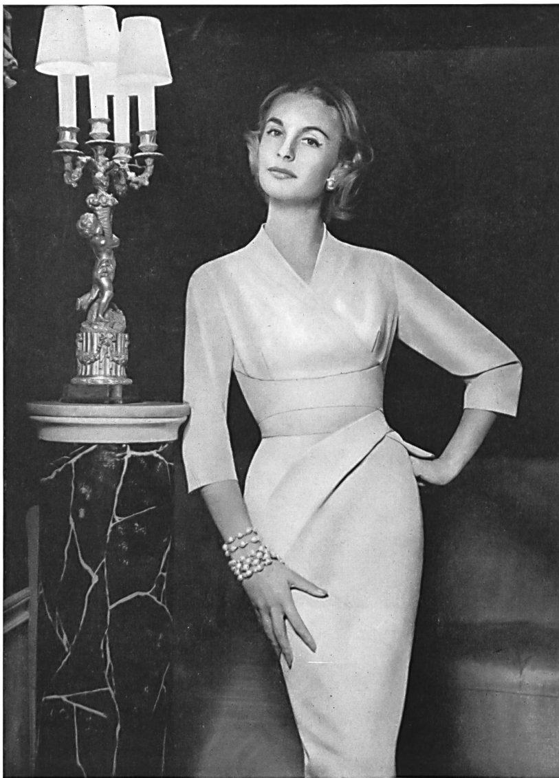
HEER & CO. LTD., THALWIL Draplyne fabric (rayon and wool). Model by Rembrandt, London