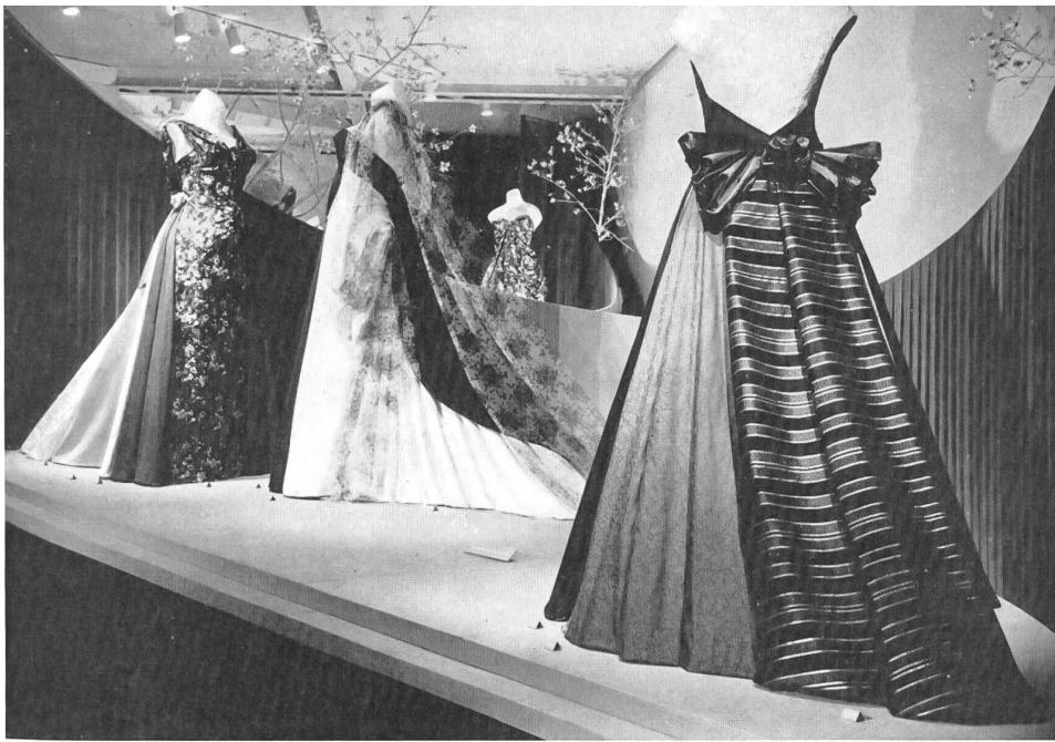
Exposition de l'industrie suisse de la soierie : pure soie, tulle, nylon. Display of the Swiss silk industry : pure silk, net, nylon. Exposición de la industria sedería suiza : seda pura, tul, nylon. Ausstellung der Schweiz. Seidenindustrie : reine Seide, Tüll, Nylon.