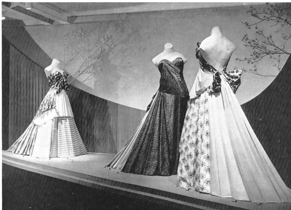
Exposition de l'industrie suisse du coton : tissus tissés en couleurs et imprimés. Display of the Swiss cotton industry : colour woven and printed fabrics. Exposición de la industria aldonera suiza : tejidos en colores y estampados. Ausstellung der Schweiz. Baumwollindustrie : Buntgewebe und Druckstoffe.